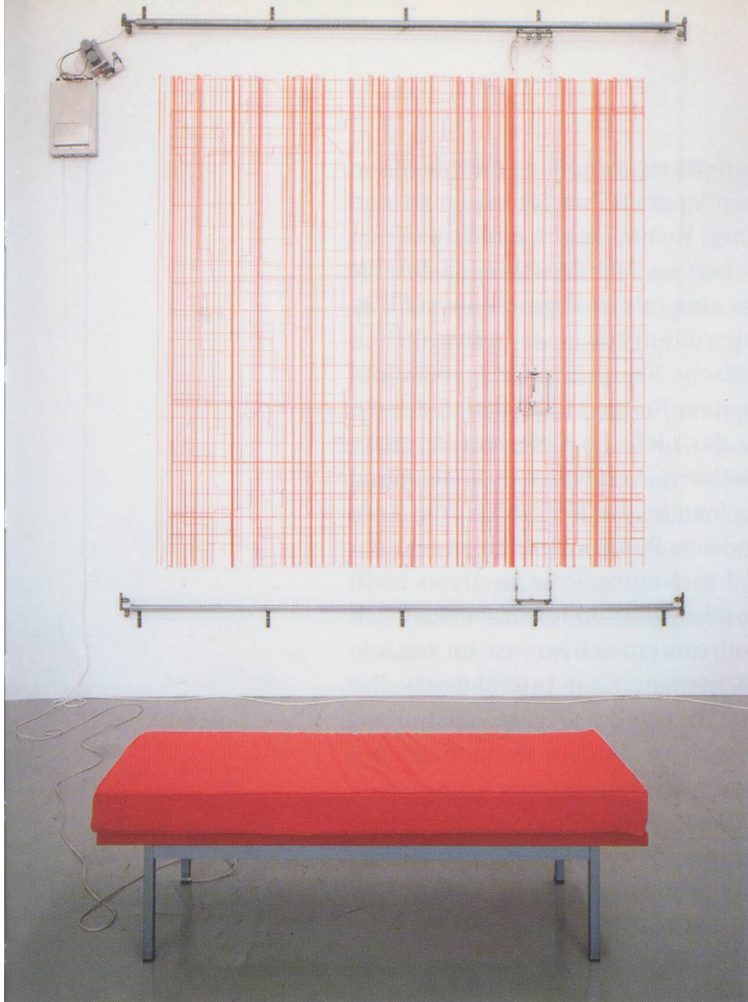
ANGELA BULLOCH, BETAVILLE, 1994, drawing machine (the machine draws vertical lines, unless someone sits on the bench, in which case the lines are horizontal), installation view, "The Cauldron," Henry Moore Institute, Leeds, 1996 / Zeichenmaschine, die vertikale Linien zeichnet, bis sich jemand auf die Bank setzt, worauf sie horizontale Linien zeichnet.