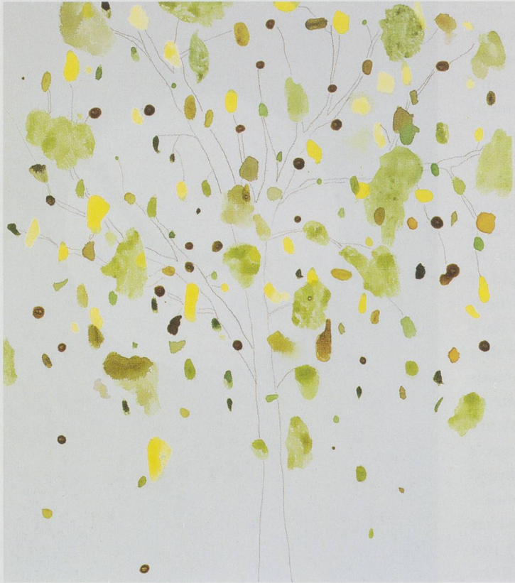
LAURA OWENS, UNTITLED , 1998, acrylic on canvas, 20 x 17½" / OHNE TITEL, Acryl auf Leinwand, 50,8 x 44,5 cm.

conversational and suggestive and to wear its doubts outright. It displays a certain nihilistic utopianism and is comfortable with oxymorons. It's not the kitsch and fiberglass of a dystopic Disneyland, but the spaced-out rigor of spending the day in the garden. It is interested in the bright light and negative space that is everywhere here and yet difficult to locate, and in prying out of the ether (now smog) some of the humor and pathos that was floated up there by Bas Jan Ader and John Baldessari circa 1970 (the year Laura was born).