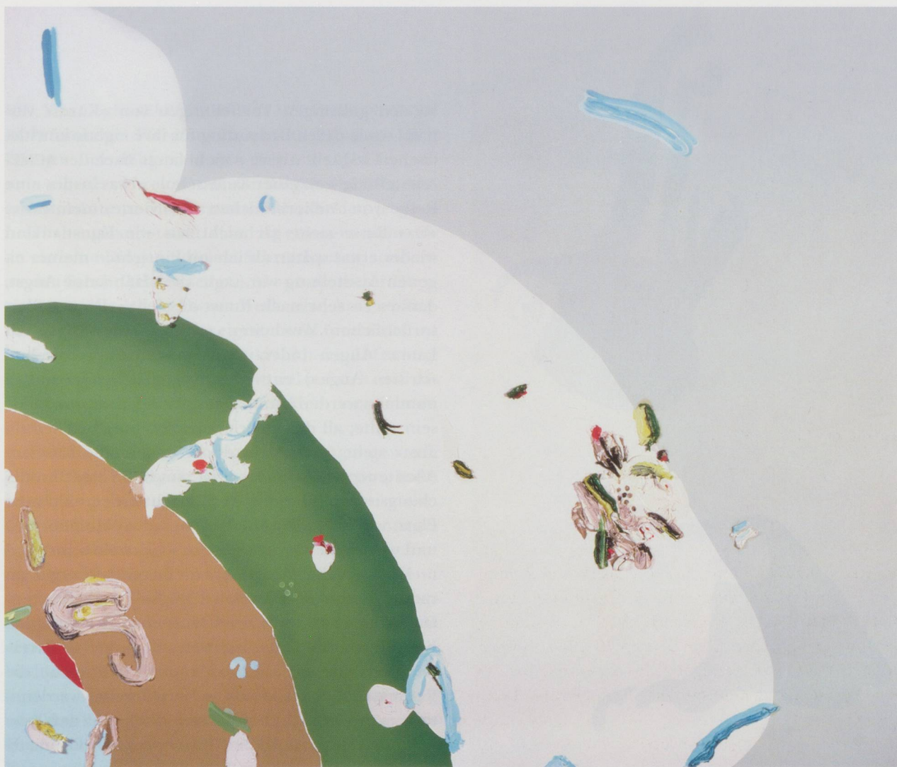
LAURA OWENS, UNTITLED, 1998, oil and acrylic on canvas, 84 x 96" / OHNE TITEL, Öl und Acryl auf Leinwand, 213,4 x 244 cm.

«die Ideen ausgegangen» seien, deshalb hatte sie die exakten Dimensionen der Galerie als Ausgangspunkt genommen und exakt passende Bilderfenster für ACME gemacht.