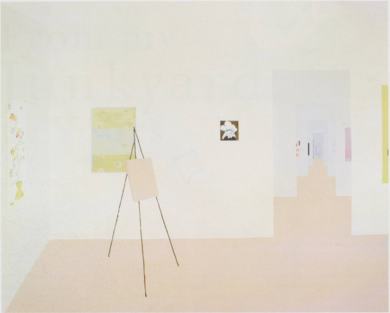
LAURA OWENS, UNTITLED , 1997, oil and acrylic on canvas, 96 x 120" / OHNE TITEL , Öl und Acryl auf Leinwand, 244 x 305 cm.

loved this about the work: it was anecdotal and expansive; it didn't stop at its edges. Here was the private mania of painting with a sociable side, addressing the specific circumstances of its production and display.