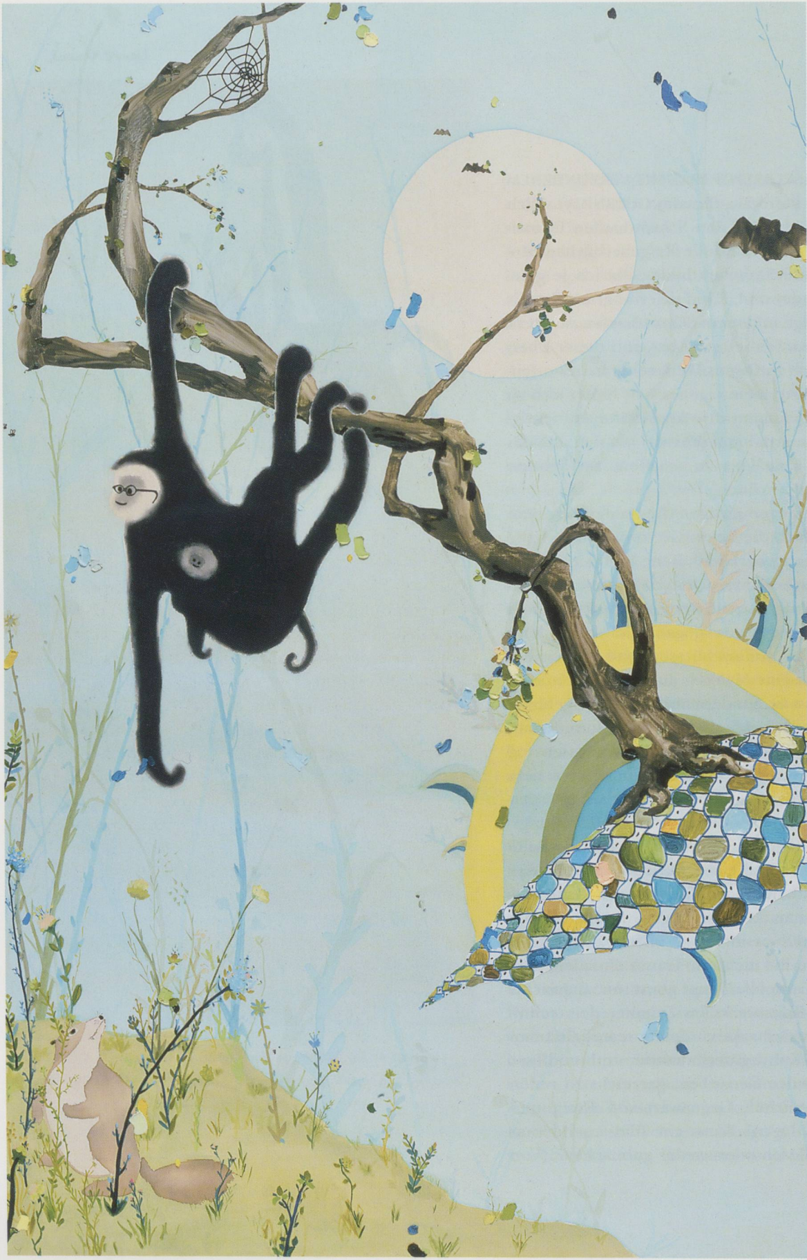
LAURA OWENS, UNTITLED, 2001, oil and acrylic on canvas, 106 x 67 1/2" / OHNE TITEL, Öl und Acryl auf Leinwand, 269,2 x 171,5 cm.