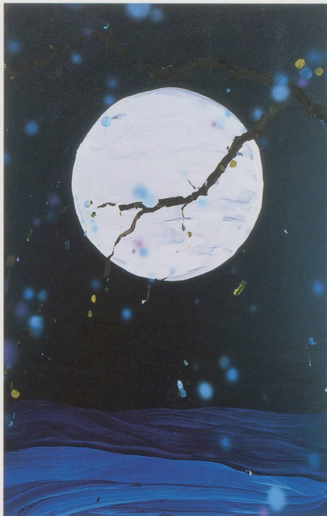
LAURA OWENS, UNTITLED , 2000, acrylic and oil on canvas, 110 x 72" / OHNE TITEL, Acryl und Öl auf Leinwand, 280 x 183 cm.

With all the open-ended practices out there, I think it’s hard to make open-ended paintings (I mean the edges are right there), but Laura manages it by diversifying: one painting rarely follows logically upon the last, except by a logic of inclusiveness and eclecticism. This is painting that’s not only self-conscious, but conscious of its surroundings, right down to the wall that it’s on and the room that it’s in. This is the condition and the conundrum of Laura’s practice—intense reverence for the histories and conventions of the production and display of paintings on the one hand, toying with them on the other hand, and the explicit transformation of this conversation into content: How to make a painting now? What to do with it? and even, What’s the point? Not as in, Is painting dead?—something that would never occur