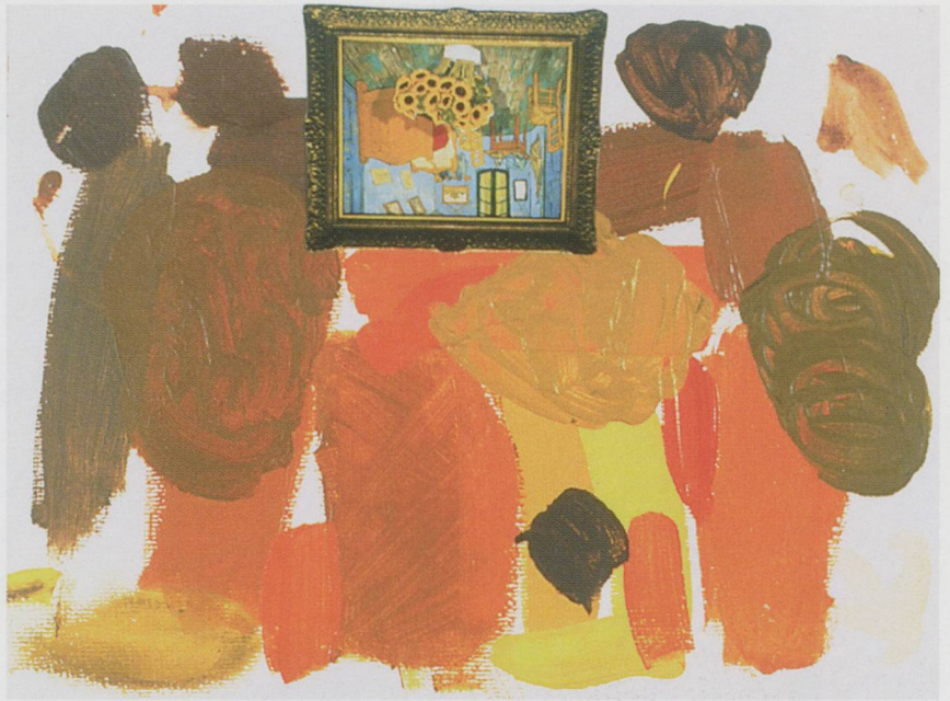
LAURA OWENS, UNTITLED, 1998, acrylic and photo collage on watercolor paper, 9 1/2 x 12 1/2" / OHNE TITEL, Acryl und Photocollage auf Aquarell- papier, 24,1 x 31,8 cm.

Zeit zu Zeit ruft Laura mich an, um mir Fragen zu stellen wie diese: «Könnten wir nicht eine Revolution anzetteln?»