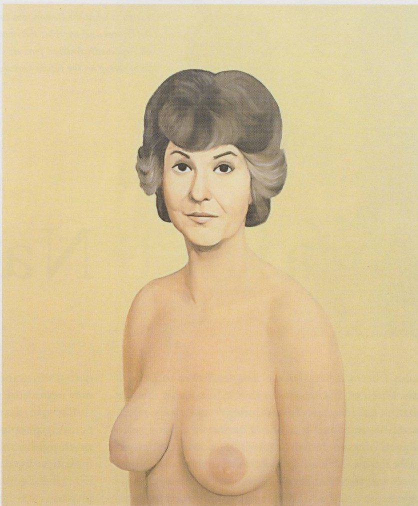
JOHN CURRIN, BEA ARTHUR NAKED, 1991, oil on canvas, 38 x 32" /