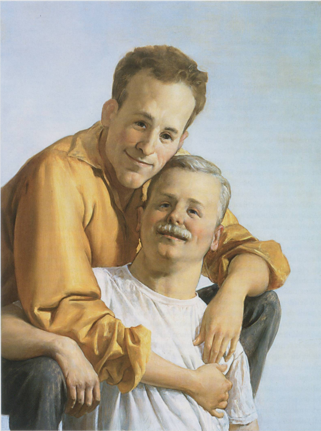
JOHN CURRIN, TWO GUYS, 2002, oil on canvas, 48 x 36" / PAAR, Öl auf Leinwand, 122 x 91,4 cm.