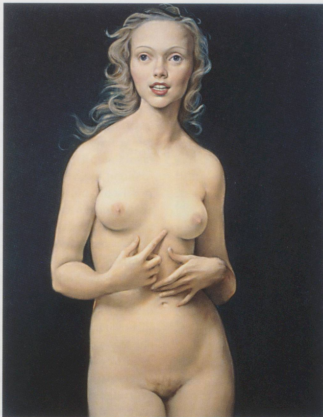
JOHN CURRIN, HONEYMOON NUDE, 1998, oil on canvas, 46 x 36" / FLITTERWOCHEN-AKT, Öl auf Leinwand, 116,8 x 91,4 cm.

im Gewande der Mythologie daherkam. Der Akt war eben nicht irgendein Mädchen von der Strasse, sondern Venus. Manet gab diesen Vorwand auf. Olympia war nicht Venus, sie war ein Mädchen von der Strasse – eine Strassenhure. Und dadurch wurde der Künstler implizit plötzlich zum Zuhälter, zum Anbieter von Weiblichkeit als Ware. Diese Vorstellung wirkte genauso schockierend wie der Anblick eines Flitzers im Museum, obwohl Manet eigentlich nur sichtbar machte, was schon immer da war: die Nacktheit des Aktes.