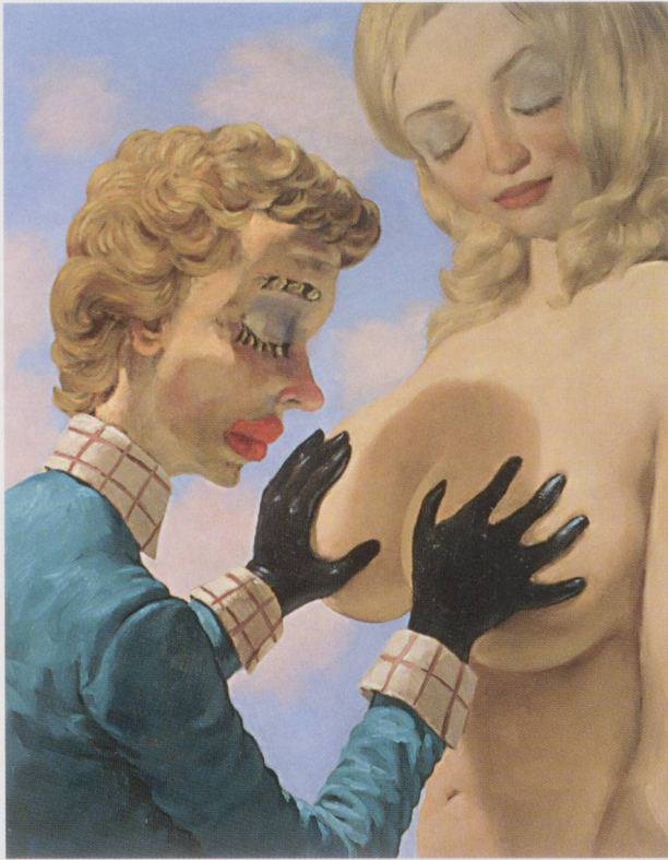
JOHN CURRIN, THE WIZARD , 1994, oil on canvas, 32 x 26" /

DER ZAUBERER, Öl auf Leinwand, 81,3 x 66 cm.