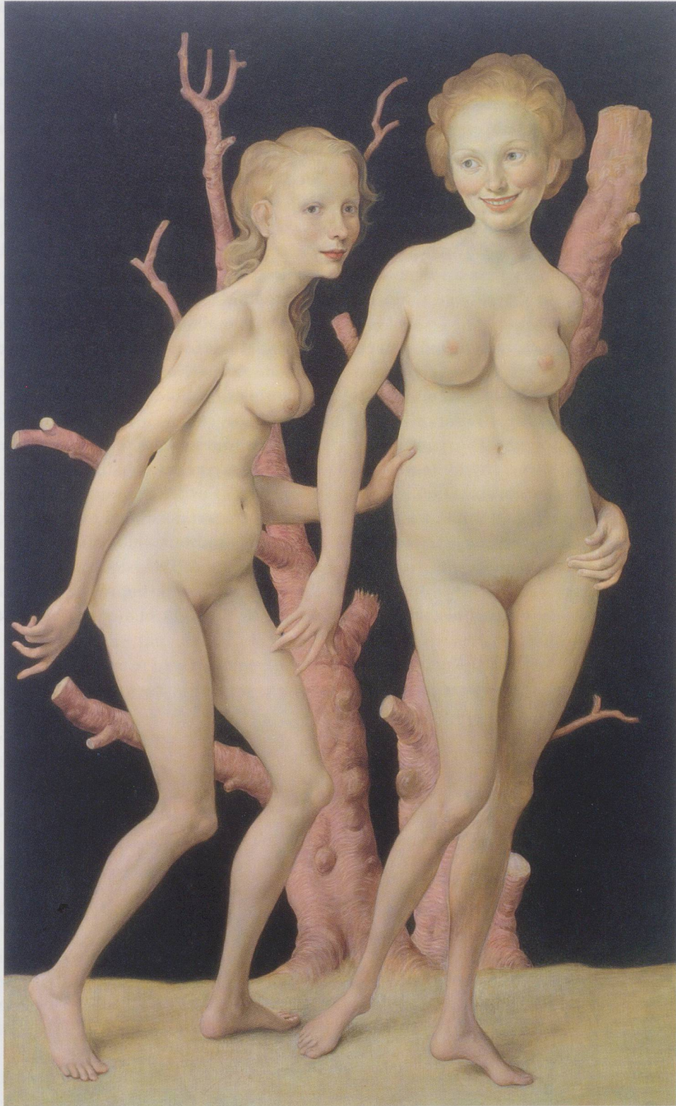
JOHN CURRIN, THE PINK TREE , 1999, oil on canvas, 78 x 48" / DER ROSA BAUM , Öl auf Leinwand, 198 x 122 cm.