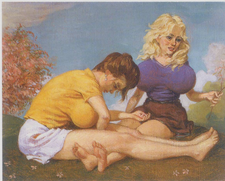
JOHN CURRIN, DOGWOOD, 1997, oil on canvas, 11 x 14" / ROTER HORNSTRAUCH, Öl auf Leinwand, 28 x 35,6 cm.

"To whatever extent painting can be considered a moral act," Currin has said, "it necessarily goes in one of the worst possible directions... You can't make a painting without embracing your own desire as something good." 2 ) No doubt this is especially true of the nude, which—owing to the nature of the desires piqued by the sight of a naked body—thus becomes