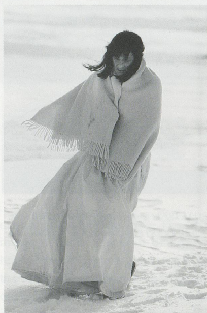
MIKE PARR, THE END OF NATURE, 1998, performance and video, Baltic Sea, Sweden, 18 February / DAS ENDE DER NATUR, Performance und Video an der Ostsee, Schweden.

Das wirft Fragen nach dem Ausmass echter körperinterner Veränderungen in der Performancekunst auf. Wenn es möglich ist, das vegetative Nervensystem bewusst zu beeinflussen, gibt es dann noch etwas, was der Körper nicht tun kann? Körperliche Rituale, wie Parr sie vollzieht, lassen vermuten, dass es Performances gibt, in denen die körperliche Erfahrung trotz vorgegebener Umstände nicht «inszeniert» ist. Der Körper reagiert dabei mit «realen»