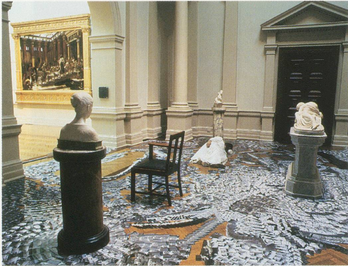
MIKE PARR, SHALLOW GRAVE , 2000, 3-day performance, Art Gallery of New South Wales, 12th Biennale of Sydney, 7–9 July / FLACHES GRAB, 3-tägige Performance.

Öffnung verstehen, durch welche der Künstler sich von diesem nationalen Vokabular abgrenzen und lernen kann, unabhängig zu denken, da er nicht länger die Braut ist, die das Volk sich vorstellt. Es ist ironischerweise eine symbolische Scheidung, durch die der Künstler sich aus dem kollektiven Bilderschatz löst und die Galeriebesucher auffordert eine ähnliche Schwelle zu überschreiten. Parr erklärt, dass in diesem Sinn des Überschreitens einer Schwelle die Braut für ihn «das beherrschende Thema» seiner Arbeiten der 90er Jahre wurde. 7)