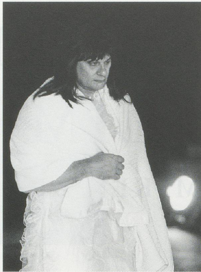
MIKE PARR, THE WHITE HYBRID (FADING) , 1996, 3-day performance, Cowper Wharf, Artspace, Sydney, 13–15 September / DIE WEISSE HYBRIDE (SCHWINDEND), 3-tägige Performance.

performances in which the experience of the body is not “staged” despite the circumstances of the event. Here the body is responding to a climate with “real” 1) effects in a necessary way which we might call the liminal corporeal.