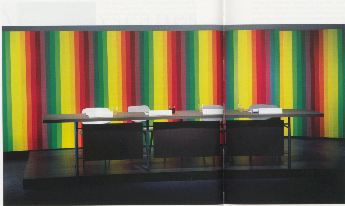
THOMAS DEMAND, STUDIO, 1997, C-Print Diasec, 183,5 x 349,5 cm / 72 1/8 x 137 7/8".

design of a world in which the only thing that is real is the image of the world. The image of the world is the only thing that is real. The image of the world is the only thing that is real.