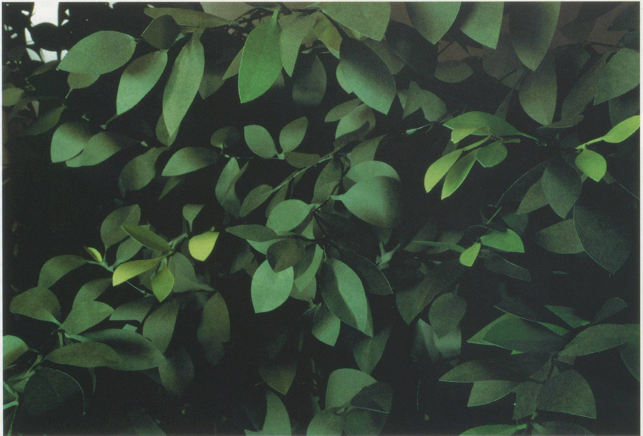
THOMAS DEMAND, HECKE / HEDGE, 1996, C-Print Diasec, 100 x 140 cm / 39 3 / 8 x 55 1 / 8 ".