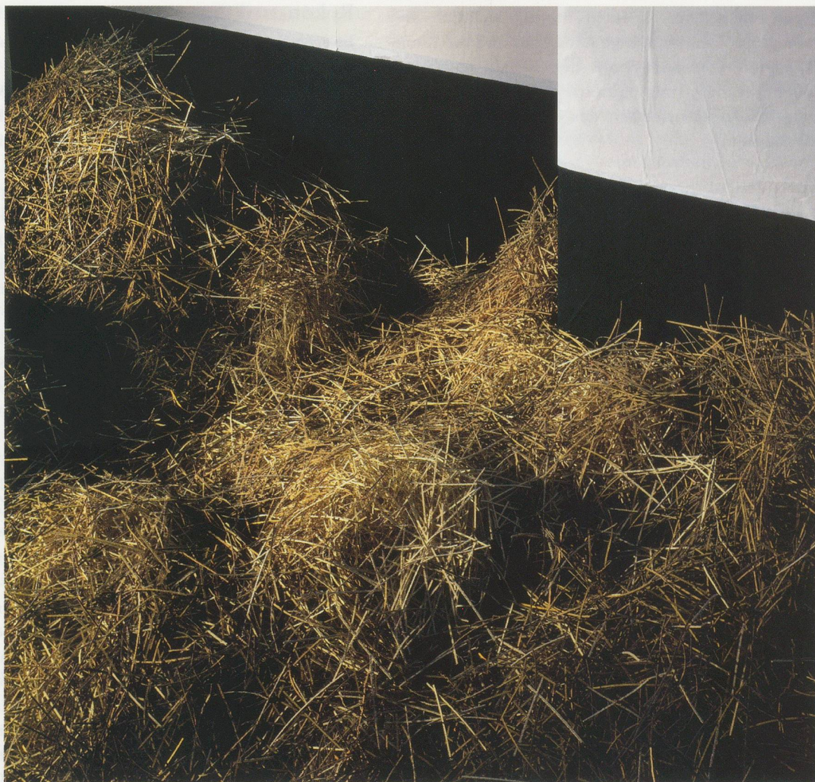
THOMAS DEMAND, STALL / STABLE , 2000, C-Print Diasec, 110 x 132 cm / 43 7 / 16 x 52".

mischpults stehend kontrolliert man wissend das Fading von Illusion zu Realität (und zurück). Als DJ der eigenen Erfahrung entscheidet man selbst, wie man von dem einen Track in den anderen überblendet. So kann man sich in STALL (2000) seelenruhig durch das Stroh wühlen ohne sich von der Illusion bedroht zu fühlen – schliesslich lässt sich der Prinz genauso leicht auch wieder in den Frosch zurückverwandeln: Ein Blick in die Ecke oben rechts auf das tapetenartig