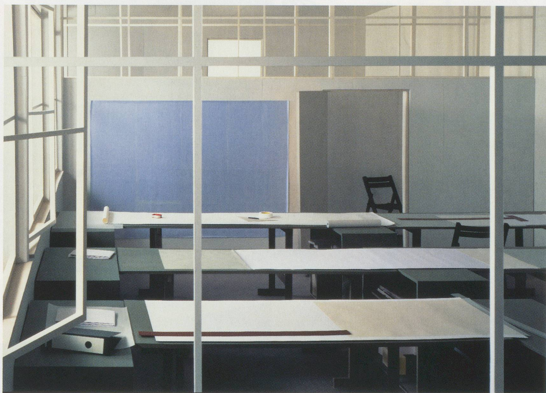
THOMAS DEMAND, ZEICHENSAAL / DRAFTING ROOM, 1996, C-Print Diasec, 183,5 x 285 cm / 72 1/4 x 112 1/5".