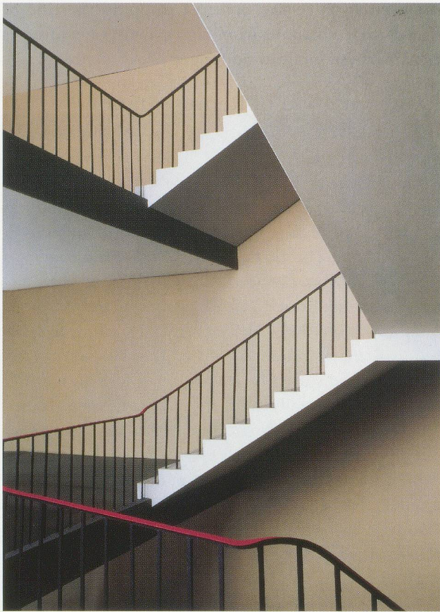
THOMAS DEMAND, TREPPENHAUS / STAIRCASE , 1995, C-Print Diasec, 150 x 118 cm / 59 x 46½".

then is the function of pictorial recourse to the fait divers from the daily press and television? The main concern is hardly the content of the evoked anecdotes; the use of them is too understated (and sometimes only discovered fortuitously, for example by reading secondary literature). Their significance must lie elsewhere. In view of Demand's deconstruction of photography, one might plausibly argue that the themes of his pictures primarily serve as catalysts of memory. Not the memory of a specific event but memory as a technique of conjuring world, which offers an alternative to the above-mentioned cultural practice of photography as a reality check. (As a recent commercial puts it, "a vacation without photos is like an event without a memory.") The paradigm of memory turns the ça a été of a photographically de-