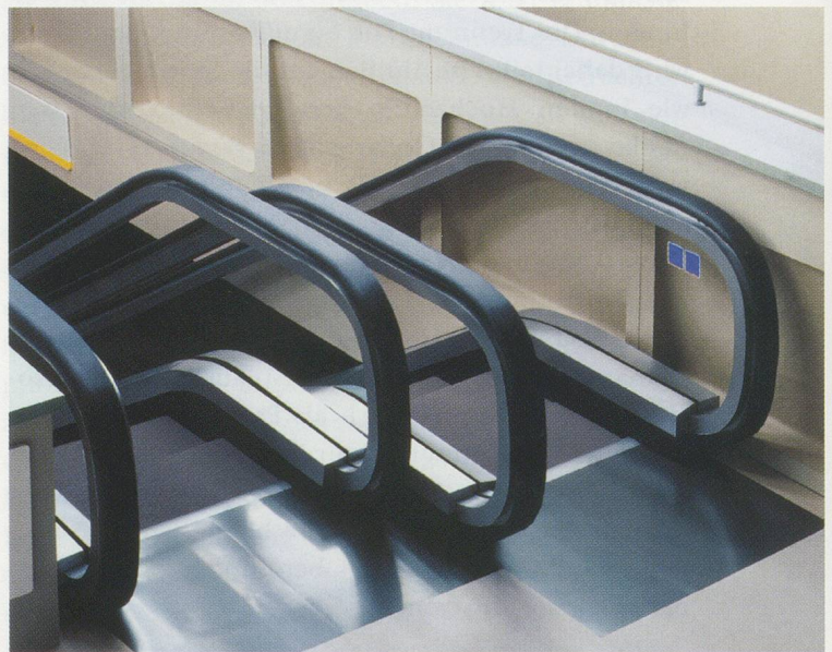
THOMAS DEMAND, ROLLTREPPE / ESCALATOR, 2000, 35mm-Film / 35mm film.