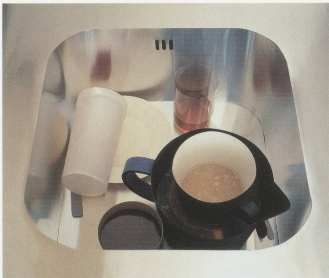
THOMAS DEMAND, SPÜLE / SINK, 1997, C-Print Diasec, 52 x 56,5 cm / 20½ x 22¼".