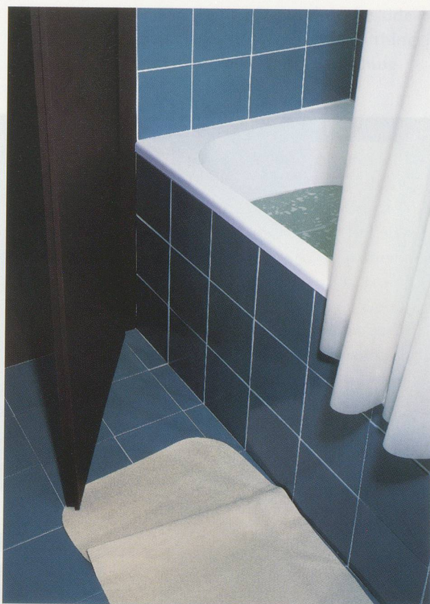
THOMAS DEMAND, BADEZIMMER / BATHROOM , 1997, C-Print Diasec, 160 x 122 cm / 63 x 48".

To a certain extent Demand's art might be described as reconstruction. It shows spatial situations that once existed as such. We are often ignorant of their origin—geographical or otherwise. Sometimes they are a product of the artist's memory, but they are more frequently based on photographs. Photographs that were often taken to document a situation. The scene of a crime, for example. Through the “reconstruction” of this “photographic evidence” in large-scale models made of paper and cardboard, the photographic impetus of “testifying” spills over into Demand's pictures—the ça a été (that happened), declared by Roland Barthes to be the fundamental message of any photograph. Regarding the will to reconstruct, Demand's pictures even outdo the photograph inasmuch as they are not content to deal only