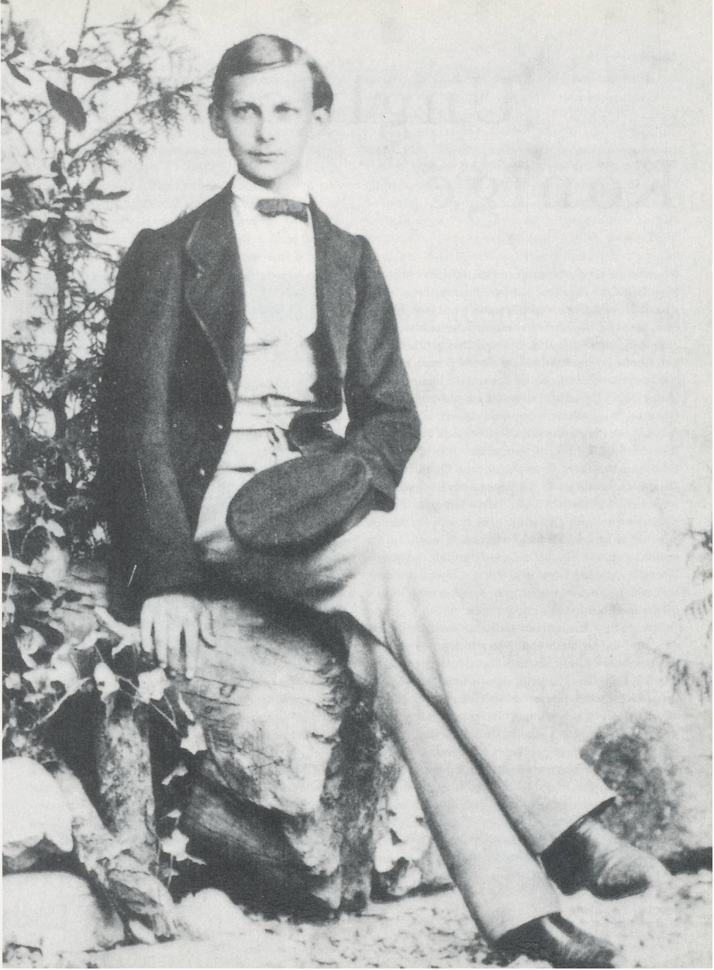
Ludwig II at the age of 16 / im Alter von 16 Jahren, 1861. (FROM/AUS: WILFRED BLUNT, THE DREAM KING)