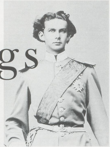
Ludwig II at the age of 19 / im Alter von 19 Jahren, 1864.

I wanted to start to think about the nature of fantasy in Elizabeth Peyton's work: her fantasies as I imagined them, but especially my own. It seems as though some of our fantasies even intersect, on the level of simple subject matter if not that of pure feeling. We both are drawn to the phantasmagoria of royalty. I remember the surprised pleasure that came over me when quite by chance, in another artist's studio, I saw her portrait of Ludwig II of Bavaria. As in so many of Peyton's pictures, this portrait had the intimate quality of a miniature, although it measured seventeen by thirteen inches. I can only guess at what this kind of imagery means to Peyton (in her art, maybe I can; in her life, not at all). So I had to look inside, backward, to my own childhood, to those exaltations and perversions of a febrile child's brain just as he was breaking upon the first sieges of adolescence.