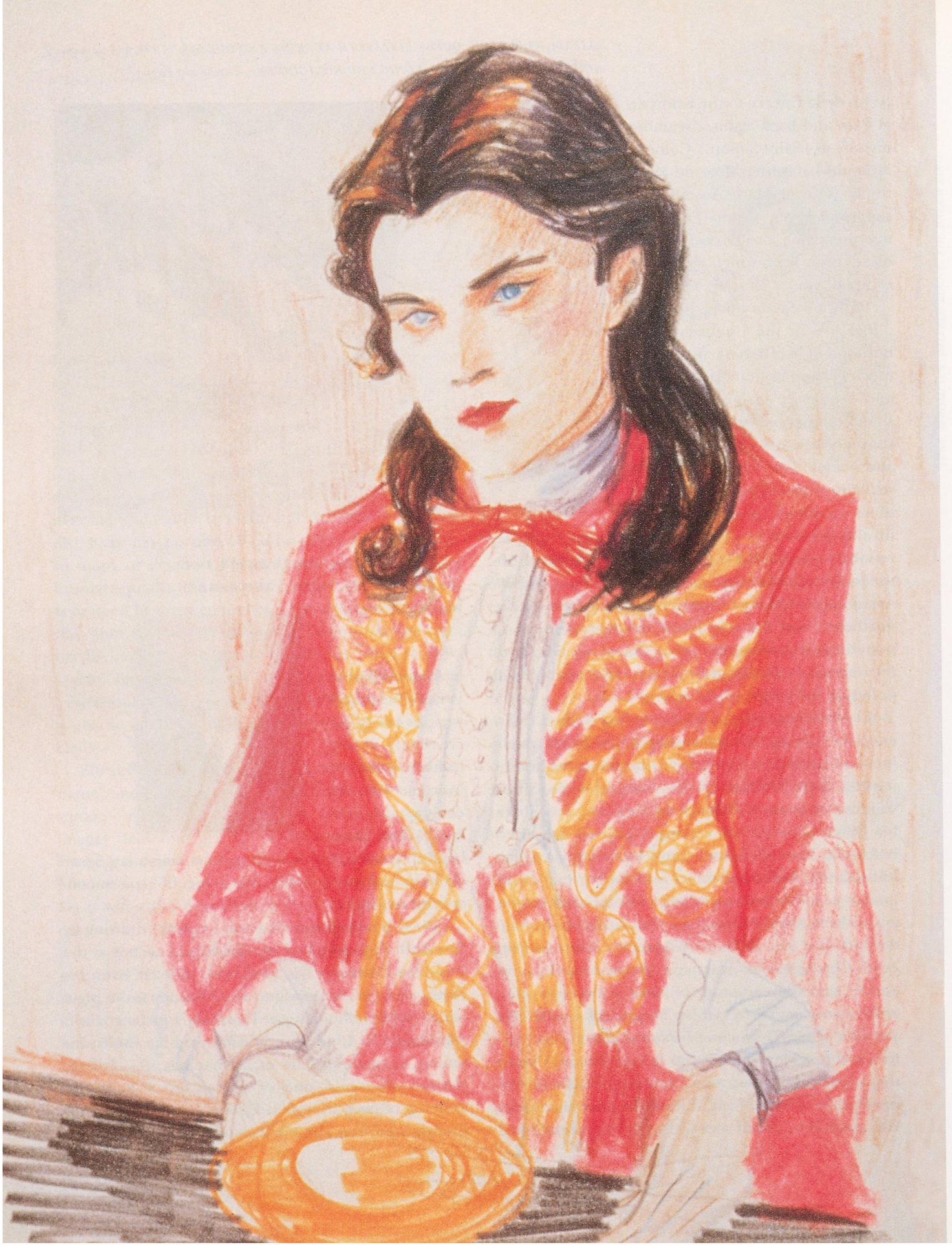
ELIZABETH PEYTON, LEONARDO DI CAPRIO AS LOUIS XIV, 1998, colored pencil on paper, 8 x 6" / LEONARDO DI CAPRIO ALS LUDWIG XIV., Farbstift auf Papier, 20,32 x 15,2 cm.