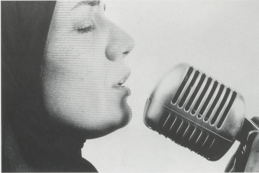
SHIRIN NESHAT, TURBULENT , 1998, video still.