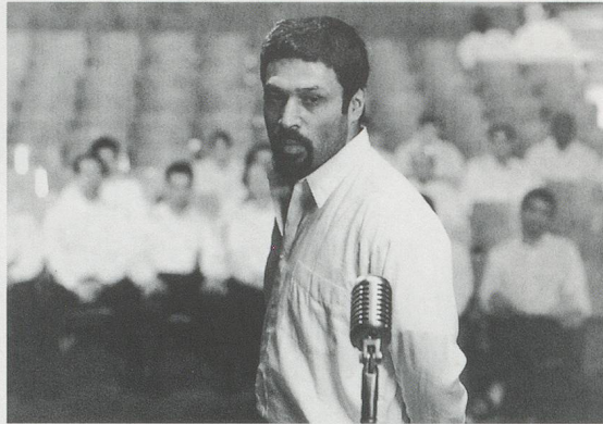
SHIRIN NESHAT, TURBULENT , 1998, 3 video stills, 1 production still / 3 Videostills, 1 Standaufnahme während der Produktion.

In TURBULENT , permutations, codes of conduct, and cycles of representation find themselves in a state of charged indeterminacy. The formal placement of Neshat's observations of Iranian women in a world of culturally inscribed limitations and their subsequent transcendence from their milieu become the foundation of an esthetic based on a negotiation between the different screens. Invocations of masculine and feminine, presence and absence, sight and sound—all are tenuous links in a game of spectral projection. Neshat's scenario offers a kind of suspended intrigue between two protagonists: A man and a woman, two singers, two symbolic vectors, face the viewer's space from opposite sides of the room. The man performs a classical love song based on the Persian poet Rumi's concept of divine love before an appreciative all-male audience; the woman performs—which in Iran is strictly prohibited—to an empty theater, which fills with the shards of her astonishing voice. In TURBULENT there is no solid ground. All perception, actions, and meanings take