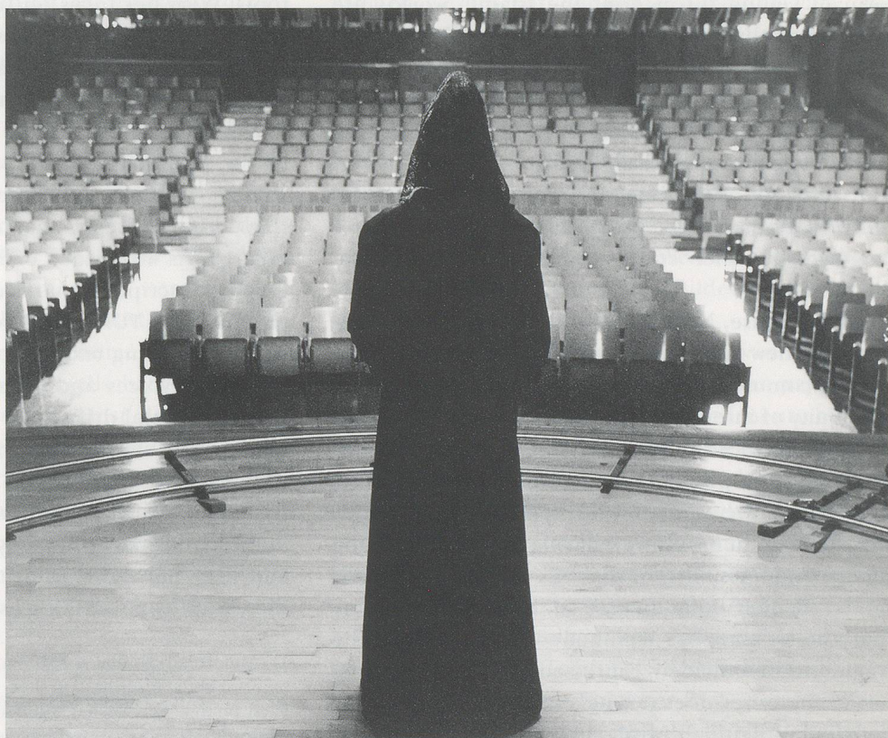
SHIRIN NESHAT, TURBULENT , 1998, production still / Standaufnahme während der Produktion.

On the two screens, several of confluences make themselves felt. Free to act, the man is bound to repeat what is known and identifiable within the given musical traditions of his culture, whereas the woman, driven by a history of prohibition, is compelled to invent a form which expresses, explodes, and reconfigures sound in a visceral stream of abstract and universal potential. Historical and contemporary issues of mysticism in Islam, namely the denial of woman's mystical potential in Sufi thought, and the phenome-