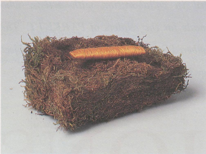
Love's Labor's Found.

Der goldene Faden, an dem die Liebe hängt.