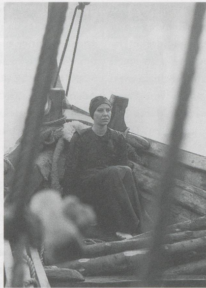
LARS VAN TRIER, MEDEA, 1988, Videostill.

denz, Video als künstlerische Version des grossformatigen Fernsehens zu betrachten – was das Video-Festival bietet, hat nichts mit Fernsehen zu tun; auch nichts mit irgendeiner Ein- oder Mehrkanal-Installation in einer Galerie, mit einem Spaziergang durch interaktive Landschaften oder mit dem Warten auf das Erscheinen einer Web-Seite auf dem Computerbildschirm. Video kann zwar jederzeit in die Nähe dieser Medien oder Erfahrungen geraten – eines seiner charakteristischen Merkmale ist ja gerade die Verschmelzung verschiedener Medien: Film, Performance, Fernsehen, Plastik, digitale Kunst, usw. Video hat von allen etwas und ist doch mit keinem gleichzusetzen, denn in seiner subtilsten und vielleicht ehrlichsten Form ist Video eigentlich gar keine Kunst. Am zutreffendsten wäre wohl die Bezeichnung Semi-Kunst. (Ob das im Medium selbst begründet ist, oder nur einen augenblicklichen Stand der Entwicklung markiert, ist schwer zu sagen.) Es weckt häufig falsche Hoffnungen oder stösst auf Unverständnis, ja Feindseligkeit. Das ist um so be-