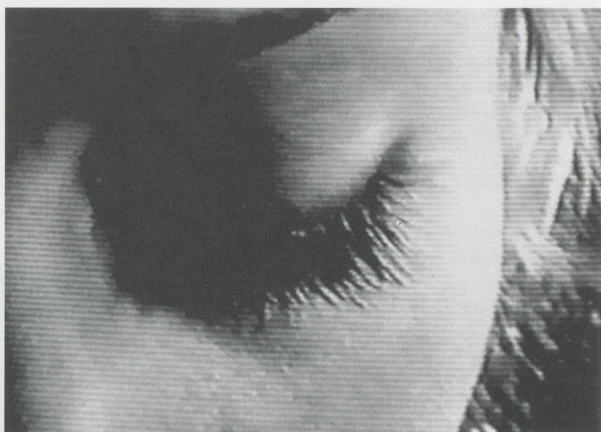
DOUG AITKEN, AUTUMN , 1994, video still.

to say.) As such its reception is often marked by false expectations, bafflement, or animosity. This is a great shame since video's “half-nature,” elusive and incomplete, is compelling and open to all manner of speculation and exploration.