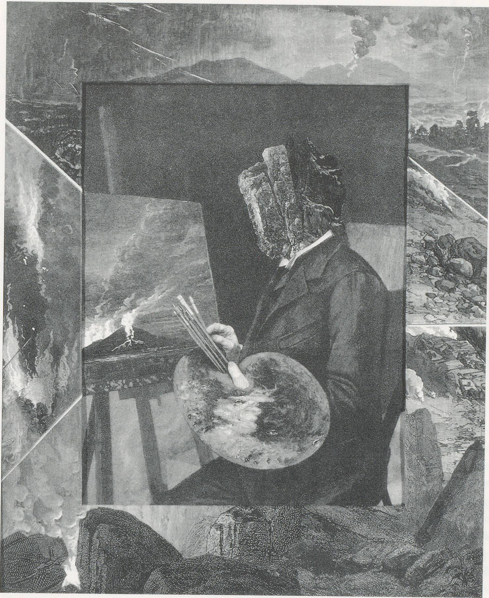
BRUCE CONNOR, PORTRAIT, 2/19/92, engraving-collage with Yes Glue 14½ x 12" /

PORTRÄT, 19.2.92, Radierungscollage mit Leim, 36,8 x 30,5 cm.