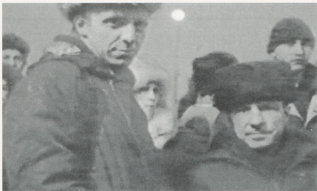
BORDERING ON FICTION: CHANTAL AKERMAN'S "D'EST," 1994, video still / AN DER GRENZE DER FIKTION: CHANTAL AKERMAN'S «D'EST».

stellungen zu beginnen und dann eine Kamerafahrt folgen zu lassen, wurde erst im Schneiderraum getroffen.