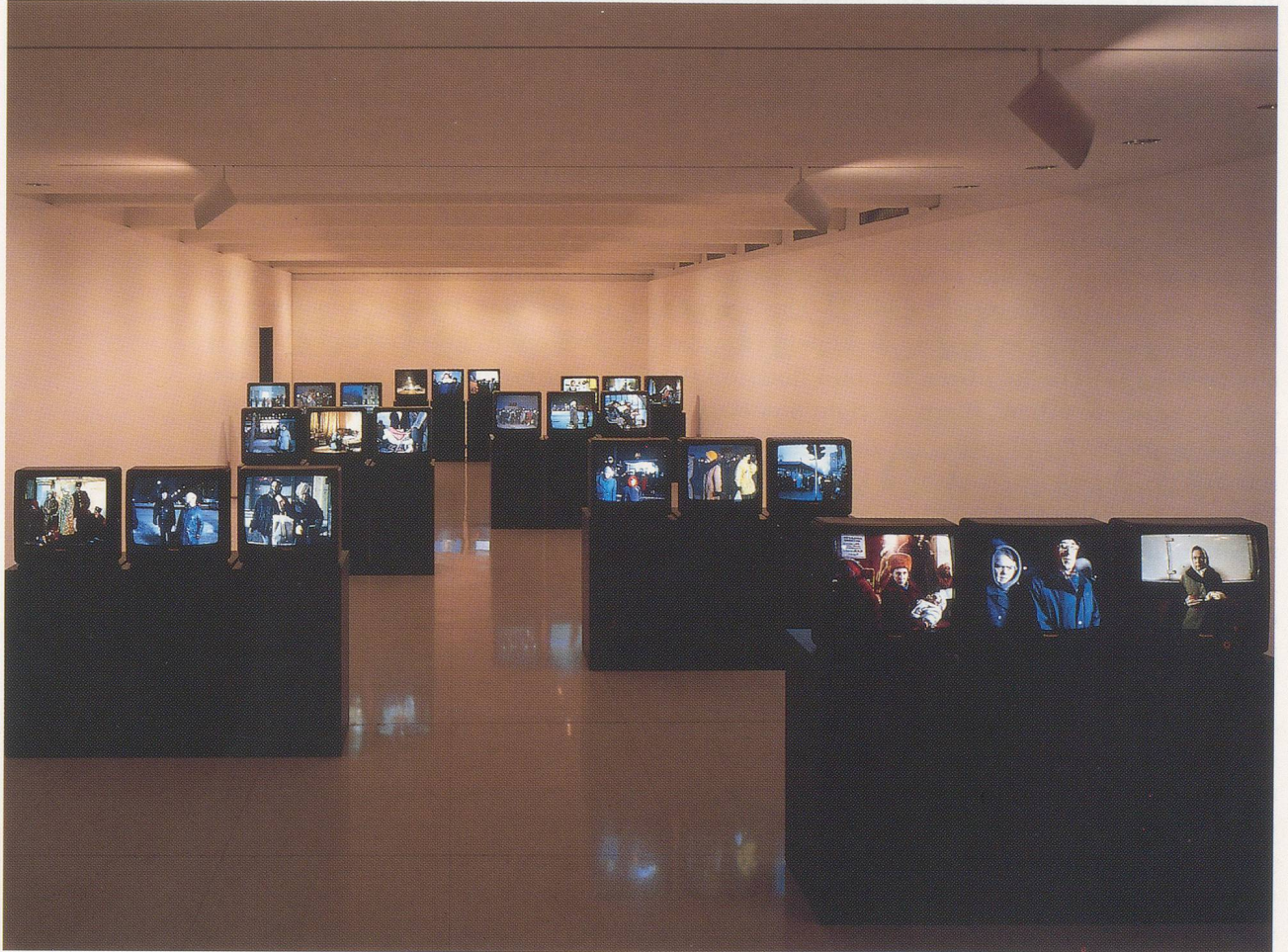
BORDERING ON FICTION: CHANTAL AKERMAN'S "D'EST," 1994, installation view / AN DER GRENZE DER FIKTION: CHANTAL AKERMANS «D'EST», Video-Installation, Walker Art Center, Minneapolis, 1995.