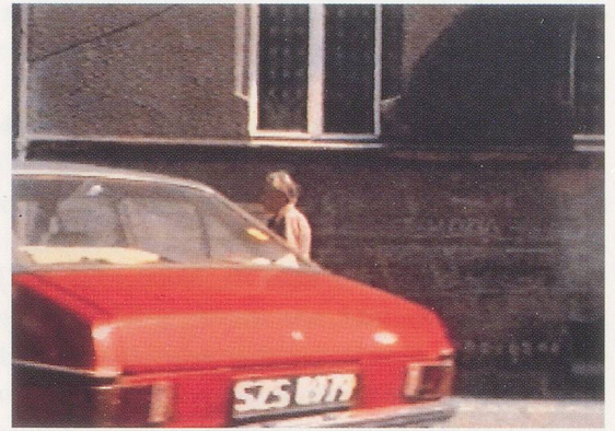
BORDERING ON FICTION: CHANTAL AKERMAN'S "D'EST," 1994, video stills /