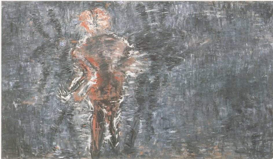
SUSAN ROTHENBERG, JUGGLER WITH SHADOWS, 1987, oil on canvas, 72 x 124¼" / SCHATTENJONGLEUR, Öl auf Leinwand, 183 x 316 cm.

nahende Ende sein – also dessen, was dem «blinden» Künstler bleibt – oder auch Ausdruck der kindlichen Hoffnung auf einen Neubeginn. Tatsächlich ist das Taktile Rothenbergs charakteristischste Begabung. Ihre Pinselführung ist wie jene Twomblys der Gestus einer Künstlerin, die, als Nachkomme der gestischen Tradition des Abstrakten Expressionismus, weiterhin eine kraftvolle Wirkung erzielt dadurch, dass sie locker, kindlich, kapriziös – ja auf eine poetische Weise unbeholfen – ist. Ihr Pinselstrich wirkt gleichsam wie auf elegante Weise «an den Nähten aufgeplatzt» und verzichtet als solcher darauf, das Bildmotiv für sich zu beanspruchen oder Inhaltliches zu vervollständigen.