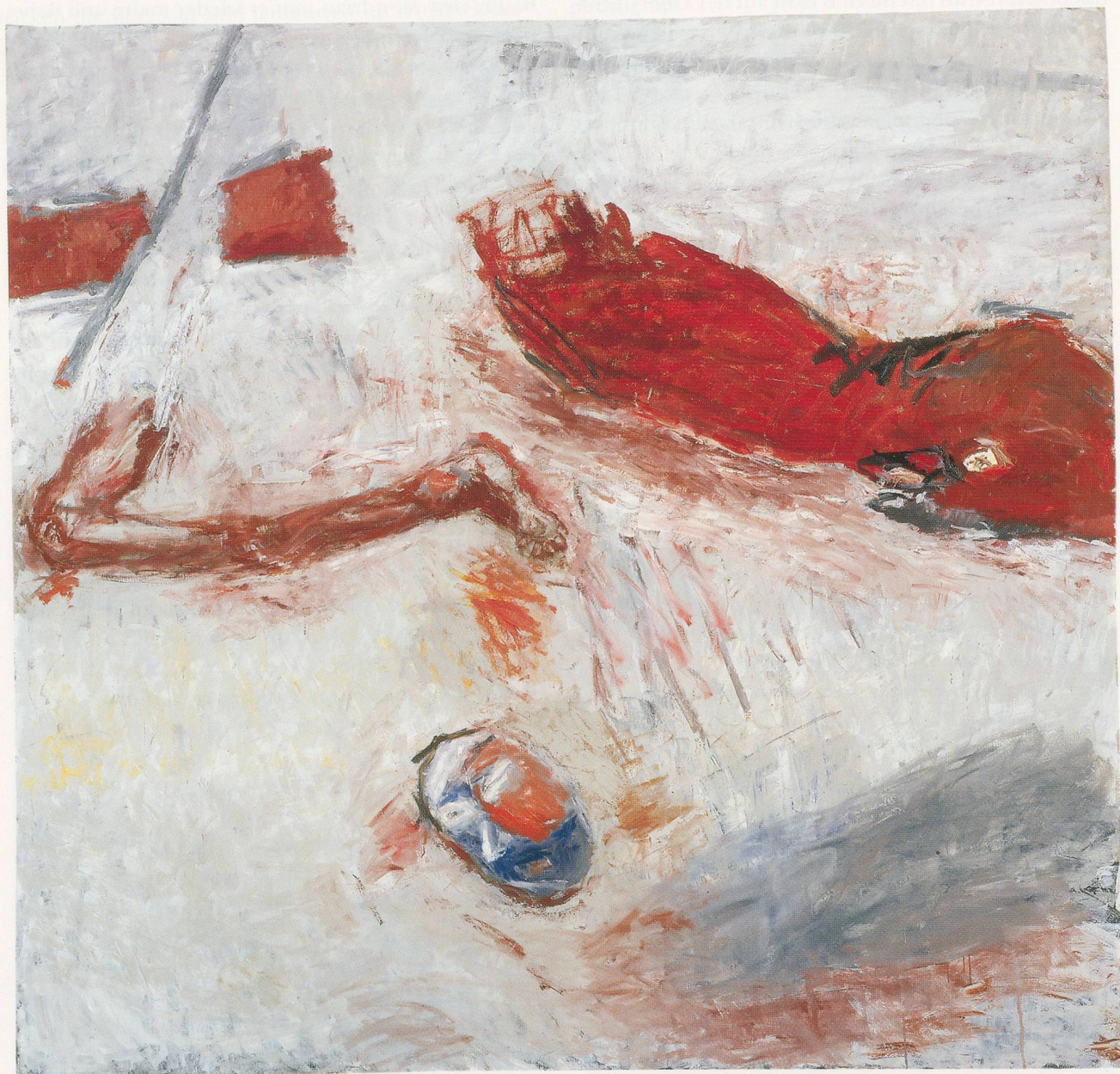
SUSAN ROTHENBERG, ACCIDENT No. 3, 1994, oil on canvas, 87 x 91" / UNFALL Nr. 3, Öl auf Leinwand, 221 x 231 cm.