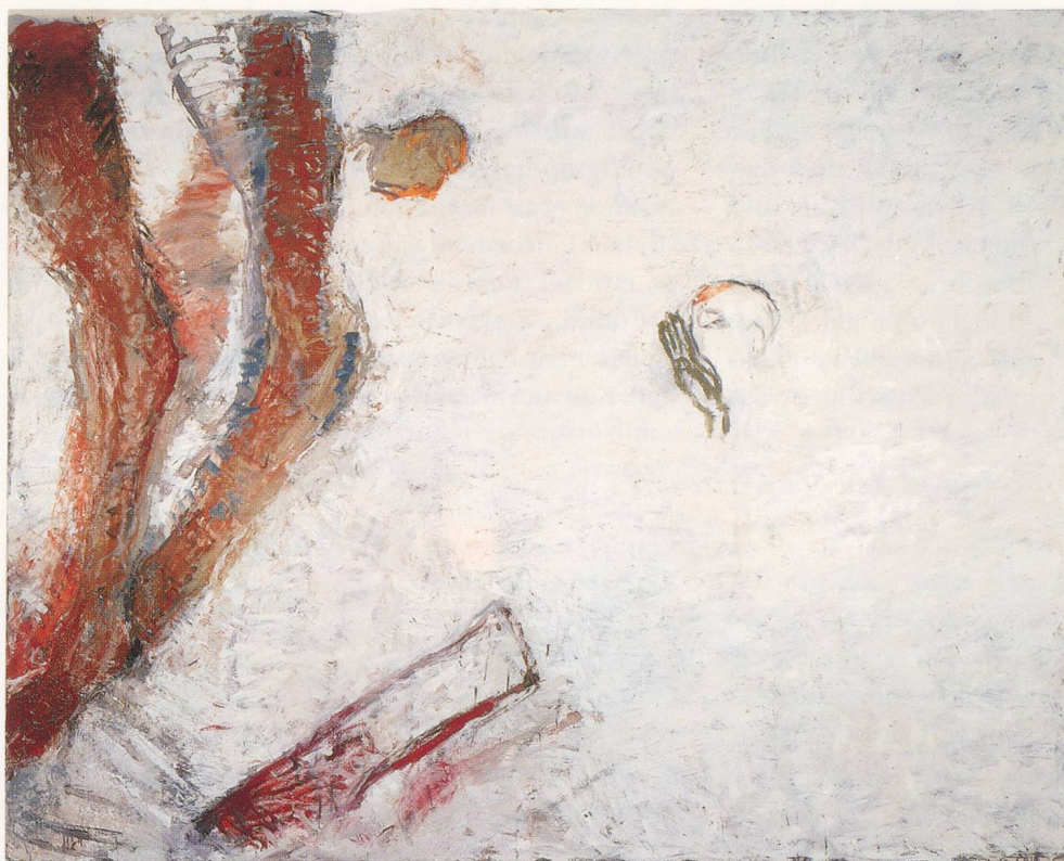
SUSAN ROTHENBERG, ACCIDENT, 1991-92, oil on canvas, 90 x 112" / UNFALL, Öl auf Leinwand, 229 x 285 cm.

mal Art – wo es von der Kritik als Ideogramm und Abstraktion, als malerisches Konstrukt und Ersatz-Ich gepriesen wurde – bis zum Neoexpressionismus, wo die Künstlerin es dann durch die menschliche Gestalt ersetzte. In ihren jüngsten Arbeiten wirft das Bild des Pferdes, diesmal als explizites und von Erfahrung geprägtes Motiv, wiederum all jene Fragen auf, die Paläontologen über die Entstehungsgeschichte ihrer Gegenstände zu stellen pflegen.