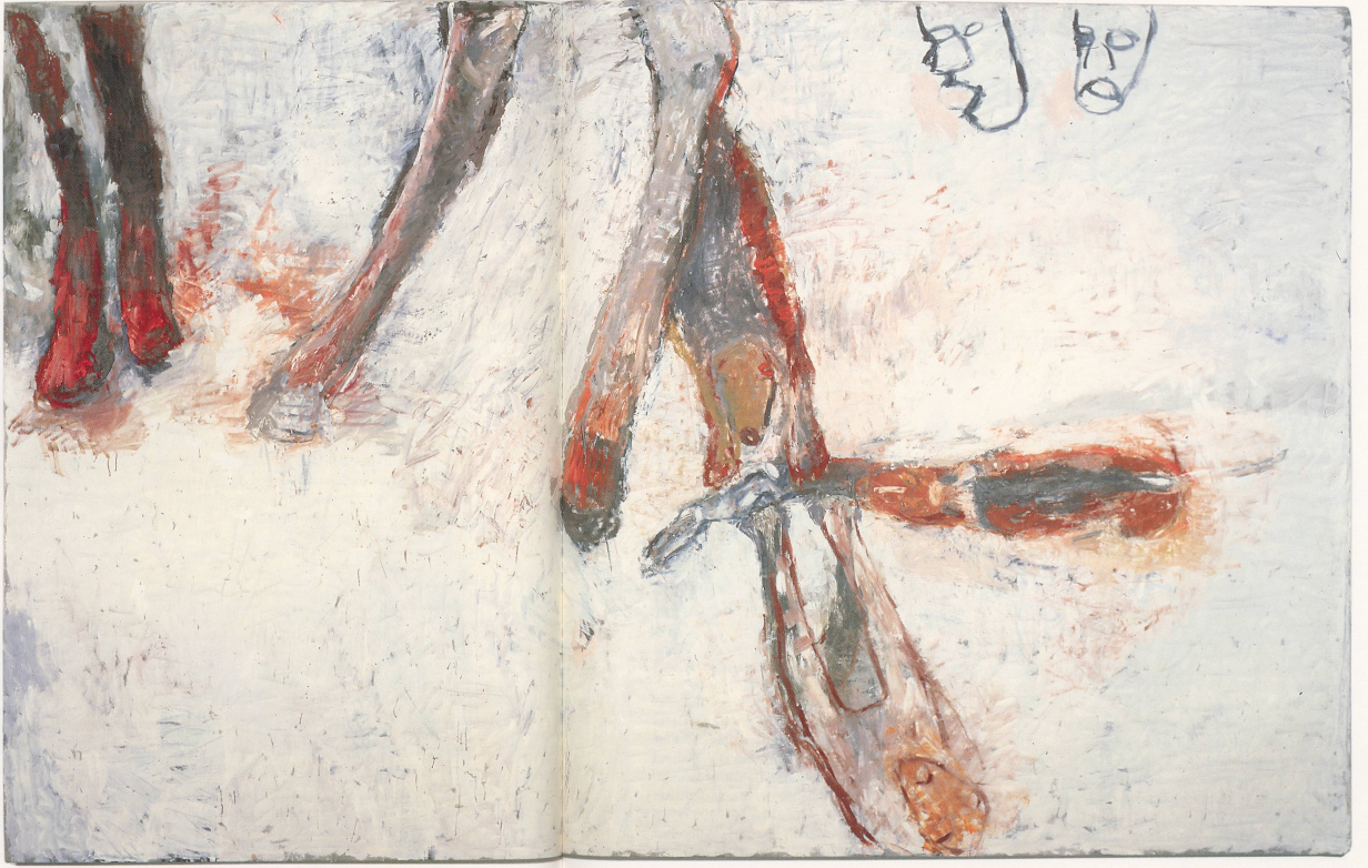
SUSAN ROTHENBERG, DOGS KILLING RABBIT, 1991-92, oil on canvas, 87 x 140 1/2" / HUNDE TÖTEN HÄSSEN. Öl auf Leinwand, 221 x 356 cm.