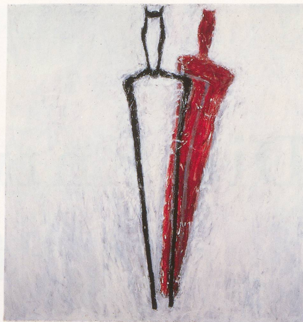
SUSAN ROTHENBERG, TUNING FORK , 1980, acrylic and flashe on canvas, 83 x 79" / STIMMGABEL, Acryl auf Leinwand, 211 x 201 cm.

Seeing has become a physical act concentrated in the figure of the horse. There's a glimpse of violence in a reddened stump on the ground during an ACCIDENT (1991–92) too painful to discern, except for the pair of bucking legs which stick the eye to the scene. Going beyond the picture plane, the connection between the painter and her practice is palpably pleasurable throughout these works, whose subjects (besides horses) include goats, dogs, bones, masks, a mother's eyes, birds, and rabbits, fulfilling the potential outlined in Rothenberg's very first horse. The eros and aggression that formerly roiled about the surface is now integrated into Rothenberg's art. Making a hot departure from an earlier palette of bruisey black, blues and reds, the color is sensual—blinking pink and yellow—as eccentric as any Ensor masquerade. The handling is a liberated hybrid of drawing