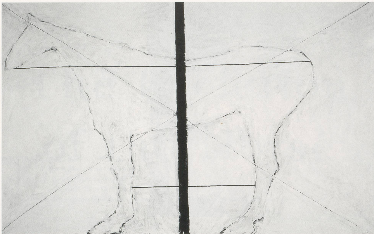
SUSAN ROTHENBERG, DOUBLE MEASURE , 1977, acrylic and tempera on canvas, 6¼ x 10" / DOPPELTES MASS , Acryl und Tempera auf Leinwand, 15,9 x 25,4 cm.

Scaled to human proportions, these paintings readily admit the figure of the artist, like mirrors in a dance studio. What shows up in this reflection is a storm of activity. Rothenberg lays her imagery down hard, often repeatedly, as if only by sheer weight will the picture pin to the surface. Nor is the painting anonymous. Working back into and around the initial drawing, Rothenberg's brush-work breaks aggressively across and penetrates deep into the surface. The distinct physiognomy of her painting brings up short the extent to which these works, even equipped with self-imposed restraints and rationales, might seem to conform to an anti-pictorial doctrine. Making the horse her double, Rothenberg moved bodily against the systemic strictures of minimalist painting.