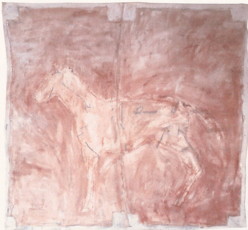
SUSAN ROTHENBERG, FIRST HORSE , 1974, tempera, matte, flashe, pencil, and gesso on unstretched canvas, 26 x 28" / ERSTES PFERD, Tempera und Mischtechnik auf Leinwand, 66 x 71 cm.

passage when the cape is swung slowly away from the charging animal, while the matador keeps his feet firmly in the same position. Painting the oldest icon in the art history book, Rothenberg, like the man in the ring waving a sign of provocation, planted herself against the forward-rush of an avant-garde adverse to figuration. In the context of a minimalist discourse based on monuments (things which don't move) and objectivity (not even enough to flag down a passing reference), horses not only look conspicuously pictorial, but also extremely kinetic. Rothenberg's choice in representing them appears as a bid for her own freedom to paint as she pleases, but not, it seems, without a certain level of denial. 3)