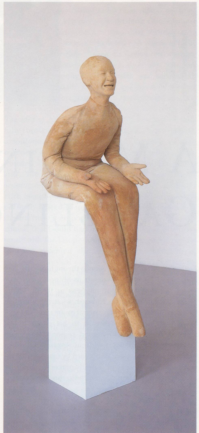
JUAN MUÑOZ, LAUGHING FIGURE, 1994, terracotta, 14 x 14 x 39" / LACHENDE FIGUR, Terracotta, 35 x 35 x 100 cm.

(Übersetzung: Magda Moses, Bram Opstelten)