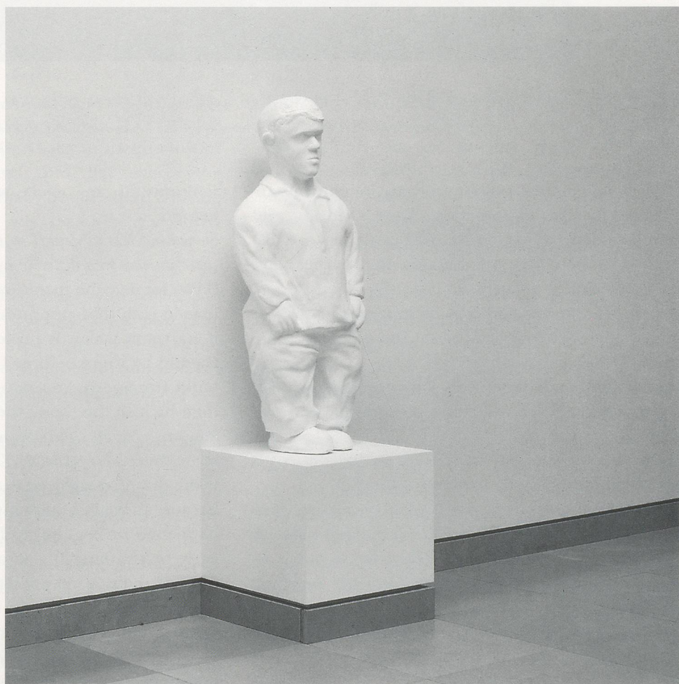
JUAN MUÑOZ, DWARF, 1994, papier-mâché, paint, wood, 42½ x 35 x 17½" / ZWERG, Pappmaché, Farbe, Holz, 108 x 88 x 44 cm, Musée de Nîmes.

Yes, but a very flat one. With one figure, nothing