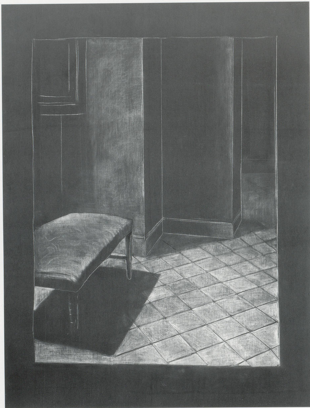
JUAN MUÑOZ, RAINCOAT DRAWING IV, 1989, chalk and oil on canvas, 79 x 59" / REGENMANTEL-ZEICHNUNG IV, Kreide und Öl auf Leinwand, 200 x 150 cm.