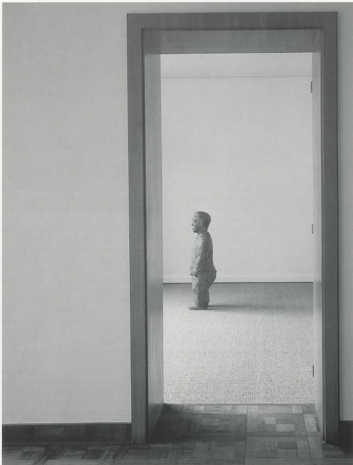
JUAN MUÑOZ, DWARF, 1991, bronze, 33½ x 17⅞" / ZWERC, Bronze, 85 x 44 cm.