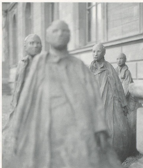
JUAN MUÑOZ, CONVERSATION PIECE, 1992 / KONVERSATIONSSTÜCK, Documenta 9, Kassel.

Der Betrachter wird also ebenso zum Gegenstand des Werkes wie der Zwerg, der betrachtet wird?