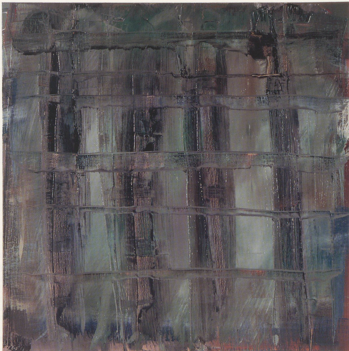
GERHARD RICHTER, ABSTRAKTES BILD (755-4), 1992, Öl auf Leinwand, 61 x 61 cm / ABSTRACT PAINTING (755-4), 1992, oil on canvas, 24 x 24".