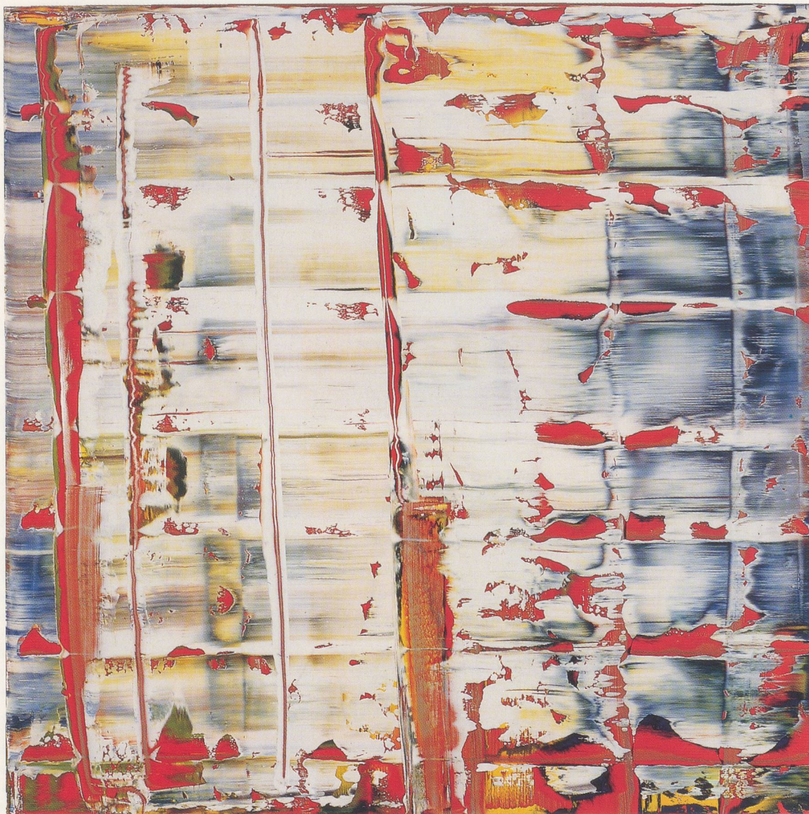
GERHARD RICHTER, ABSTRAKTES BILD (778-4), 1992, Öl auf Leinwand, 100 x 100 cm / ABSTRACT PAINTING (778-4), 1992, oil on canvas, 39 \frac{7}{8} x 39 \frac{7}{8} ".