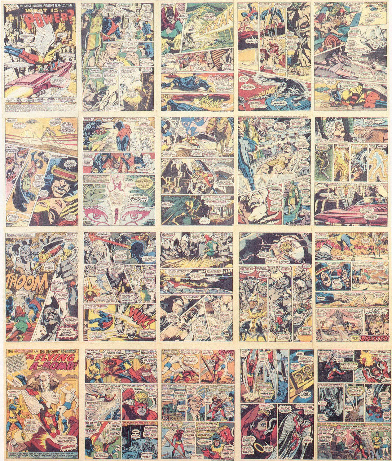
TIM ROLLINS + K.O.S., X-MEN # 56 - WHAT IS... THE POWER? 1969-80, COMIC BOOK PAGES ON LINEN/ COMIC-STRIP-SEITEN AUF LEINWAND, 38 x 32 "/>96,5 x 81,3 cm. THE X-MEN: TM & © 1989, MARVEL ENTERTAINMENT GROUP, INC. ALL RIGHTS RESERVED.