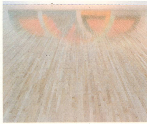
LOUISE LAWLER, GREEN / GRÜN , 1986, CIBACHROME , 31 \frac{1}{2} x 47" / 80 x 120 cm.