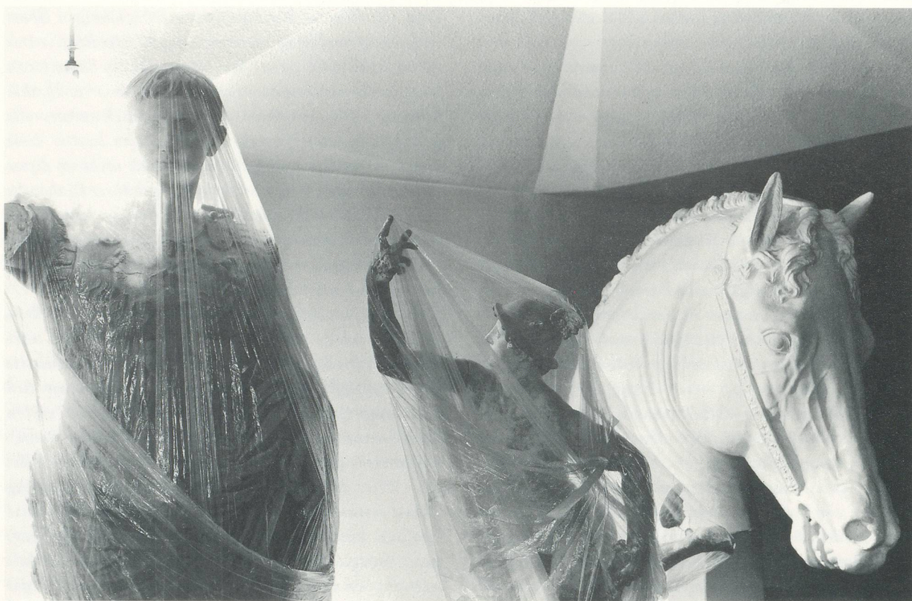
LOUISE LAWLER, THREE / DREI, 1984, BLACK AND WHITE PHOTOGRAPH / SCHWARZ-WEISS PHOTO.

rückprojiziert. Ihre Werke sind nicht in erster Linie unerbittlich ikonoklastisch, sondern eher beissend belletristisch, und es fehlt ihnen jene Adrettheit völlig, an der so viele Arbeiten ihrer dekonstruktivistischer Kollegen krankten. Letztendlich porträtieren Lawlers Bilder eine Komödie zeitgenössischer Verhaltensweisen – es ist die Arbeit einer Ästhetin wider Willen. Wer anders als jemand mit scharfen Augen und klarem Verstand hätte sonst einen archetypischen Stella in einem Museum in