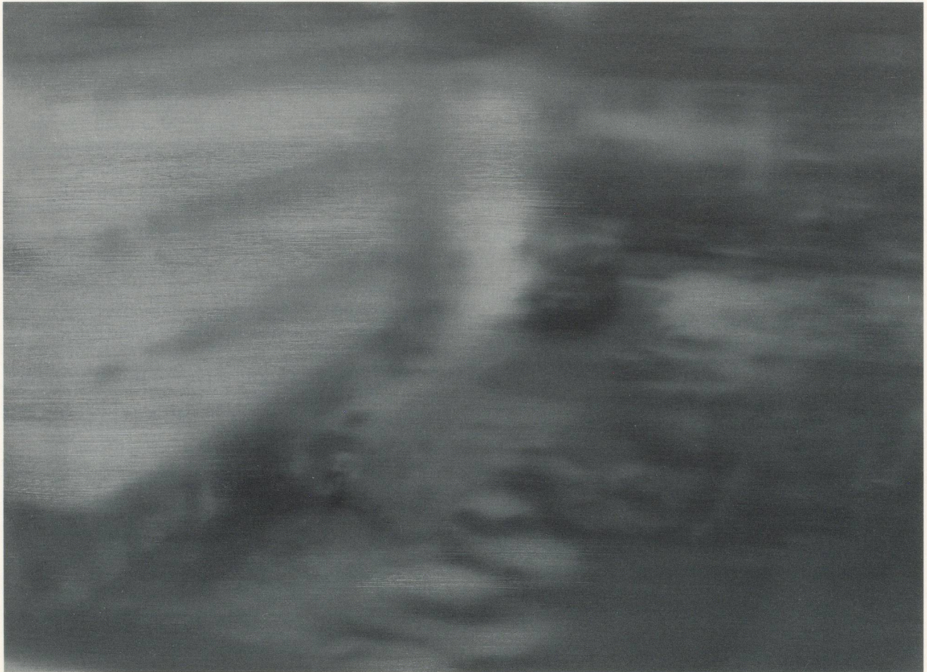
GERHARD RICHTER, FESTNAHME I / ARREST I , 1988, ÖL AUF LEINWAND / OIL ON CANVAS , 92 x 126 cm / 36 1 / 5 x 49 3 / 5 ".