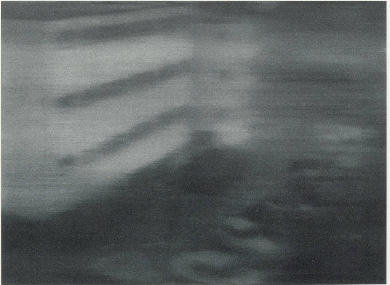
GERHARD RICHTER, FESTNAHME II / ARREST II , 1988 ÖL AUF LEINWAND / OIL ON CANVAS , 92 x 126 cm / 36 1 / 5 x 49 3 / 5 "