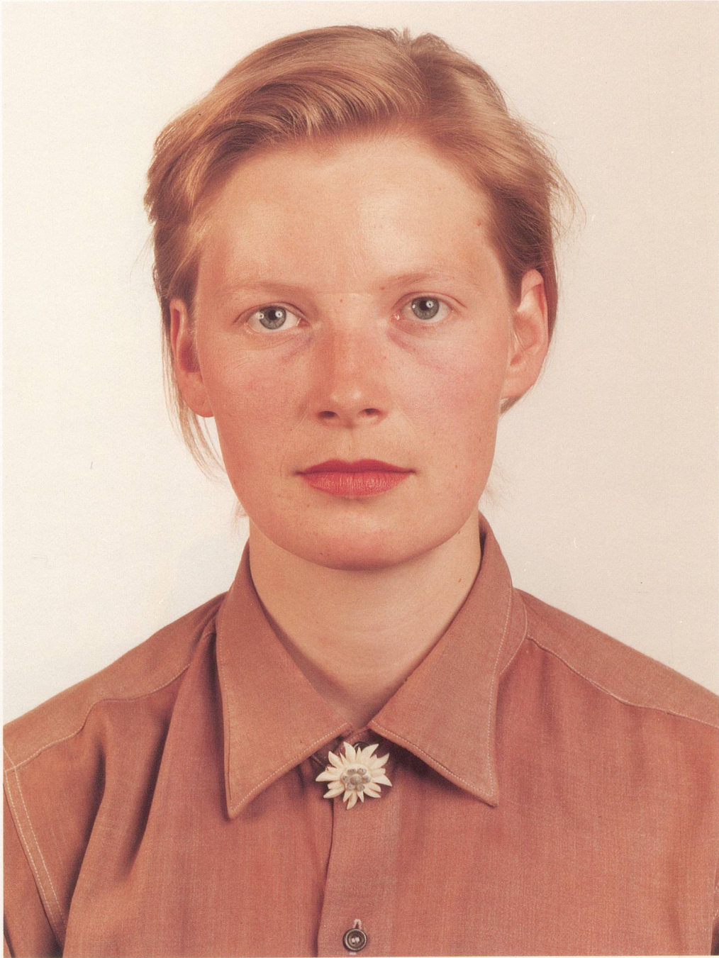
THOMAS RUFF, PORTRÄT, 1988, 210 x 165 cm / 82 3 / 5 x 65 "