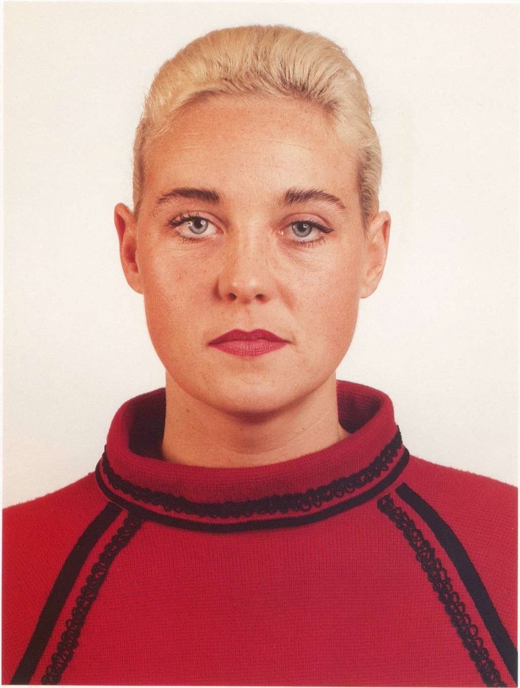
THOMAS RUFF, PORTRÄT, 1988, 210 x 165 cm / 82 3 / 5 x 65".