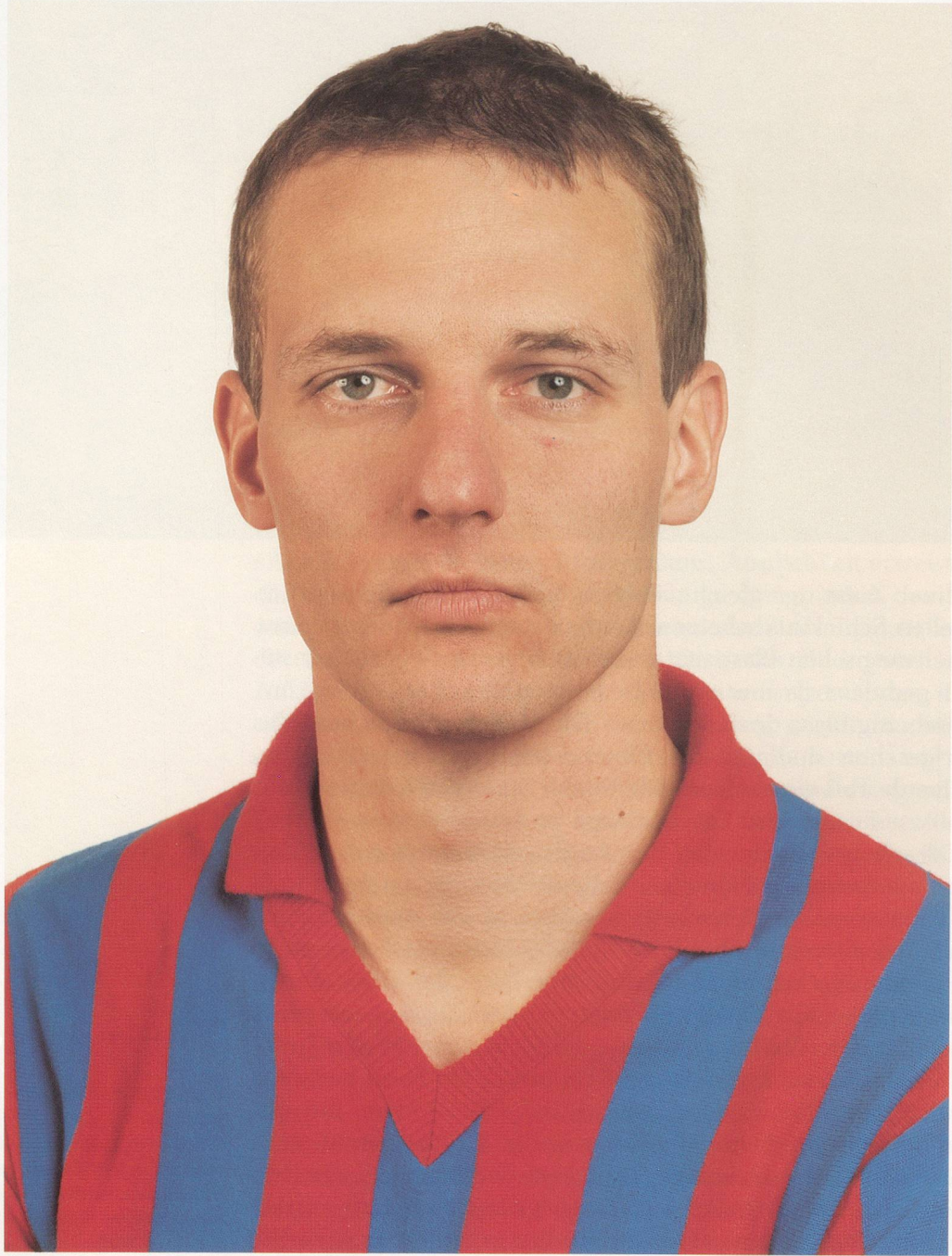
THOMAS RUFF, PORTRÄT, 1988, 210 x 165 cm / 82 3 / 5 x 65".