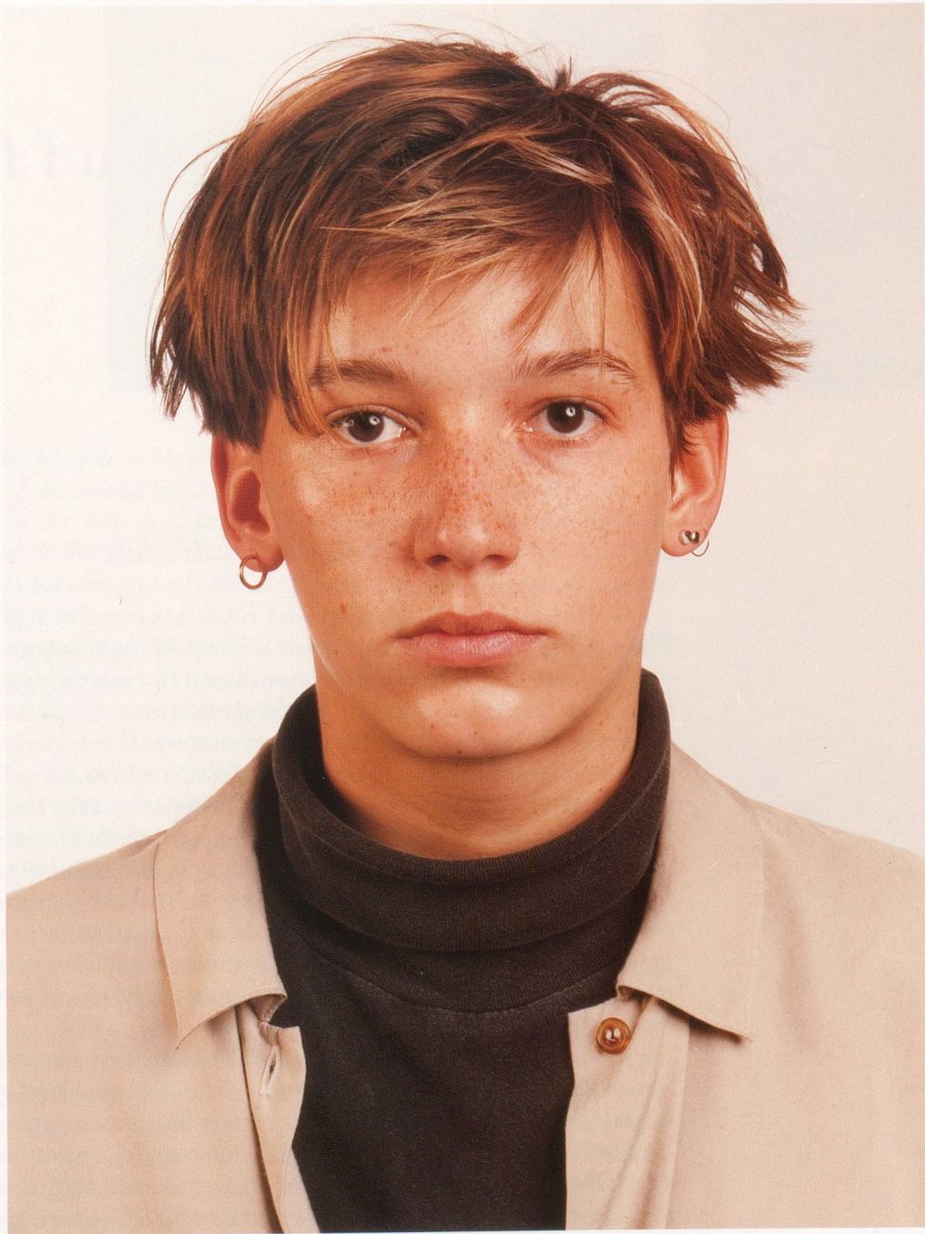
THOMAS RUFF, PORTRÄT, 1988, 210 x 165 cm / 82 3 / 5 x 65 "