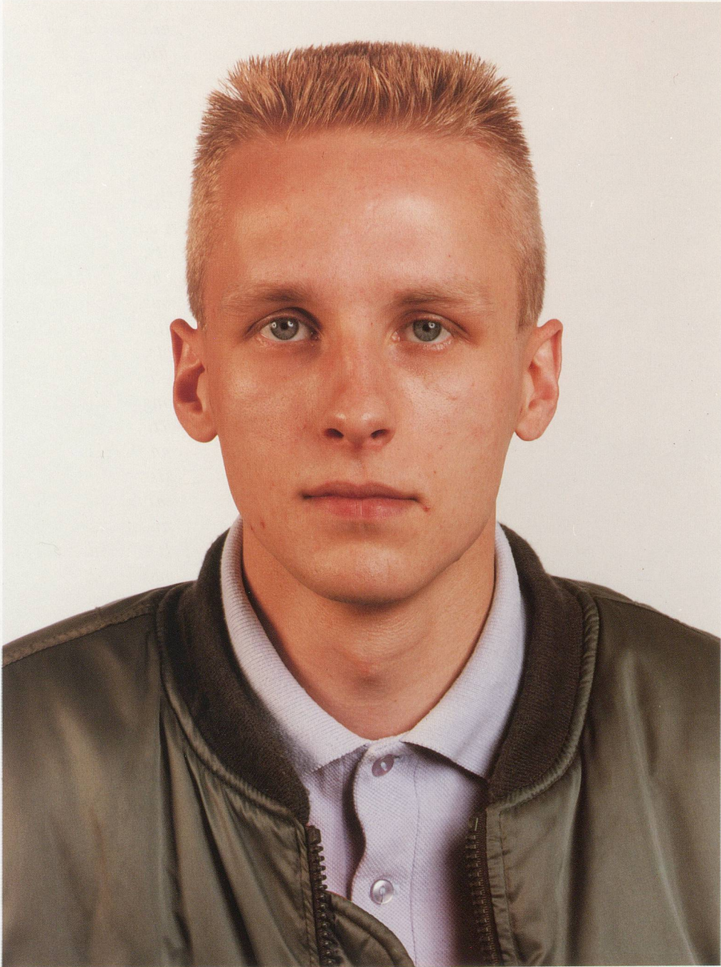
THOMAS RUFF, PORTRÄT, 1988, 210 x 165 cm / 82 3 / 5 x 65".