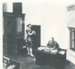
EDWARD HOPPER, OFFICE AT NIGHT , 1940.