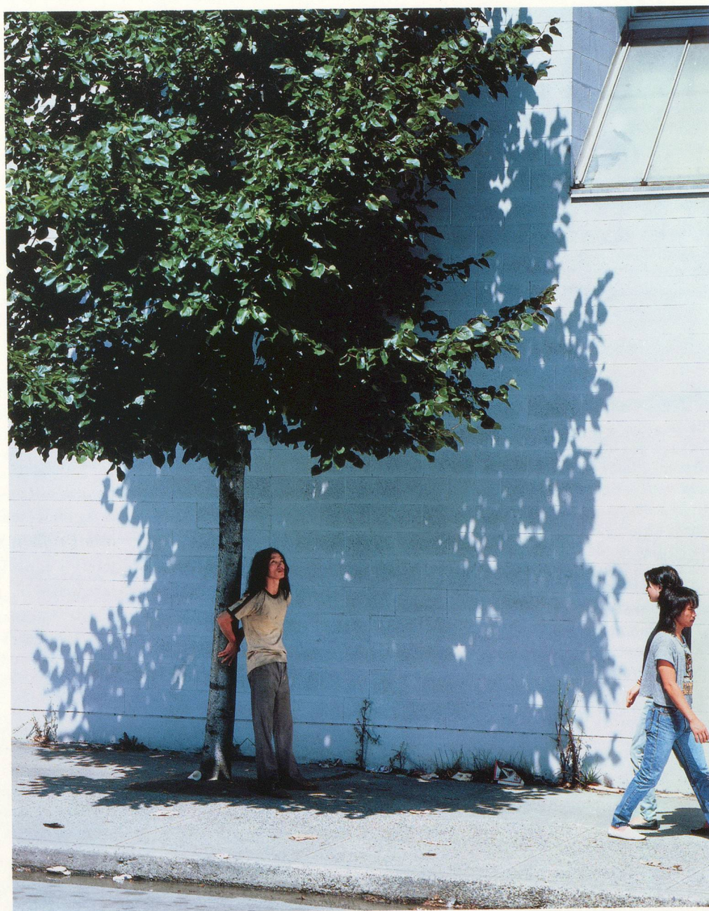
JEFF WALL, TRAN DUC VAN, 1988, CIBACHROME TRANSPARENCY, FLUORESCENT LIGHT, DISPLAY CASE / CIBACHROME-DIAPOSITIV, FLUORESZENZLICHT IN KASTEN, 114 x 90" / 290 x 229 cm.