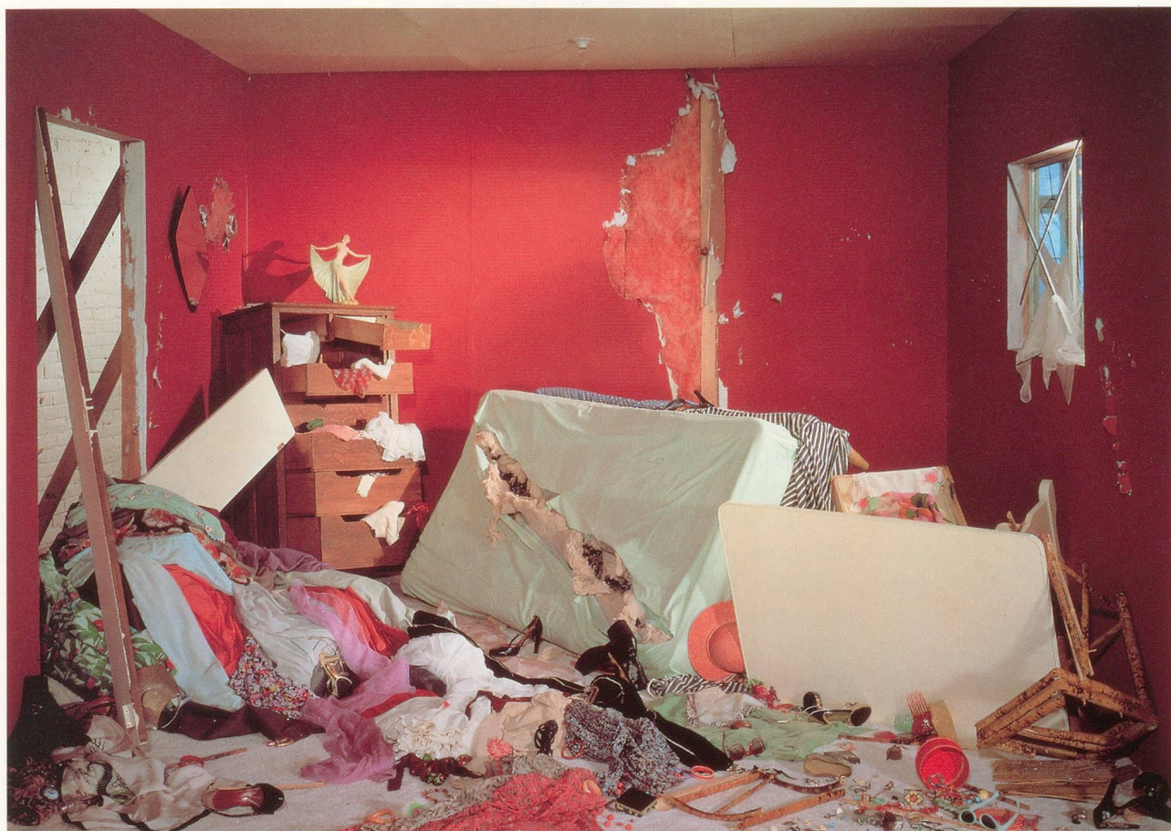
JEFF WALL, THE DESTROYED ROOM / DAS ZERSTÖRTE ZIMMER , 1978, CIBACHROME TRANSPARENCY, FLUORESCENT LIGHT, DISPLAY CASE / CIBACHROME-DIAPOSITIV, FLUORESZENZLICHT IN KASTEN, 63 x 92" / 159 x 234 cm. (NATIONAL GALLERY OF CANADA, OTTAWA)