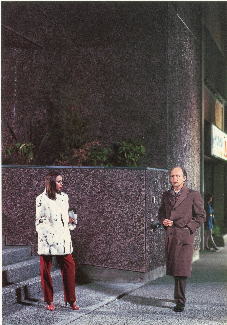
JEFF WALL, NO / NEIN, 1983, CIBACHROME TRANSPARENCY, FLUORESCENT LIGHT, DISPLAY CASE / CIBACHROME-DIAPOSITIV, FLUORESZENZLICHT IN KASTEN, 130 x 90" / 330 x 229 cm.