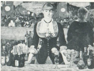
EDOUARD MANET, UN BAR AUX FOLIES-BERGÈRES, 1882.

3) Walter Benjamin: «Paris, die Hauptstadt des 19. Jahrhunderts», ILLUMINATIONEN, Suhrkamp Verlag, Frankfurt a. M. 1969, S. 193.