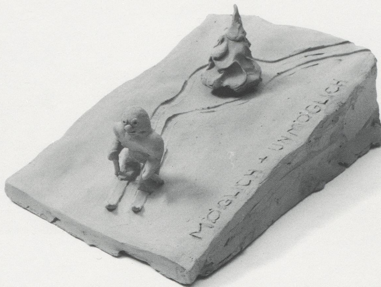
PETER FISCHLI/DAVID WEISS, BELIEBTE GEGENSÄTZE: MÖGLICH UNMÖGLICH / POPULAR OPPOSITES: POSSIBLE AND IMPOSSIBLE, UNGEBRANNTER TON / UNFIRED CLAY, 1981, AUS / FROM: PLÖTZLICH DIESE ÜBERSICHT / SUDDENLY THIS OVERVIEW.