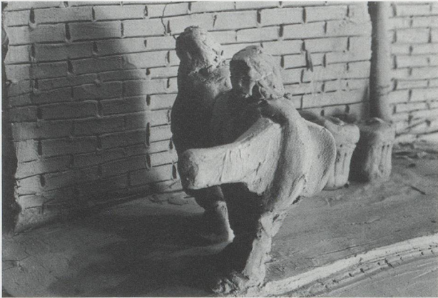
PETER FISCHLI/DAVID WEISS,

MICK JAGGER UND BRIAN JONES BEFRIEDIGT AUF DEM HEIMWEG, NACHDEM SIE I CAN'T GET NO SATISFACTION KOMPONIERT HABEN / MICK JAGGER AND BRIAN JONES GOING HOME SATISFIED AFTER COMPOSING I CAN'T GET NO SATISFACTION.