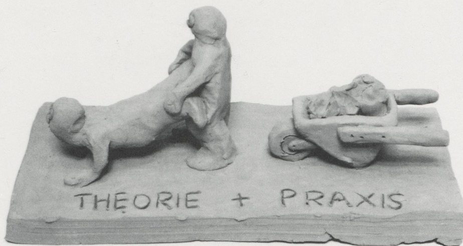
PETER FISCHLI/DAVID WEISS, THEORIE UND PRAXIS / THEORY AND PRACTICE, 1981.