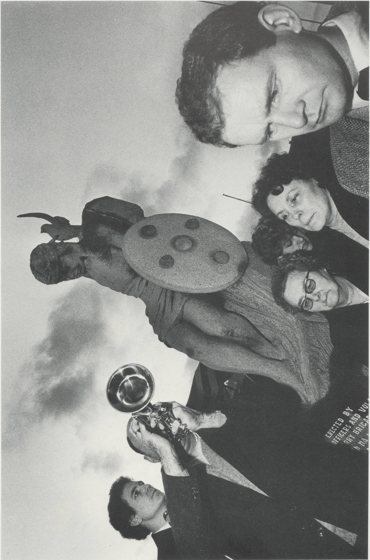
ERECTED BY OFFICERS AND VOL UNIVERSITY BRIGADE IN 1941