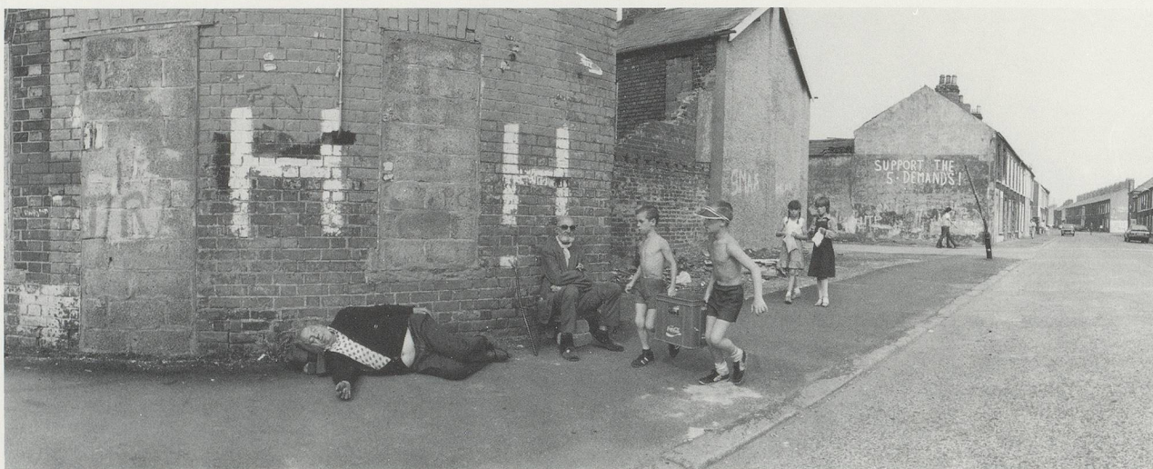
SHORT STRAND, SUMMER / SOMMER, BELFAST 1984

Wo andere sie nur zitieren können, hat Peress in Paris bei Michel Foucault und Edouard Balibar wirklich studiert, fünfzehn Jahre, bevor diese Theoretiker zu Halbgöttern der Kunstdiskussion wurden. Und indem er von solchen Lehrern lernte, wurde in ihm die Überzeugung geweckt, dass Wörter und Begriffe sich tatsächlich zunehmend von jedem Bezug zur Wirklichkeit lösten. Doch war dies ein kulturelles