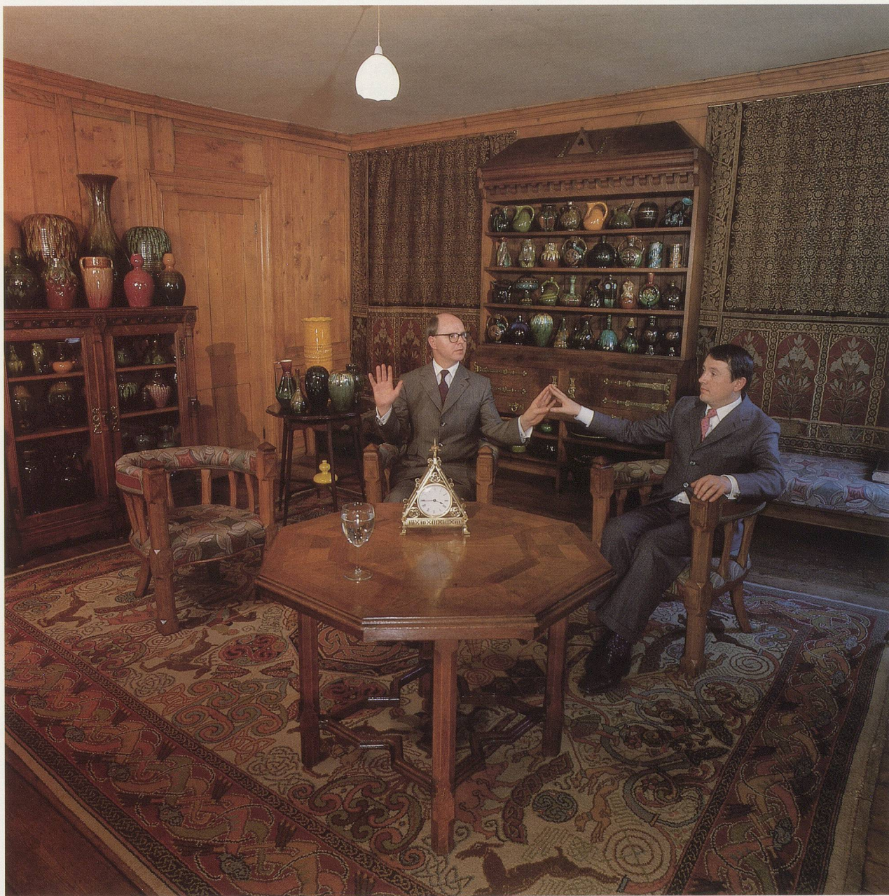
PORTRAIT OF GILBERT & GEORGE FOR THE OBSERVER MAGAZINE, 1984.