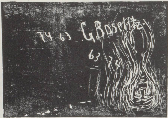
GEORG BASELITZ, HOLZSCHNITT FÜR DEN UMSCHLAG DER LUXUSAUSGABE DES / WOODCUT FOR THE COVER OF THE DELUXE EDITION OF: WERKVERZEICHNIS DER DRUCKGRAPHIK 1963-1974, BERN-BERLIN 1983. (GENÈVE, CABINET DES ESTAMPES)

Das Thema der Träne erscheint bei Baselitz im Anschluss an die PASTORALEN von 1985-1986, in denen er nicht nur Erinnerungen an seine Kindheit in Sachsen, sondern auch Produktionen aus den sechziger Jahren neu verarbeitet. Er hat in seiner neueren Malerei meines Wissens mindestens dreimal auf das Tränenmotiv zurückgegriffen. 13 In TRÄNEN erzeugt die Formulierung der Tropfen ein