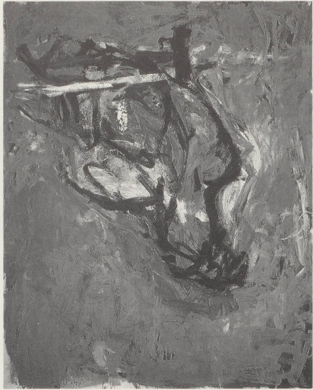
GEORG BASELITZ, AKT UND ADLER / NUDE AND EAGLE, 1978, ÖL AUF LEINWAND / OIL ON CANVAS, 2-TEILIG / IN 2 PARTS, JE 250 x 200 CM / 8'2 \frac{1}{2} " x 6'6 \frac{1}{4} " EACH. (ZÜRICH, SAMMLUNG MGB / FMC COLLECTION)