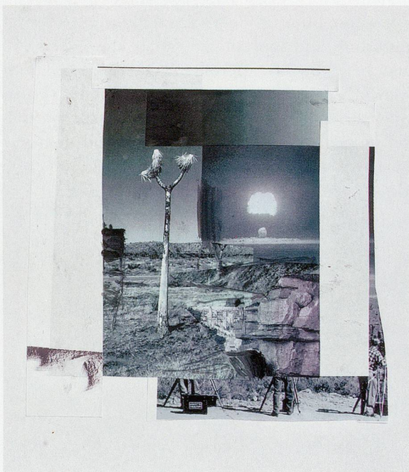
ADRIAN GHENIE, study for THE STIGMATA , 2010, collage and acrylic on paper, 27 1/2 x 20 3/4" / Studie für DIE STIGMATA , Collage und Acryl auf Papier, 70 x 52,7 cm.

The collective image-rapture induced by the lethal combustion of atomic energy that held the gaze of journalists and brought thousands of atomic tourists to Las Vegas, the unleashing of a crazed, noxious excess of photo-sensitivity in which these documentarians and witnesses operate, are captured, shaped, and measured in the plastic flesh of the dummy, made to see something we cannot. A cog in an abstract ma-