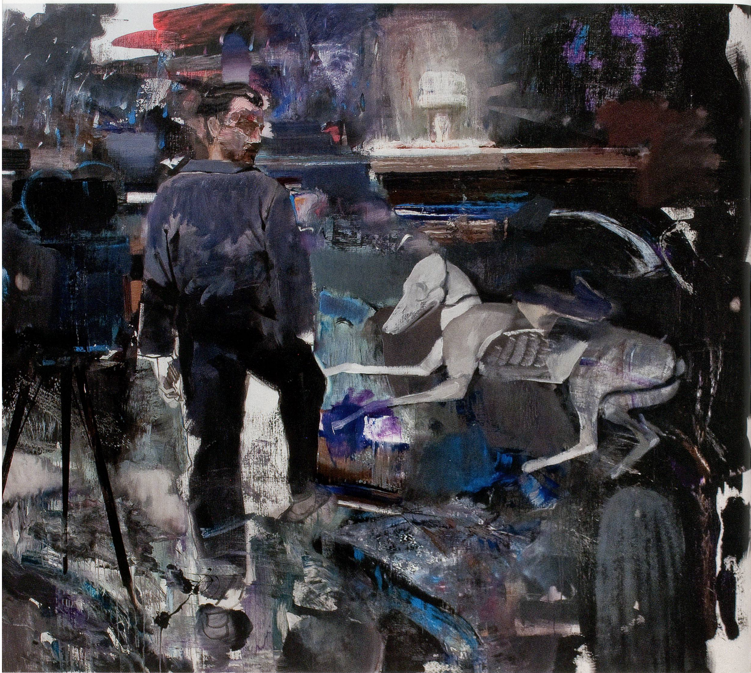
ADRIAN GHENIE, THE DEVIL 2 , 2010, oil on canvas, 78 \frac{3}{4} x 90 \frac{1}{2} " / DER TEUFEL 2 , Öl auf Leinwand, 200 x 230 cm.