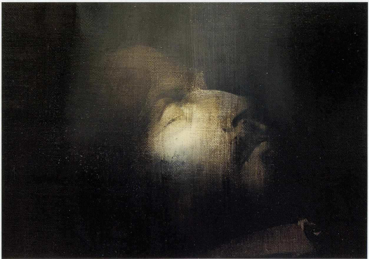
ADRIAN GHENIE, THE LEADER , 2008, oil and acrylic on canvas, 8 5/8 x 12" /

assemblage of joints and limbs into a visual equivalent for a polity. Decades of replacing dead tissue have altered the body’s original composition to the extent that it now inhabits a spectral terrain between carion and representation; a cyborg-icon whose heart and brain are extended through political and medical protocols. A member of the preservation team employs the phrase “living sculpture” to convey this paradox, “as if to say this is a sculpture of the body that is constructed of the body itself. ” 2) For his body to appear unaffected by the passage of time, it must constantly change. Evidencing a different paradigm from Ernst Kantorowicz’s classic distinction between, and blur-