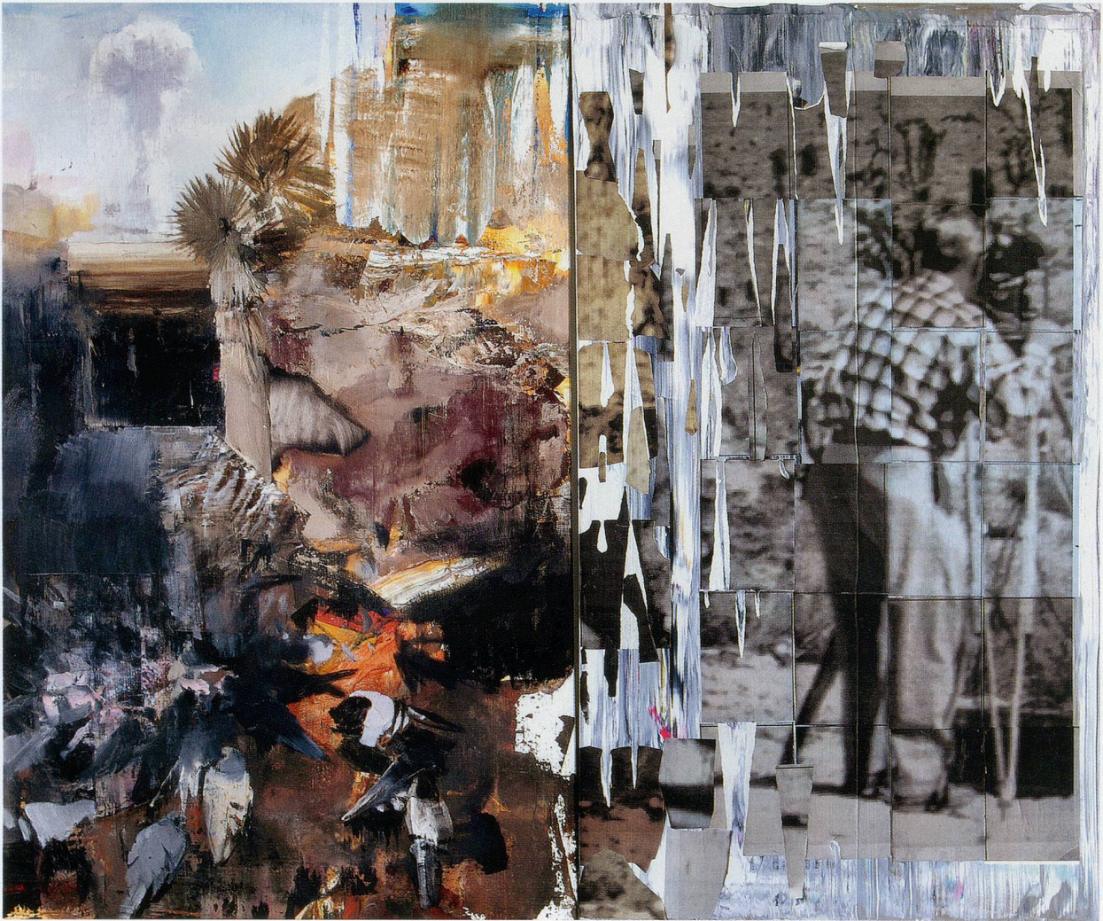
ADRIAN GHENIE, STIGMATA 2 , 2010, oil, acrylic and collage on canvas, 78 3 / 4 x 94 1 / 2 " / Öl, Acryl und Collage auf Leinwand, 200 x 240 cm.