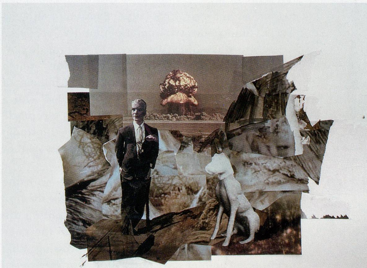
ADRIAN GHENIE, study for THE DEVIL 3 , 2010, collage and acrylic on paper, 12 3 / 4 x 18 7 / 8 " / Studie für DER TEUFEL 3 , Collage und Acryl auf Papier, 32,7 x 48 cm.

The relationship between inanimate and living forms takes a different trajectory in THE DEVIL (2008). Ghenie borrows his lopsided protagonist from a black-and-white image by Life magazine photographer Loomis Dean, one of numerous American photojournalists invited to document the aftermath of nuclear experiments at the Nevada Test Site. An entire town was built at Yucca Flat and peopled with hundreds of store mannequins to study the effects of a blast on everything from houses to clothes to canned food. The News Nob, a strategic spot positioned seven miles from the test site itself, was established in 1952 as a designated area for journalists to witness the detonations. In tandem with aerial photography of craterous depressions or clouds dissolving into their own brightness, photojournalistic routine at the News Nob established an iconography of sorts: the categories into which an indirect gaze onto the blast would fall, the postures and positions, protocols, instruments, and crepuscular photogenics by which an event whose intensity defies capabilities of technical registration and mortally threatens the naked eye could be obliquely apprehended, segmented into points of view, and seemingly domesticated. Dean's own experience leads to an insistent focus on portraiture, on the make-believe of familial and domestic devastation played out by the mannequins. Take the