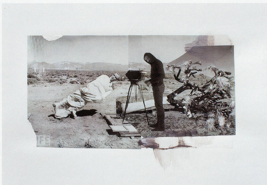
ADRIAN GHENIE, study for THE BLOW , 2010, collage and acrylic on paper, 13 x 19" / Studie zu DER SCHLAG, Collage und Acryl auf Papier, 32,8 x 48,2 cm.