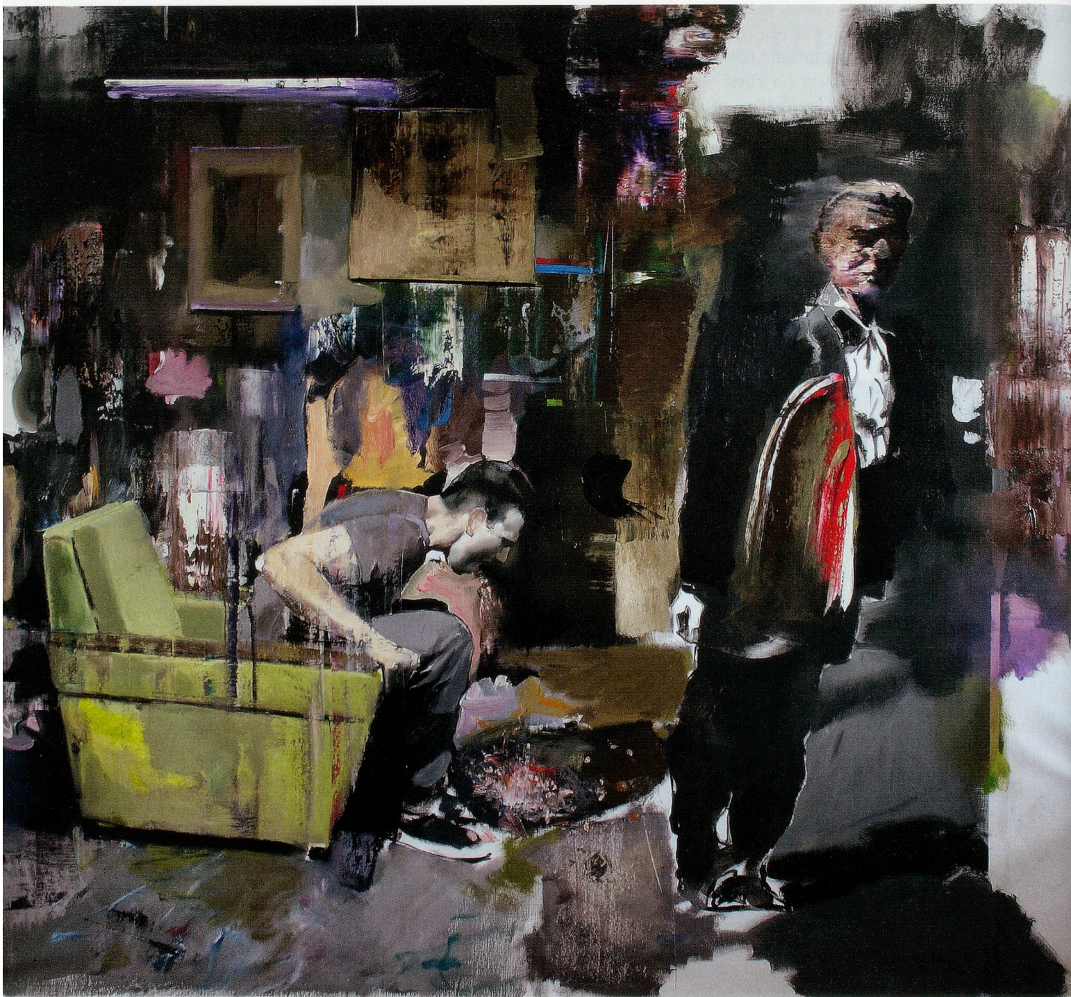
ADRIAN GHENIE, THE DEVIL 1 , 2010, oil on canvas, 80 3 / 4 x 90 1 / 2 " / DER TEUFEL 1 , Öl auf Leinwand, 205 x 230 cm.