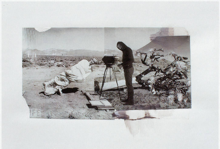
ADRIAN GHENIE, study for THE BLOW , 2010, collage and acrylic on paper , 13 x 19" / Studie zu DER SCHLAG , Collage und Acryl auf Papier , 32,8 x 48,2 cm.