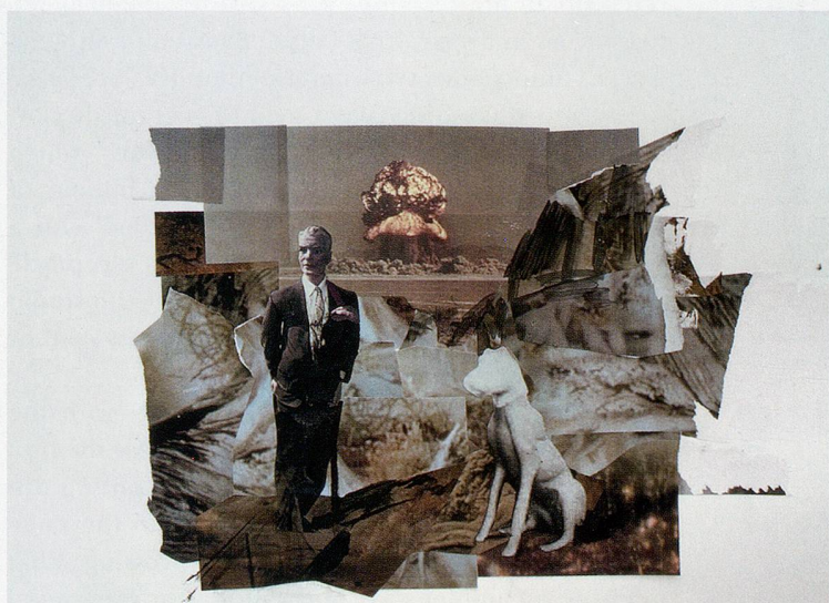
ADRIAN GHENIE, study for THE DEVIL 3, 2010, collage and acrylic on paper, 12 3/4 x 18 7/8" / Studie für DER TEUFEL 3, Collage und Acryl auf Papier, 32,7 x 48 cm.

The relationship between inanimate and living forms takes a different trajectory in THE DEVIL (2008). Ghenie borrows his lopsided protagonist from a black-and-white image by Life magazine photographer Loomis Dean, one of numerous American photojournalists invited to document the aftermath of nuclear experiments at the Nevada Test Site. An entire town was built at Yucca Flat and peopled with hundreds of store mannequins to study the effects of a blast on everything from houses to clothes to canned food. The News Nob, a strategic spot positioned seven miles from the test site itself, was established in 1952 as a designated area for journalists to witness the detonations. In tandem with aerial photography of craterous depressions or clouds dissolving into their own brightness, photojournalistic routine at the News Nob established an iconography of sorts: the categories into which an indirect gaze onto the blast would fall, the postures and positions, protocols, instruments, and crepuscular photogenics by which an event whose intensity defies capabilities of technical registration and mortally threatens the naked eye could be obliquely apprehended, segmented into points of view, and seemingly domesticated. Dean's own experience leads to an insistent focus on portraiture, on the make-believe of familial and domestic devastation played out by the mannequins. Take the