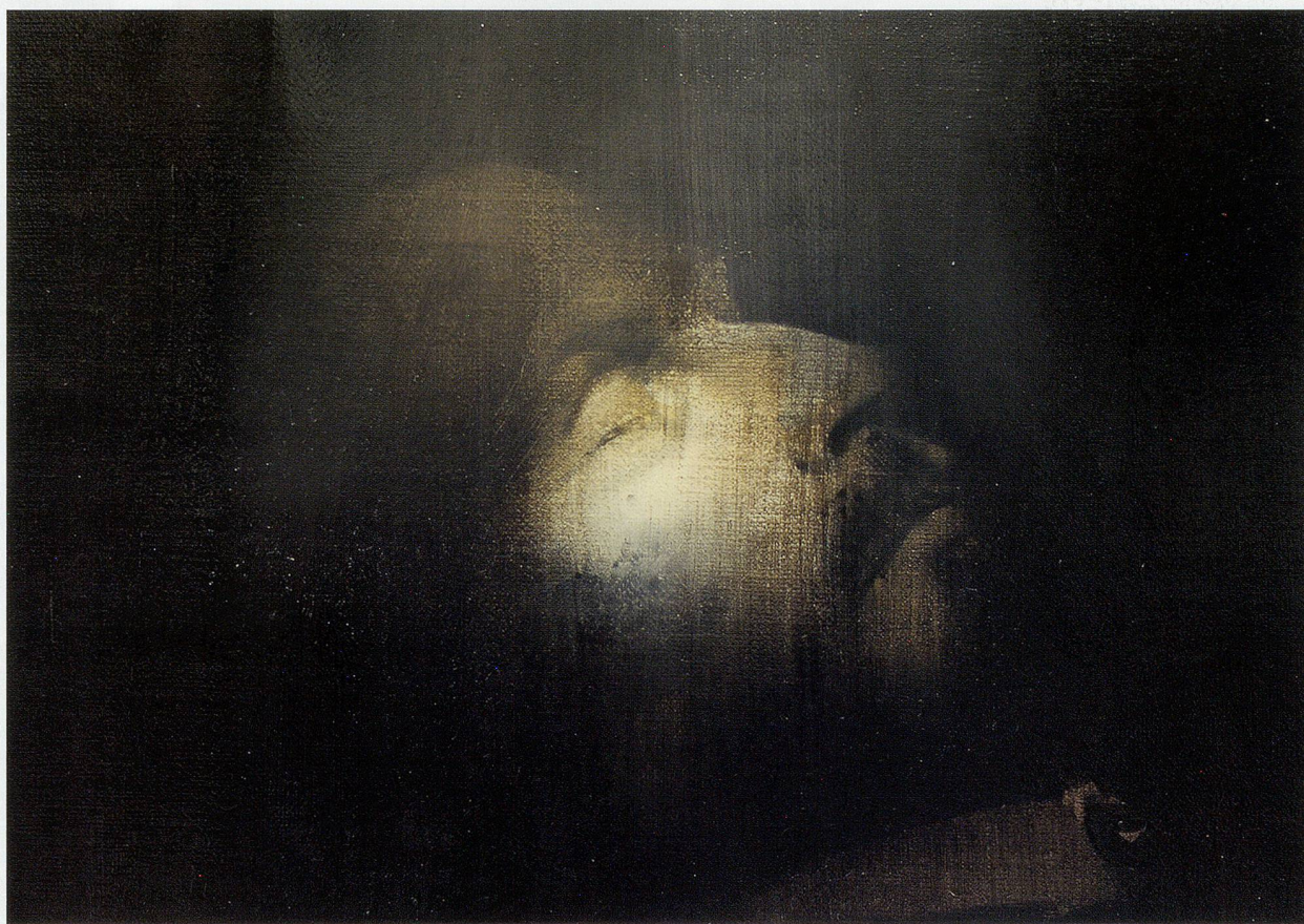
ADRIAN GHENIE, THE LEADER , 2008, oil and acrylic on canvas, 8 5/8 x 12" /

assemblage of joints and limbs into a visual equivalent for a polity. Decades of replacing dead tissue have altered the body’s original composition to the extent that it now inhabits a spectral terrain between carion and representation; a cyborg-icon whose heart and brain are extended through political and medical protocols. A member of the preservation team employs the phrase “living sculpture” to convey this paradox, “as if to say this is a sculpture of the body that is constructed of the body itself .” 2) For his body to appear unaffected by the passage of time, it must constantly change. Evidencing a different paradigm from Ernst Kantorowicz’s classic distinction between, and blur-