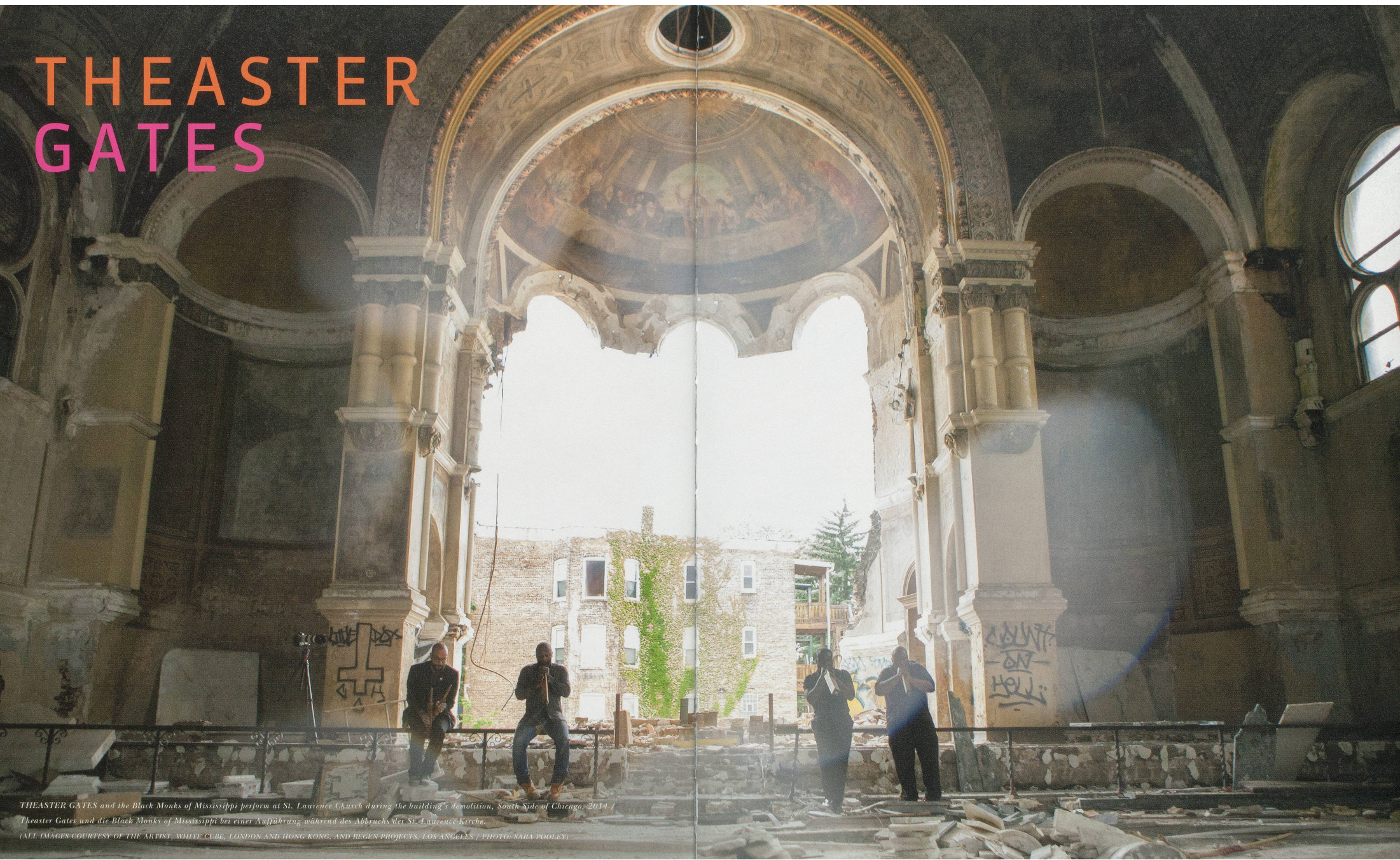
THEASTER GATES and the Black Monks of Mississippi perform at St. Lawrence Church during the building's demolition, South Side of Chicago, 2014 / Theaster Gates und die Black Monks of Mississippi bei einer Aufführung während des Abbruchs der St. Lawrence Kirche.