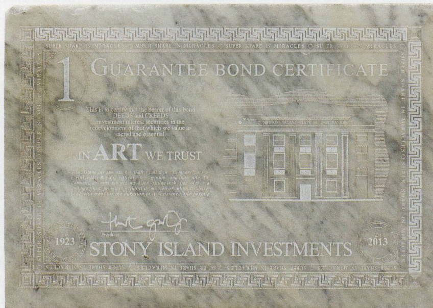
THEASTER GATES, BANK BOND, 2013, marble, 6 \frac{1}{8} \times 8 \frac{5}{8} \times 1 \frac{13}{16} " / BANKOBLIGATION, Marmor, 15,5 x 21,9 x 2,1 cm.

Bei den Gebäuderenovationen im Rahmen der Dorchester Projects wurden «umfunktionierte Materialien aus ganz Chicago» verwendet. 12) Im Gegensatz zu den Kunstwerken, die diese Renovationen unterstützten, wird die tatsächliche oder symbolische Herkunft dieser Materialien jedoch nicht genannt;