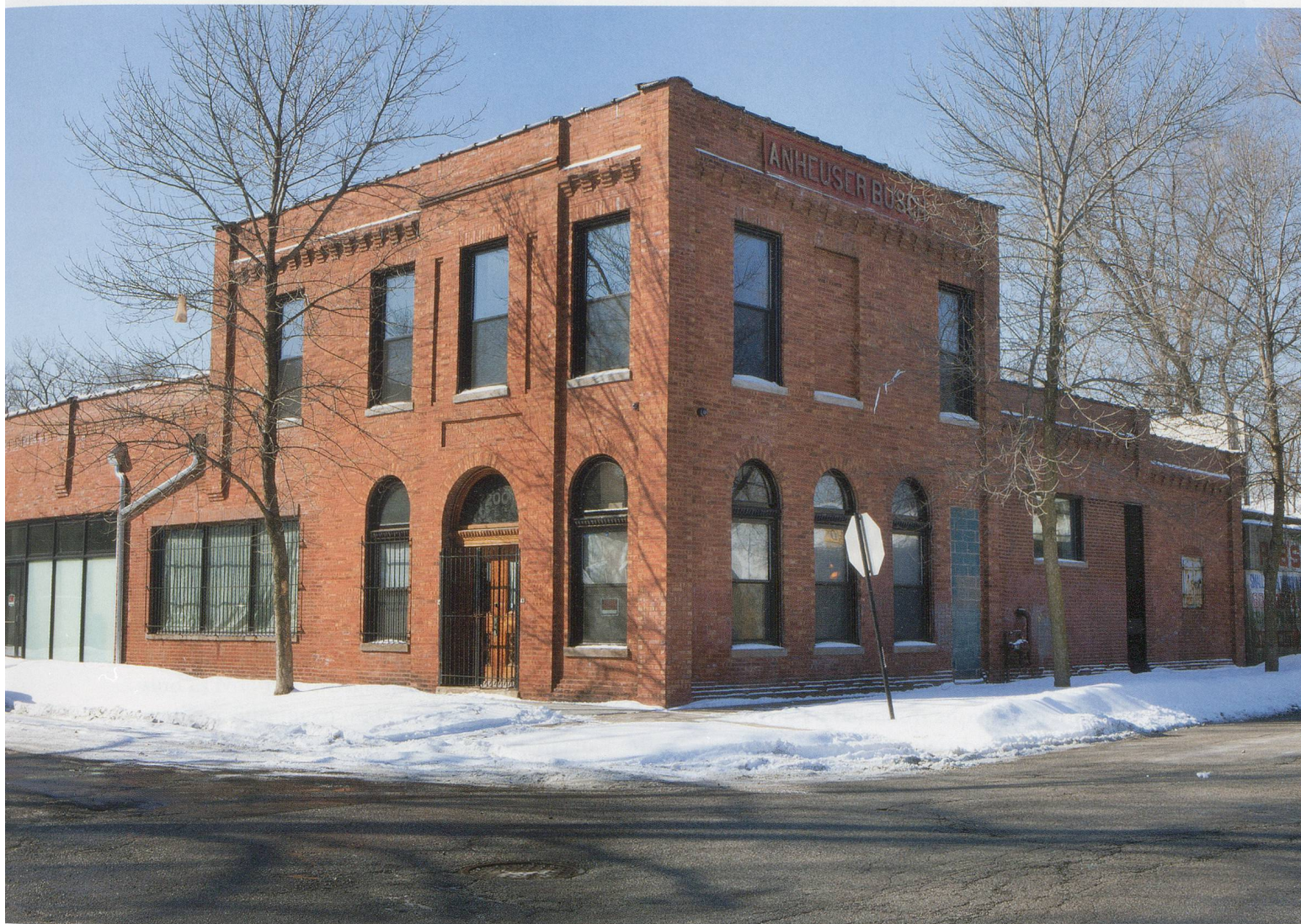
THEASTER GATES, Theaster Gates Studio, Chicago, 2014.