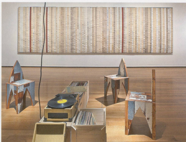
THEASTER GATES, THE LISTENING ROOM , 2012, installation view, Seattle Art Museum / DER HÖRRAUM , Installationsansicht.

discover a new form of urban philanthrocapitalism: “Theaster Gates Sells Fire Hoses to Rebuild Chicago Slums.” 4)