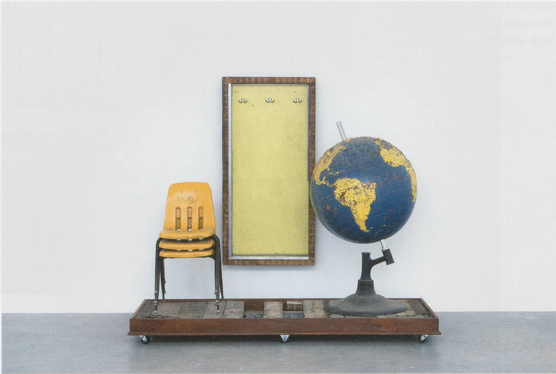
THEASTER GATES, CLASSROOM , 2013, wood, plastic, metal, dimensions variable / KLASSENZIMMER , Holz, Kunststoff, Metall, Masse variabel.

critique of the neoliberal privatization of social welfare that is one of its conditions of possibility. 6)