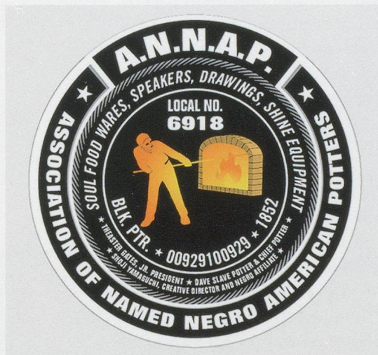
THEASTER GATES, Association of Named Negro American Potters (ANNAP) , 2010, logo / Verband Schwarz-amerikanischer Töpfer, Logo.