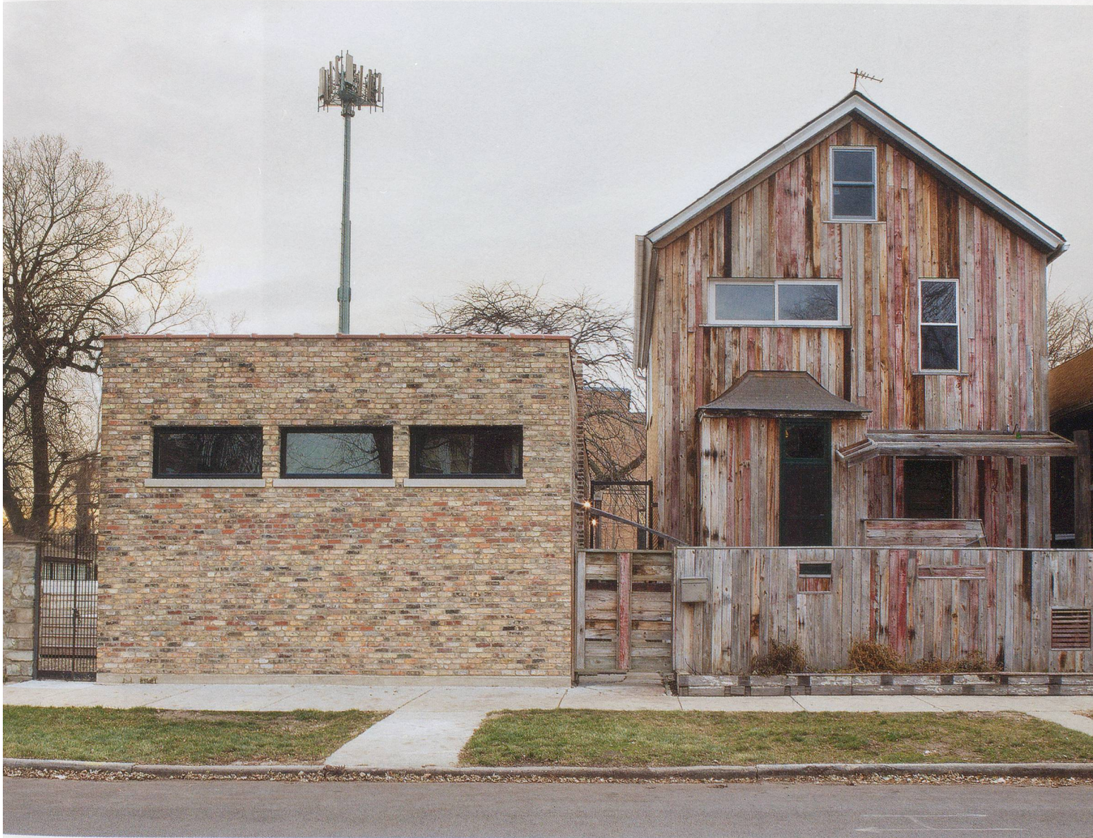
THEASTER GATES, Dorchester Art + Housing Collaborative, Chicago, 2012.