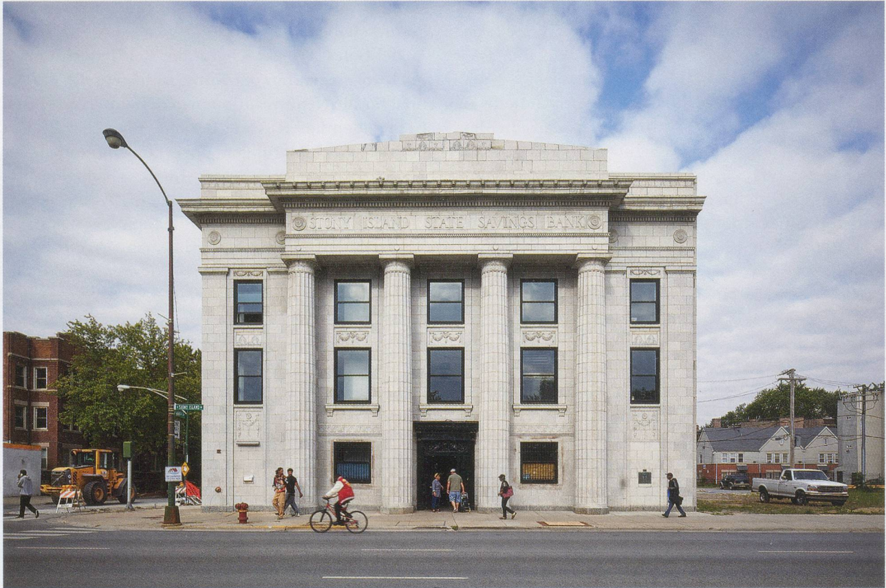
THEASTER GATES, Stony Island Arts Bank , 2012.

bracht und in der Galerie als afro-modernistische Entgegnung auf die einstmaligen weissen Meister der abstrakten Kunst und der Zivilgesellschaft präsentiert – eine formale Umformatierung, die Architekturschutt zu Kunstgeschichte erklärt. 10) Diese Umformatierung wird jedoch durch eine semantische Formatierung ergänzt, die im Titel zum Ausdruck kommt, der das entstandene Kunstwerk in die Geschichte der amerikanischen Rassendiskriminierung einreihet. Zwei Serien von Werken, die aus Feuerwehrschräuchen einer stillgelegten Feuerwache bestehen (und deren Verkauf den «Wiederaufbau von Slums in Chicago» finanziert), heissen beispielsweise IN CASE OF A RACE RIOT (Im Falle eines Rassenkrawalls, 2011–) und IN THE EVENT OF A RACE RIOT (Bei etwaigem Rassenkrawall, 2011–).