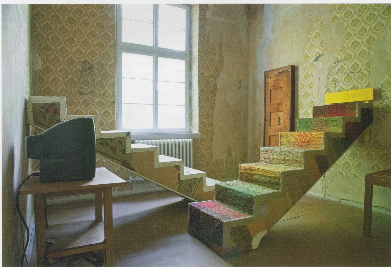
THEASTER GATES, 12 BALLADS FOR HUGUENOT HOUSE , 2012, installation view, Documenta 13 , Kassel / 12 BALLADEN FÜR DAS HUGENOTTENHAUS , Installationsansicht.