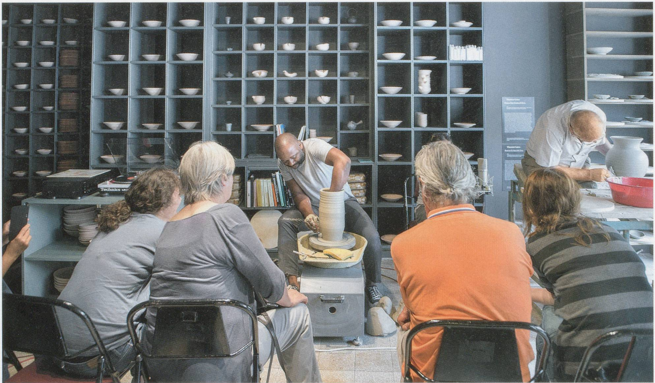
THEASTER GATES, THREE OR FOUR SHADES OF BLUES , 2015, Theaster Gates throws pottery in the installation, Istanbul Biennial / DREI ODER VIER BLUESTÖNE , Theaster Gates an der Töpferscheibe in der Installation.

wichtiger als die Spuren von Gewalt ist die heutige Umlagerung von Ressourcen für die Renovationen. 13) Dasselbe mag auf einen Teil des Archivmaterials zutreffen, das in den Dorchester Projects versammelt ist; so erfolgte beispielsweise die Schliessung von Dr. Wax Records laut Auskunft der Besitzer, weil das Harper Court Shoppingcenter, in dem der Laden untergebracht war, von der University of Chicago gekauft wurde. 14) Die neoliberale Gegenwart ist vielleicht mehr als nur eine Bedingung für Gates' Kreislaufwirtschaft; womöglich regelt sie auf inhaltlicher Ebene die politischen Bedingungen, die in der innerhalb dieser Wirtschaft zirkulierenden Kunst zum Ausdruck kommen.