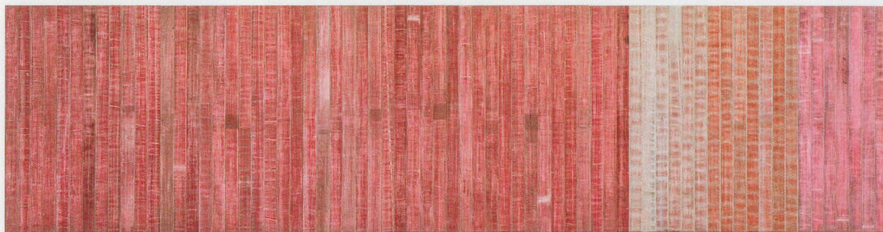
THEASTER GATES, MAMA RED , 2013, wood, decommissioned fire hose, 10 x 40' / MAMA ROT , Holz, ausgemusterter Feuerwehrschlauch, 3 x 12,1 m.

foundations, and, most recently, visionary artists who assume this responsibility. 5) In other words, the call for artistic involvement in urban development is to some degree based upon the premise that the state no longer bears responsibility for underserved communities. The artist-developer is called upon as a moral actor able to defy, exceed, hack, or queer the imperatives of surplus-value accumulation in market-driven development and thereby work on behalf of a greater good. In this sense, artist-led urban development may at once be symptom of, response to, and