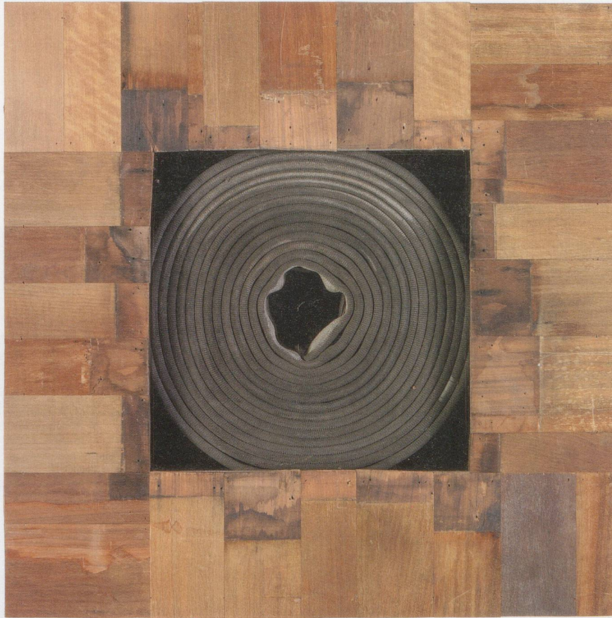
THEASTER GATES, EXECUTIVE SUITE, 2013, wood, decommissioned fire hose, 31 x 31 x 7" / CHEFETAGE, Holz, ausgemusterter Feuerwehrschauch, 78,7 x 78,7 x 17,8 cm.

meshed with one another, albeit in often disavowed ways: black urban neighborhoods defined by capital extraction, on the one hand, and art collections, art institutions, and cultural foundations built upon capital accumulation, on the other. So how does Gates's circular economy relate to the larger economy, an economy in which no exchange is equal and all exchange must yield an excess? And how does that relationship inform what makes today's artist-led urban development so different and so appealing?