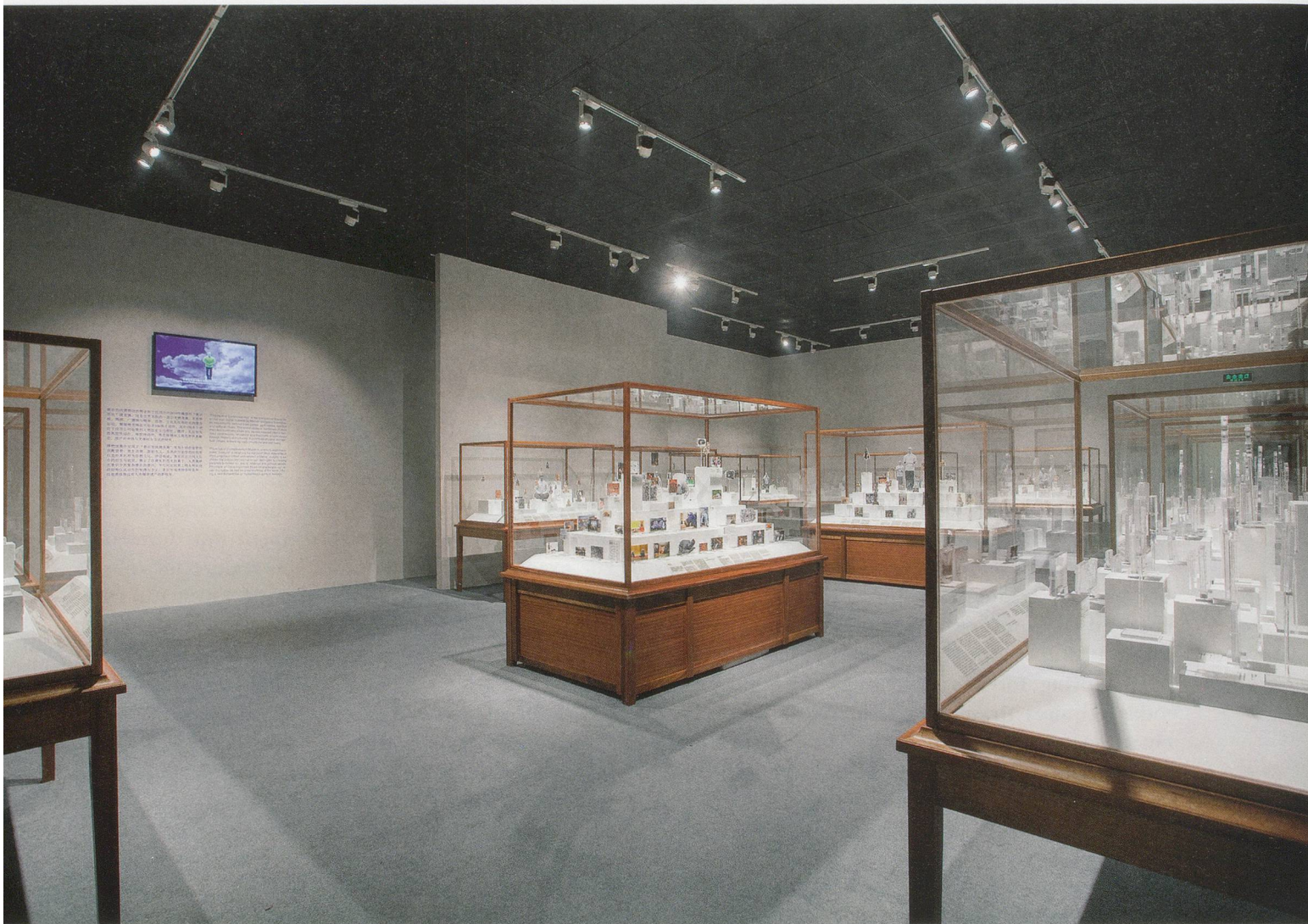
XU ZHEN, PHYSIQUE OF CONSCIOUSNESS MUSEUM , 2014, Sapele wood, C-print, acrylic glass, glass, dimensions variable, produced by MadeIn Company, exhibition view, "Xu Zhen – A MadeIn Company Production," Ullens Center for Contemporary Art, Beijing, 2014 / MUSEUM DER KONSTITUTION DES BEWUSSTSEINS , Sapelli-Holz, C-Print, Acrylglas, Glas, Masse variabel, Ausstellungsansicht.

but it will not go out of fashion. And you will find that many of our works are moving in this same direction—contemporary creation, but hopefully of the sort that will not be filtered out by history, that can remain. Last year, I had a conversation with art historian Lu Mingjun about this shift from making particular works of art to something more akin to articulating a cultural sensibility.