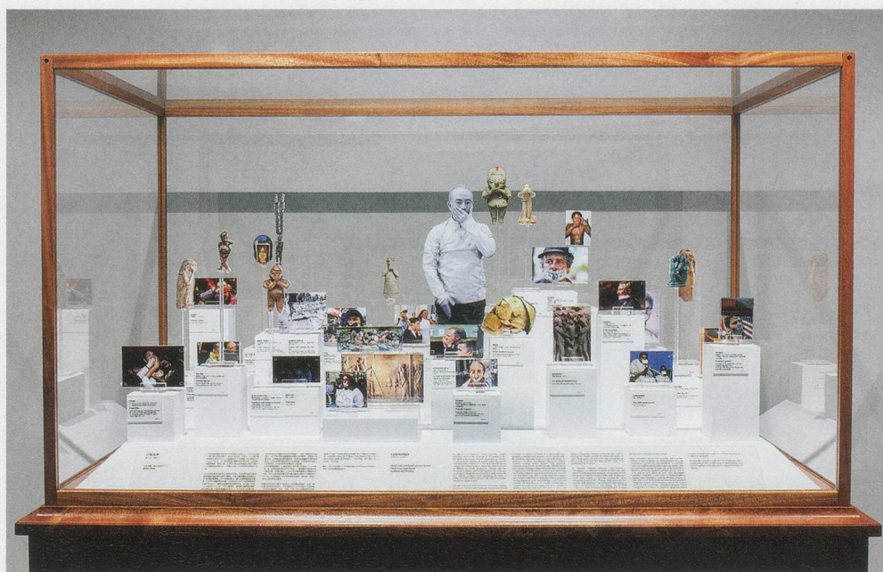
XU ZHEN, PHYSIQUE OF CONSCIOUSNESS MUSEUM – EPISTOMIA , 2014, Sapele wood, C-print, acrylic glass, glass, 67 x 39 1/2 x 67", produced by MadeIn Company / PHYSIK DES BEWUSSTSEINSMUSEUMS – EPISTOMIA , Sapelli-Holz, C-Print, Acrylglas, Glas, 170 x 100 x 170 cm.

XZ: Yes, and this page will definitely be turned. The generation of Huang Yong Ping, which came of age