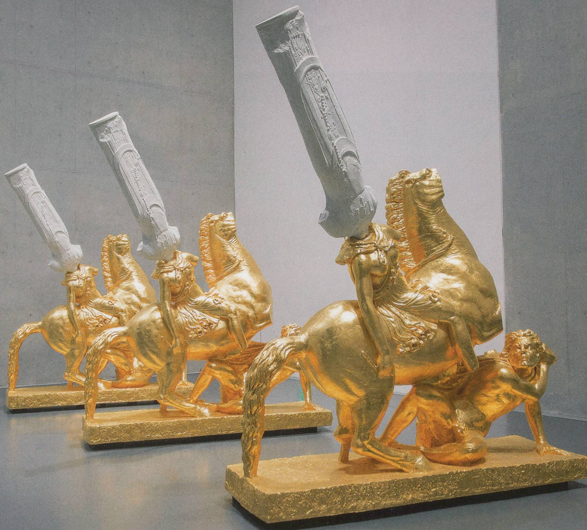
XU ZHEN, ETERNITY – NORTHERN QI STANDING BUDDHA, AMAZON AND BARBARIAN , 2014, glass fiber reinforced concrete, marble grains, metal, gold foil, each 119 \frac{3}{4} \times 39 \frac{3}{8} \times 133 \frac{3}{4} ”, produced by MadeIn Company, exhibition view, Long Museum, Shanghai, 2014 / EWIGKEIT – STEHENDER BUDDHA, NÖRDLICHE QI, AMAZONE UND BARBAR , glasfaserverstärkter Beton, Marmorkörner, Metall, Goldfolie, je 304 \times 100 \times 340 cm, Ausstellungsansicht.

lutely. Whereas with Koons, those who like the work, love it; and those who dislike it, hate it. So I consider him and Polke two different cultural forms.