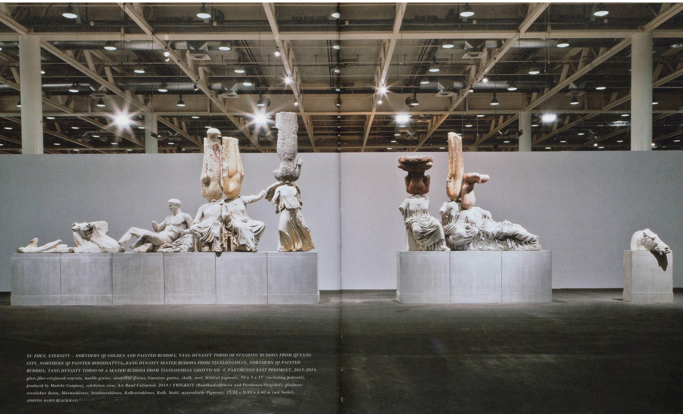
XU ZHEN, ETERNITY – NORTHERN QI GOLDEN AND PAINTED BUDDHA, TANG DYNASTY TORSO OF STANDING BUDDHA FROM QUYANG CITY, NORTHERN QI PAINTED BODHISATTVA, TANG DYNASTY SEATED BUDDHA FROM TIANLONGSHAN, NORTHERN QI PAINTED BUDDHA, TANG DYNASTY TORSO OF A SEATED BUDDHA FROM TIANLONGSHAN GROTTO NO. 4, PARTHENON EAST PEDIMENT, 2013–2014, glass fiber-reinforced concrete, marble grains, sandstone grains, limestone grains, chalk, steel, mineral pigments, 50 x 3 x 15' (including pedestal), produced by MadeIn Company, exhibition view, Art Basel Unlimited, 2014 / EWIGKEIT (Buddhaskulpturen und Parthenon-Ostgiebel), glasfaser-verstärkter Beton, Marmorkörner, Sandsteinkörner, Kalksteinkörner, Kalk, Stahl, mineralische Pigmente, 15,22 x 0,93 x 4,60 m (mit Sockel).