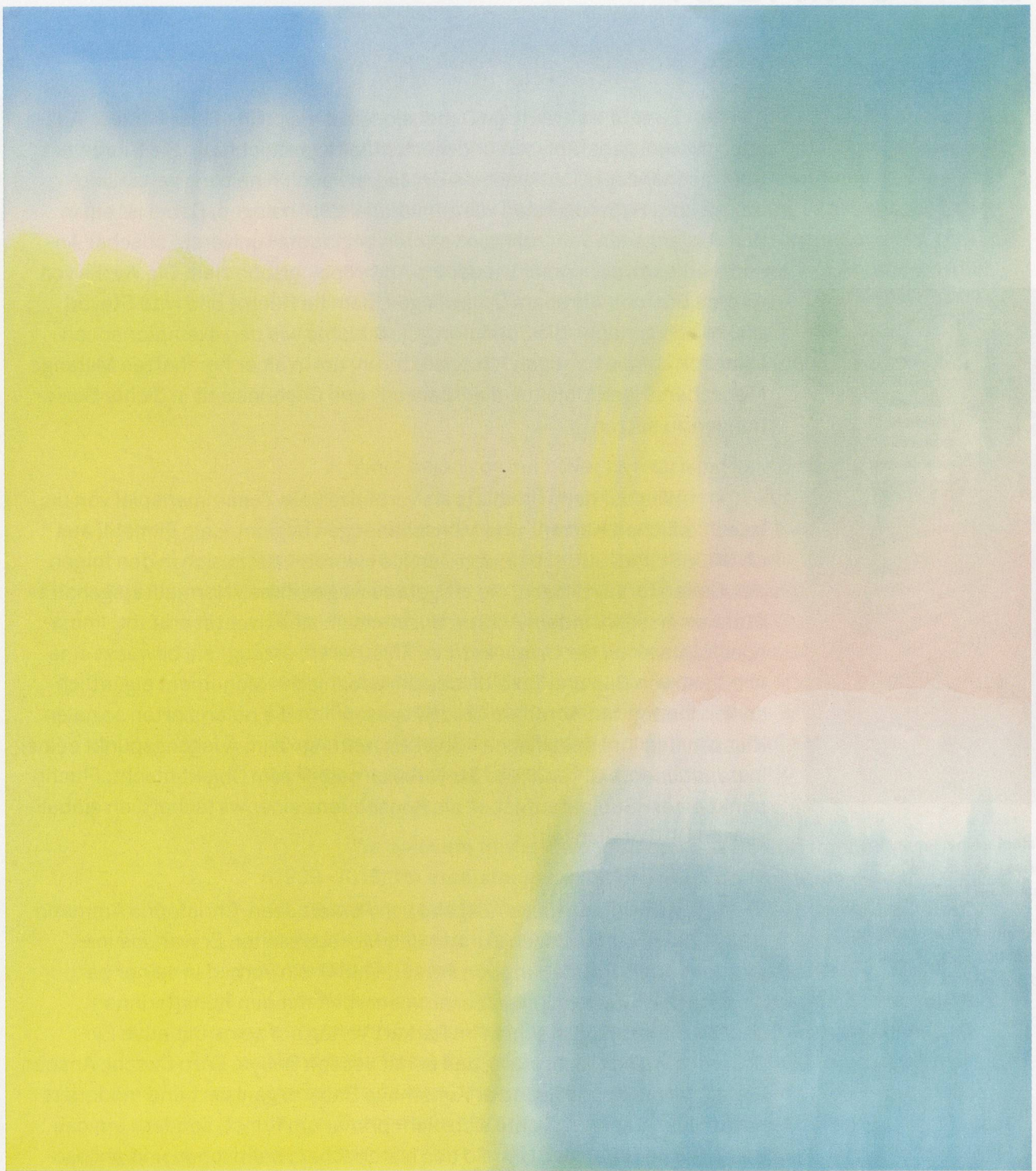
MARKUS DÖBELI, UNTITLED, 2014, acrylic on canvas, 121 1/4 x 107" / OHNE TITEL, Acryl auf Leinwand, 308 x 272 cm. (ALL IMAGES COURTESY OF THE ARTIST AND GALERIE ISABELLA CZARNOWSKA, BERLIN)