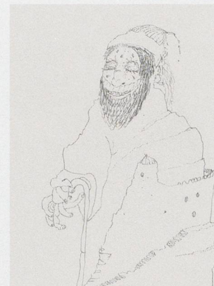
2 of 12 silkscreen prints.

THE FRUITFUL BYWAYS OF MEMORY IN STORIES TOLD AND RETOLD, FRAMED AND REFRAMED.