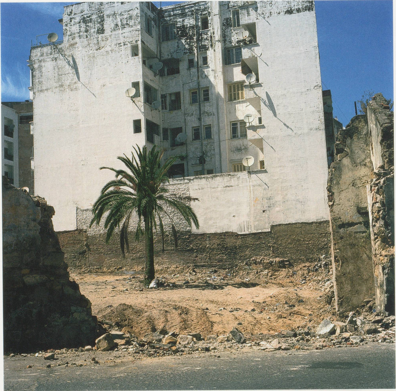
YTO BARRADA, TERRAIN VAGUE N°2 (VACANT LOT NO 2), 2009, C-print, 31 1/2 x 31 1/2" / BRACHLAND, C-Print, 80 x 80 cm.