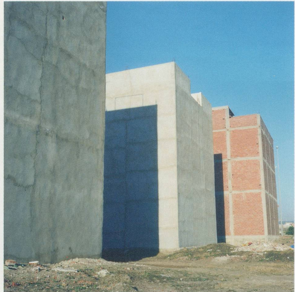
YTO BARRADA, MURS ROUGES FIG. 5 (RED WALLS FIG. 5), 2006, C-print, 39\frac{3}{8} \times 39\frac{3}{8} " / ROTE MAUERN, FIG. 5, C-Print, 100 x 100 cm.

erd an einer Grenze abspielt, bleibt nur noch die Tat, der Bruch mit angestammtem Verhalten, die Möglichkeit, anders zu überleben. Die Protagonistin in Barradas Video THE SMUGGLER (Die Schmugglerin, 2006) ist eine Metapher für eine Welt, die Strategien des Widerstands, der Subversivität und Sabotage einsetzt, und so prekär diese auch sein mögen, sie suggerieren, dass andere Formen, dieses Leben zu bewohnen, möglich sind.