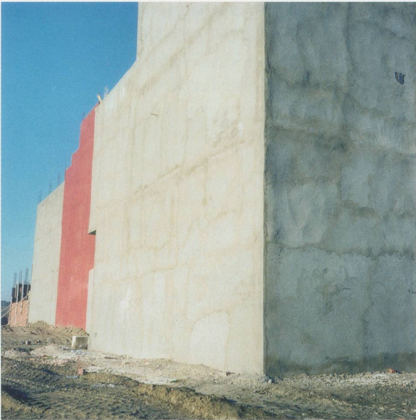
YTO BARRADA, MURS ROUGES FIG. 4 (RED WALLS FIG. 4), 2006, C-print, 39\frac{3}{8} \times 39\frac{3}{8} " / ROTE MAUERN, FIG. 4, C-Print, 100 x 100 cm.