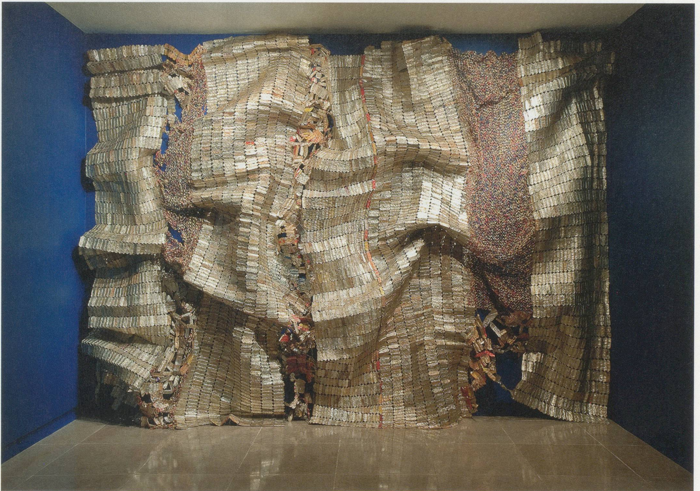
EL ANATSUI, GLI (WALL) , 2010, aluminum bottle caps, rings, copper wire, dimensions variable / GLI (WAND) , Aluminium-Flaschenverschlüsse, Ringe, Kupferdraht, Masse variabel.