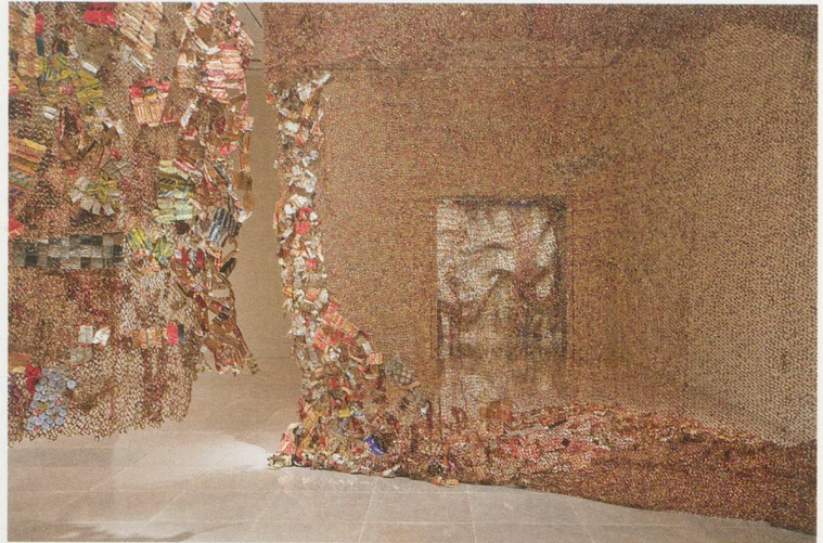
EL ANATSUI, GLI (WALL) , 2010, aluminum bottle caps, rings, copper wire, dimensions variable, detail and installation views, Rice Gallery, Houston / GLI (WAND) , Aluminium-Flaschenverschlüsse, Ringe, Kupferdraht, Masse variabel, Detail und Installationsansichten.