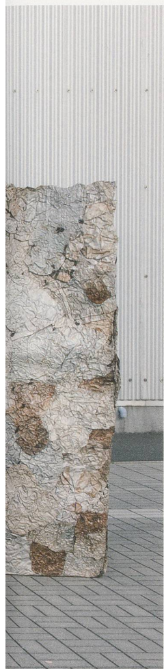
EL ANATSUI, WASTE PAPER BAGS, 2004–2010, printed aluminum plates, copper, variable dimensions / ABFALLSÄCKE, bedruckte Aluminiumplatten, Kupfer, Masse variabel.

genheit, Gegenwart und Zukunft kann immer nur vorläufig sein. Wie Anatsui bemerkt hat, wird dies durch das Überwiegen des Mündlichen als Hauptmodus des sozialen Diskurses und Gedächtnisses in afrikanischen Gesellschaften plausibel. Es ist dieser Zustand des Vorläufigen – mit all seinen philosophischen, existenziellen und formalen Implikationen –, den sein Werk anpeilt. 4)