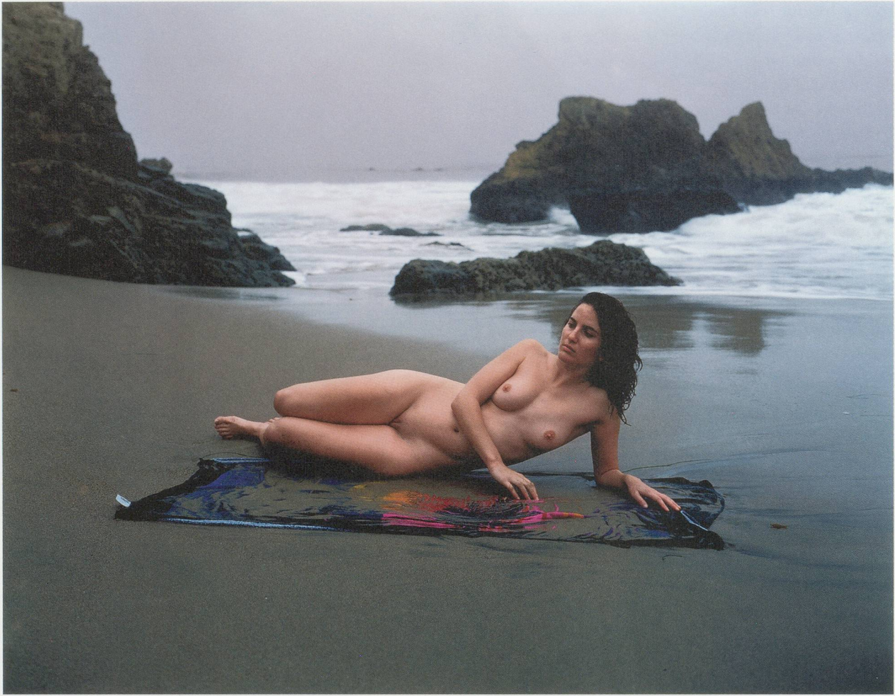
MALERIE MARDER, UNTITLED , 2000, Carnal Knowledge, archival pigment print, 48 x 60" / OHNE TITEL , alterungsbeständiger Pigmentprint, 121,9 x 152,4 cm.

MG: You are definitely the main character. But you hold back—that's true with a lot of the nudes. For some reason it's not full exposure. Often it feels very hands-off.