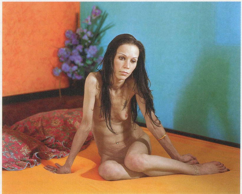
MALERIE MARDER, UNTITLED, 2010, Anatomy Series, archival pigment print, 23 x 30" / OHNE TITEL, alterungs- beständiger Pigmentprint, 58,4 x 76,2 cm.

MM: Das stimmt, das kenne ich. Es ist wie diese Art von Vergesslichkeit, die sich zum Beispiel nach der Geburt einstellt.