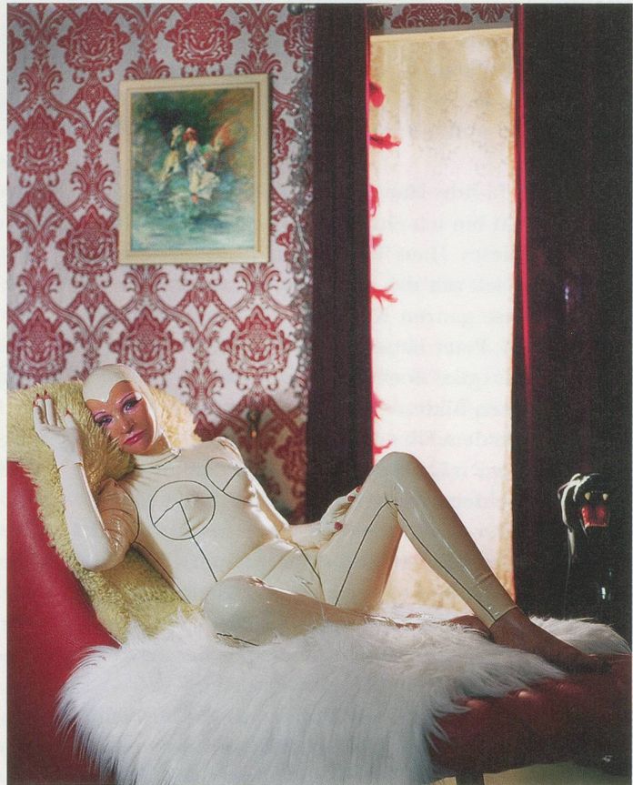
MALERIE MARDER, UNTITLED, 2009, Anatomy Series, archival pigment print, dimensions variable / OHNE TITEL, alterungs- beständiger Pigmentprint, Masse variabel.

MM: Nein. Aber eine Frage, die ich regelmässig ge-