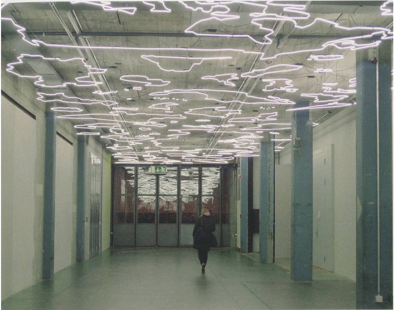
MONA HATOUM, SILVER LINING, 2011, neon installation, Hochschule der Künste, Bern / SILBERSTREIFEN, Neoninstallation.