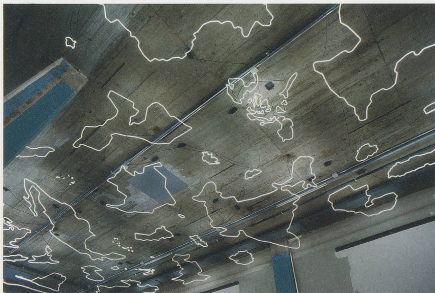
MONA HATOUM, SILVER LINING, 2011, neon installation, Hochschule der Künste, Bern / SILBERSTREIFEN, Neoninstallation.

Immer wieder muss Mona Hatoum sich mit neuen politisch-sozialen und kulturellen Situationen auseinandersetzen. In Interviews betont sie, dass sie gerne als artist in residence eine Kunst mache, die sich auf einen bestimmten Ort bezieht. Denn, wo ihre Arbeit ist, gibt es für sie ein Zuhause. Ihre Installationen mögen dann allerdings Titel wie «Unhomely» (2008) tragen, was mit «heimatlos» oder «ungemütlich» übersetzt werden kann. Dabei kann es sich um Assemblagen von gewaltig vergrösserten Küchengegenständen oder um Möbel handeln, die manchmal gefährlich elektrisch verkabelt sind, oder um einen Orientteppich am Boden, dessen ausgerupfter Flor eine Weltkarte darstellt. Die Weltkarte und der Globus sind Leitthemen, die Mona Hatoum ständig neu formuliert und materialisiert wie in SILVER LINING, ihrer bis anhin grössten Arbeit im öffentlichen Raum.