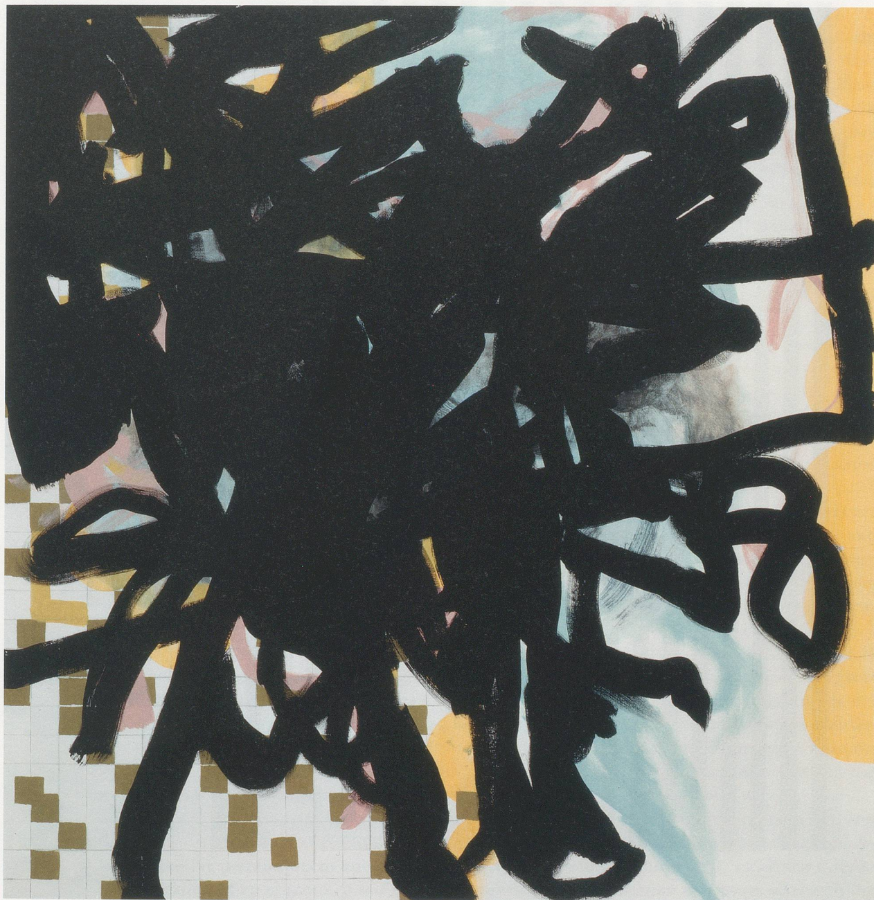
CHARLINE VON HEYL, DEHANDS, DEFEATS , 2011, acrylic on linen, 60 x 62" / Acryl auf Leinen, 152,4 x 157,5 cm.