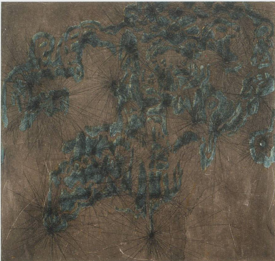
CHARLINE VON HEYL, PAST GONE MAD, 2009, acrylic, oil, charcoal, and wax crayon on linen, 82 x 86" / Acryl, Öl, Kohle und Ölkreide auf Leinen, 208,3 x 218,4 cm.

Manet war es, der sich nicht wiederholen wollte, der keine Variationen zu einem Thema abliefern, sondern konsequent inkonsequent sein wollte. Und Manet und Seurat setzten einen Massstab, den nur wenige Künstler aufrechtzuerhalten vermochten, weil die materielle Belohnung, die winkte, sofern man sich am Inbegriff der Verlässlichkeit, Claude Monet, orientierte, verständlicherweise attraktiver war. Um wirklich anti-institutionell zu sein, muss man der Versuchung widerstehen, typische Werke zu produzieren, das hat Manet offenbar begriffen. Als es seinem Freund Antonin Proust, der nach nicht einmal drei Monaten bereits wieder aus seinem Amt des Kultusministers verdrängt wurde, gelang, Manet den begehrten Orden der Ehrenlegion zu verschaffen, meinte der Künstler über seine Kritiker: «Die Dummköpfe! Sie hörten nicht auf, meine Inkonsequenz zu bemängeln. Ein grösseres Kompliment hätten sie mir gar nicht machen können.» 1)