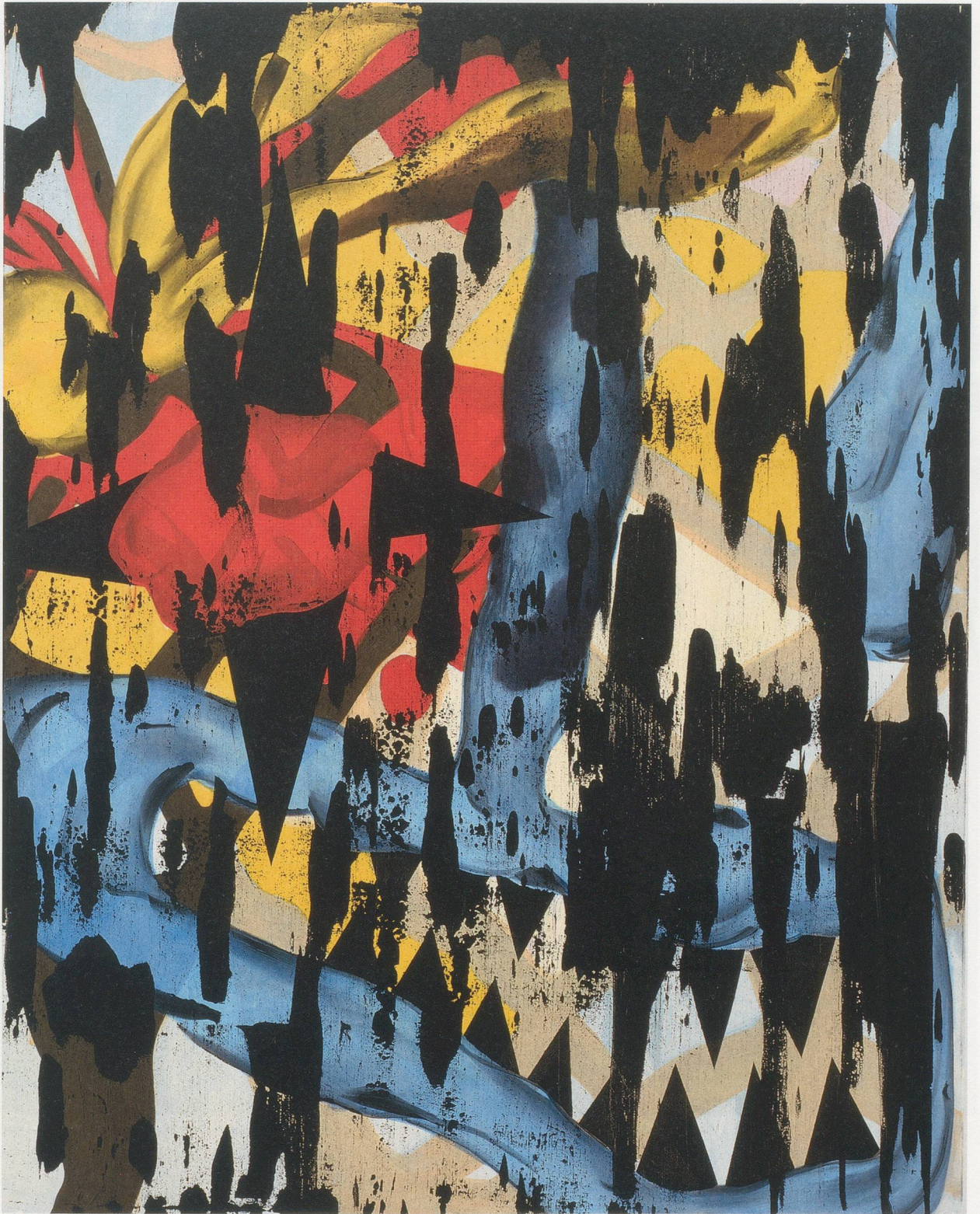
CHARLINE VON HEYL, BOOZO, 2010, acrylic, oil, and charcoal on linen, 60 x 48" / Acryl, Öl und Kohle auf Leinen, 152,4 x 121,9 cm.