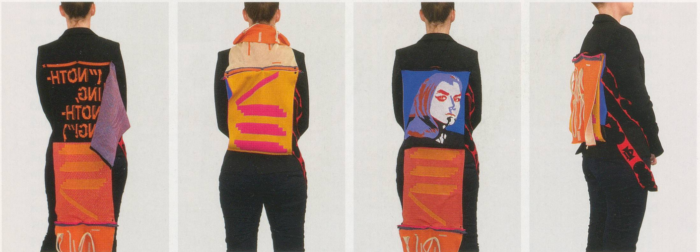
Parasite Patch „NOTHING NOTHING“, Design layers / Design Variationen

Auflage 18 / X für jede Version, mit signiertem und nummeriertem Zertifikat.