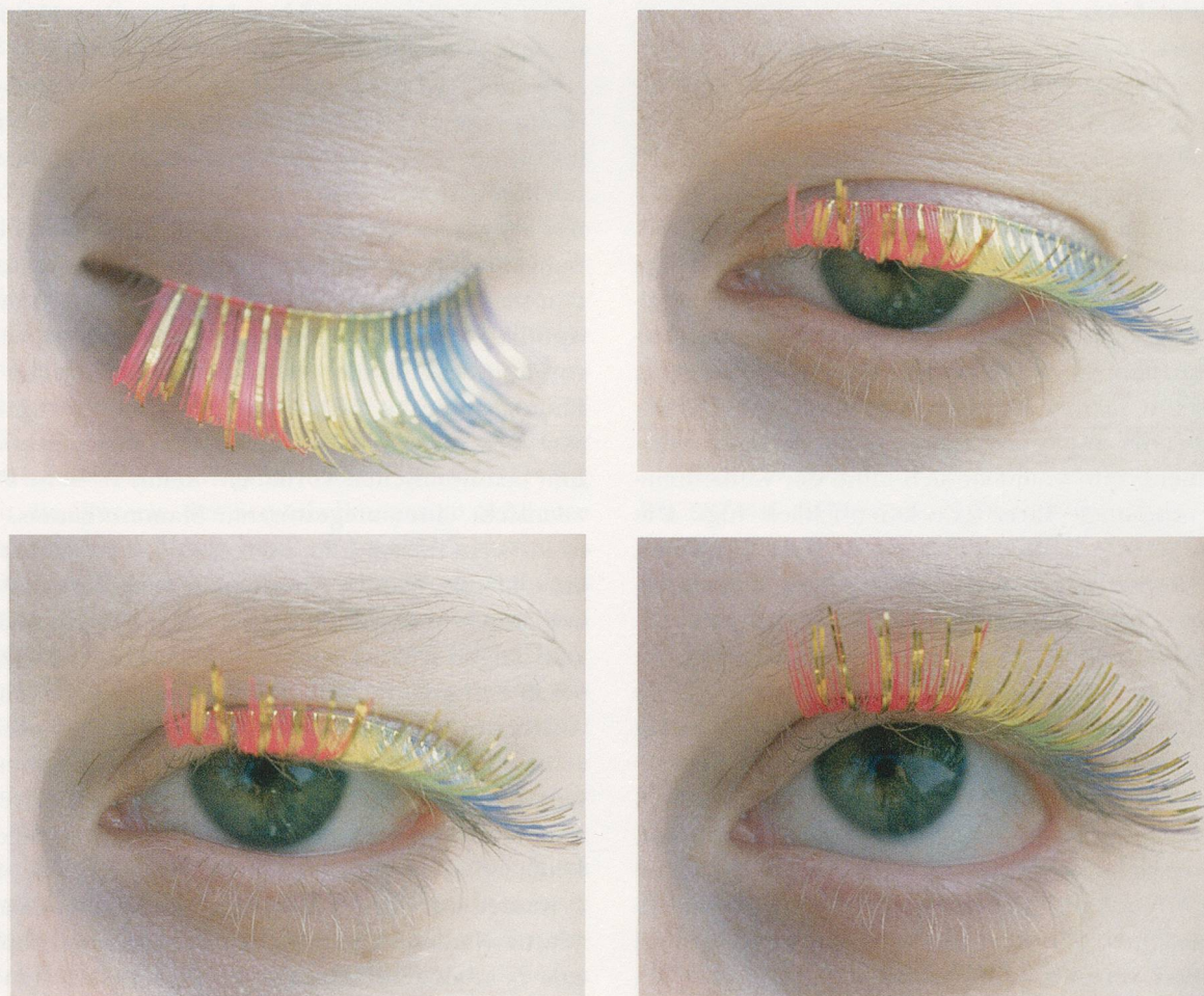
ANNETTE KELM, BACKSTAGE, 2004, c-print, 4 parts, 16 1/2 x 59 1/4 x 1 1/4"

Durch diesen seltsamen Umstand war die Photographie in den späten 70er-Jahren zu einer vollkommen polarisierten Domäne der Kunst geworden. Die