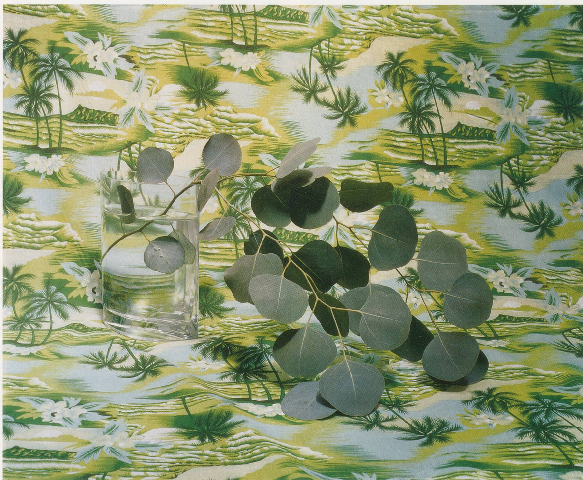
ANNETTE KELM, AFTER LUNCH TRYING TO BUILD RAILWAY TIES , 2005, c-print, 20 x 24" / NACH DEM MITTAGESSEN, VERSUCH EISENBAHNSCHWELLEN ZU BAUEN, C-Print, 50,8 x 61 cm.