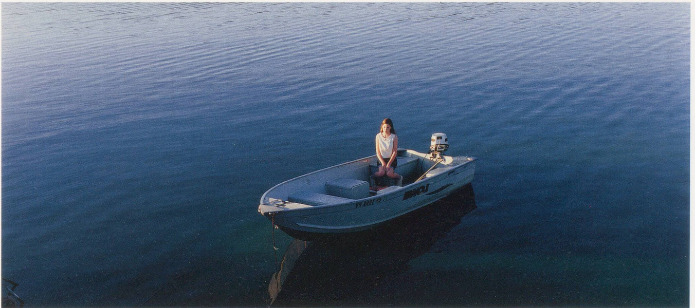
PHILIPPE PARRENO, JUNE 8, 1968, 2009, film still / 8. JUNI, 1968, Filmstill.