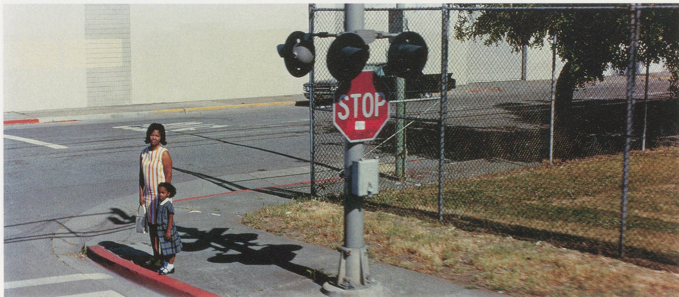
PHILIPPE PARRENO, JUNE 8, 1968, 2009, film still / 8. JUNI, 1968, Filmstill.

laubt hätten, wesentliche Fragen zu beantworten: Wer hat geschossen, von wo, und wie viele Male?