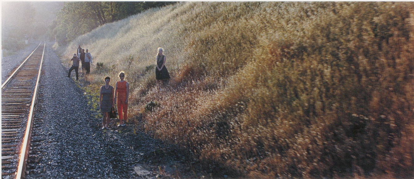
PHILIPPE PARRENO, JUNE 8, 1968, 2009, film stills, 70 mm film, approx. 8 min. / 8. JUNI, 1968, Filmstills, 70-mm-Film, ca. 8 Min.