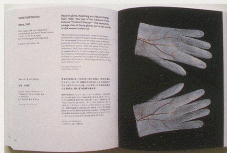
Meret Oppenheim, Edition for Parkett 4 (From «200 ARTWORKS, 25 YEARS»)