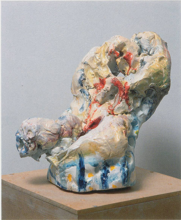
REBECCA WARREN, DER TOTSCHLÄGER ( The Manslayer ), 2002, self-firing, painted clay, plinth, 12 1/4 x 12 1/4 x 8 5/8 " / selbsttrocknender, bemalter Ton, Sockel, 31 x 31 x 22 cm.

Commedia illustrieren sollten. In ungefähr fünf Jahren hatte er rund zweihundert Figuren beisammen, die Baudelaires erotischen, dekadenten Liebenden immer ähnlicher sahen. Ein Besucher des Ateliers an der Rue de l'Université hätte einen vom Geist der spontanen Kreation Besessenen, ja Vergifteten erblickt. Ein «unermessliches Heer todgeweihter Frauen wurde zum Leben erweckt und wand sich in seinen Händen. Einige lebten ein paar Stunden, bevor sie wieder in die Masse des stetig neu verarbeiteten Tons eingingen.» 3) Dennoch wurden in diesem gut organisierten Atelier, in dem eine Reihe technischer Spezialisten zu Gange waren, viele Figuren in Gips gegossen und Negativformen manchmal wieder mit frischem Ton gefüllt, obwohl Rodin sämtliche Originale und Variationen für den Rest seines Lebens bei sich behielt.