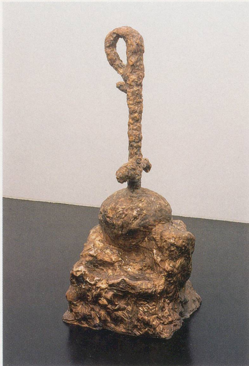
REBECCA WARREN, P.E. , 2005, bronze, 62 1/4 x 26 3/8 x 24 3/4" / Bronze, 158 x 67 x 63 cm.