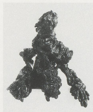
WILLEM DE KOONING, LARGE TORSO, 1974, bronze, 36 x 36 x 26 1/2" / GROSSER TORSO, Bronze, 91,5 x 91,5 x 67,3 cm.