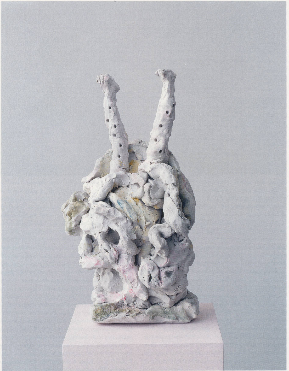
REBECCA WARREN, HUNDEMEISTER (Dog Master) , 2004, reinforced clay, acrylic paint, 19\frac{1}{4} \times 9 \times 8\frac{1}{4} " / verstärkter Ton, Acrylfarbe, 49 x 23 x 21 cm.