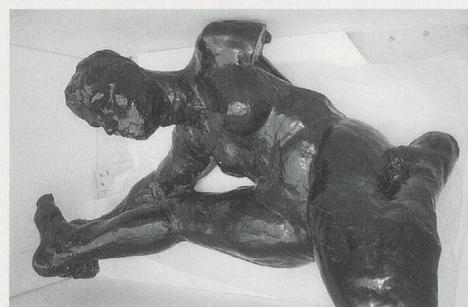
AUGUSTE RODIN, CROUCHING WOMAN, ca.1895, bronze, 20 3/4 x 13 3/8" / KAUERNDE FRAU, Bronze, 53 x 34 cm.