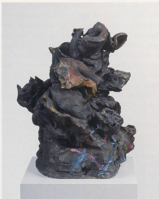
REBECCA WARREN, LOULOU, 2006, painted reinforced clay, plinth, 16 1/2 x 13 3/4 x 13" / bemalter verstärkter Ton, Sockel, 42 x 35 x 33 cm.