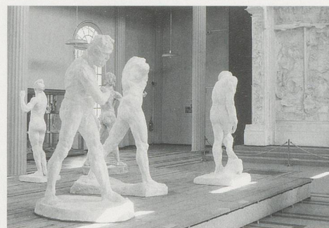
AUGUSTE RODIN, standing figures and THE GATE OF HELL, Musée Rodin, Meudon / Skulpturen und HÖLLENTOR.