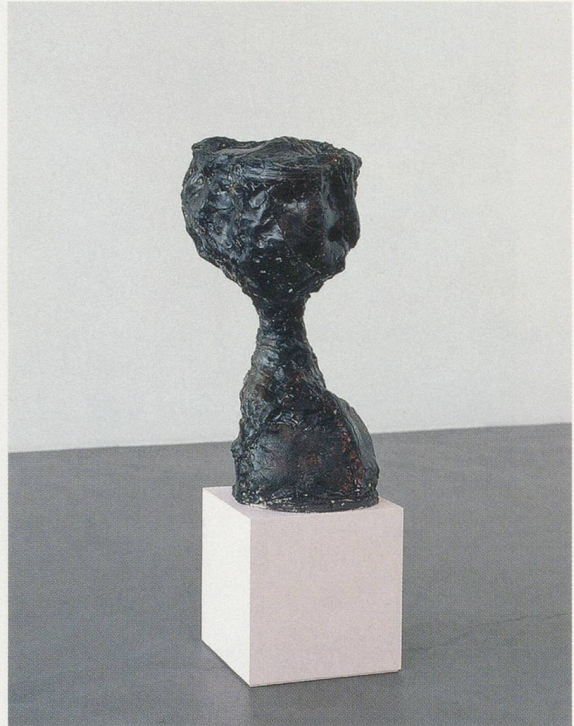
REBECCA WARREN, LIGHT OF THE WORLD , 2004, reinforced clay, acrylic paint, pom pom, 44 1/8 x 13 3/8 x 13 3/8" / LICHT DER WELT, verstärkter Ton, Acrylfarbe, Pompon, 112 x 34 x 34 cm.

ter, the piece-molds sometimes re-filled with fresh clay, the originals and the variations remaining in Rodin's possession for the rest of his life.