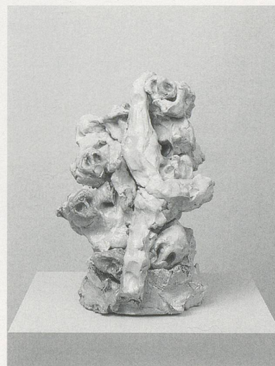
REBECCA WARREN, MADDER ROSE , 2003, self-firing, painted clay, plinth, 14 5/8 x 11 x 10 5/8" / VERRÜCKTERE ROSE, selbstdrockender Ton, Sockel, 37 x 28 x 27 cm.

13) Lizzie Carey-Thomas, Turner Prize 2006 , Broschüre der Tate Britain, 2006.