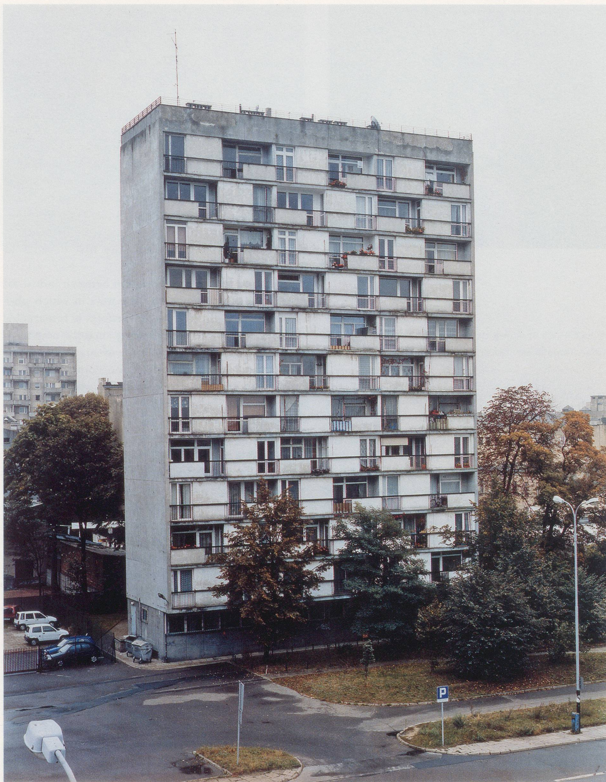
CHRISTOPHER WILLIAMS, Lodz, October 2, 2004, C-print, 24 x 20" / Lodz, 2. Oktober 2004, C-Print, from / aus "Program. For Example: Dix-Huit Leçons Sur La Société Industrielle (Revision 1-4)."