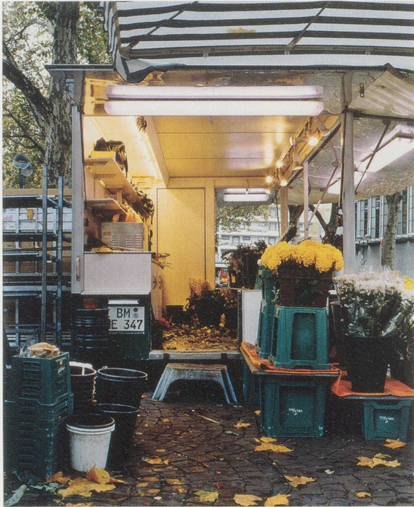
CHRISTOPHER WILLIAMS, Cologne, November 1, 2004, C-print, 14 x 11" / Köln, 1. November, C-Print, 35,6 x 27,9 cm, from / aus "Program. For Example: Dix-Huit Leçons Sur La Société Industrielle (Revision 1-4)."

Ton und beinahe orange, und es ruft sofort die charakteristische Farbgebung der Firma Kodak in Erinnerung. Die Farbe findet sich im Gelb der Handtücher, in den Photos der jungen Frau, im Gelb der Lockenwickler, im Farbton des isolierten deutschen Standardpäckchens, in einem Blumenstrauß im Bild des Kölner Blumenhändlers, im Autolack der Werbung für den Dacia 1300 und, weniger ausgeprägt, in einer Photographie künstlicher Maiskolben.