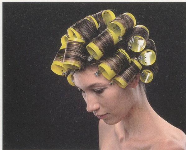
CHRISTOPHER WILLIAMS, Rollerstacker, R-136MR , 2005, C-print, triptych, each 16 x 20" / C-Print, Triptychon, je 40,6 x 50,8 cm, from / aus "Program. For Example: Dix-Huit Leçons Sur La Société Industrielle (Revision 1-4)."

are three groups of photographs. The first group, a series of black-and-white gelatin silver prints, shows a young female model partially obstructed by the crinkled glass of a shower stall door, with shampoo foam in her hair. In the different pictures, she strikes a sequence of poses, massaging the shampoo into her scalp, smiling at the camera, and gazing dreamily outside of the frame. The second group shows the same model wrapped in two yellow towels—one around her torso, the other with a turban tied around her head—smiling and laughing, fully aware of the camera. The left side of these pictures, which in the previous series was taken up by the shower divider, now prominently displays a Kodak Three Point Reflection Guide , held in place by a photo clamp. A third series of photographs, united into a triptych, shows the young woman with yellow curlers in her hair, her gaze directed first downward and then away from the camera.