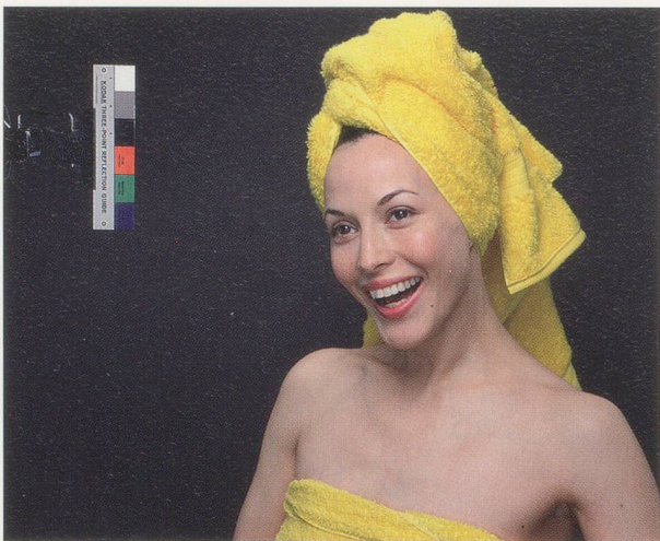
CHRISTOPHER WILLIAMS, Kodak Three Point Reflection Guide , 1968, 2005, C-print, each 20 x 24" / C-Print, je 50,8 x 61 cm, from / aus "Program. For Example: Dix-Huit Leçons Sur La Société Industrielle (Revision 1-4)."