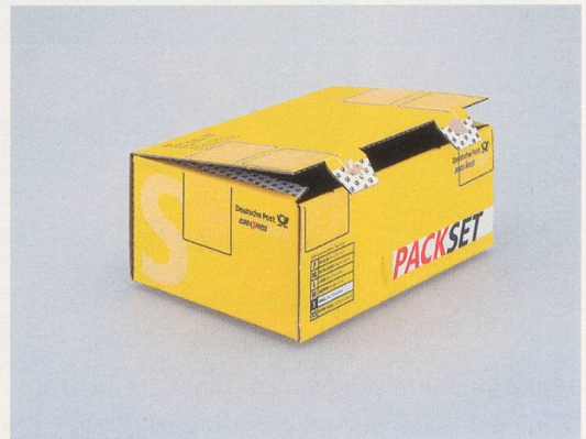
CHRISTOPHER WILLIAMS, Packset, Deutsche Post , 2003, dye transfer print, 16 x 20" / Dye-Transfer-Abzug, 40,6 x 50,8 cm, from / aus "Program. For Example: Dix-Huit Leçons Sur La Société Industrielle (Revision 1-4)."

famously called the "society of the spectacle." Ultimately, photography serves for Williams as the programmatic example through which one can revise thinking about the conditions of our modern industrial society, as a visual technology that partakes in both culture and industry.