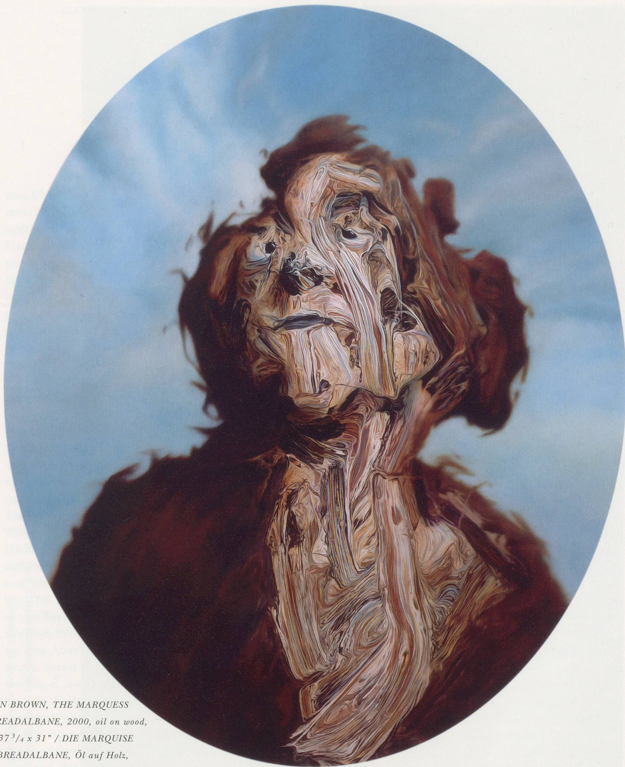
GLENN BROWN, THE MARQUESS OF BREADALBANE , 2000, oil on wood, oval, 37 3 / 4 x 31" / DIE MARQUISE VON BREADALBANE , Öl auf Holz, oval, 96 x 78,5 cm.