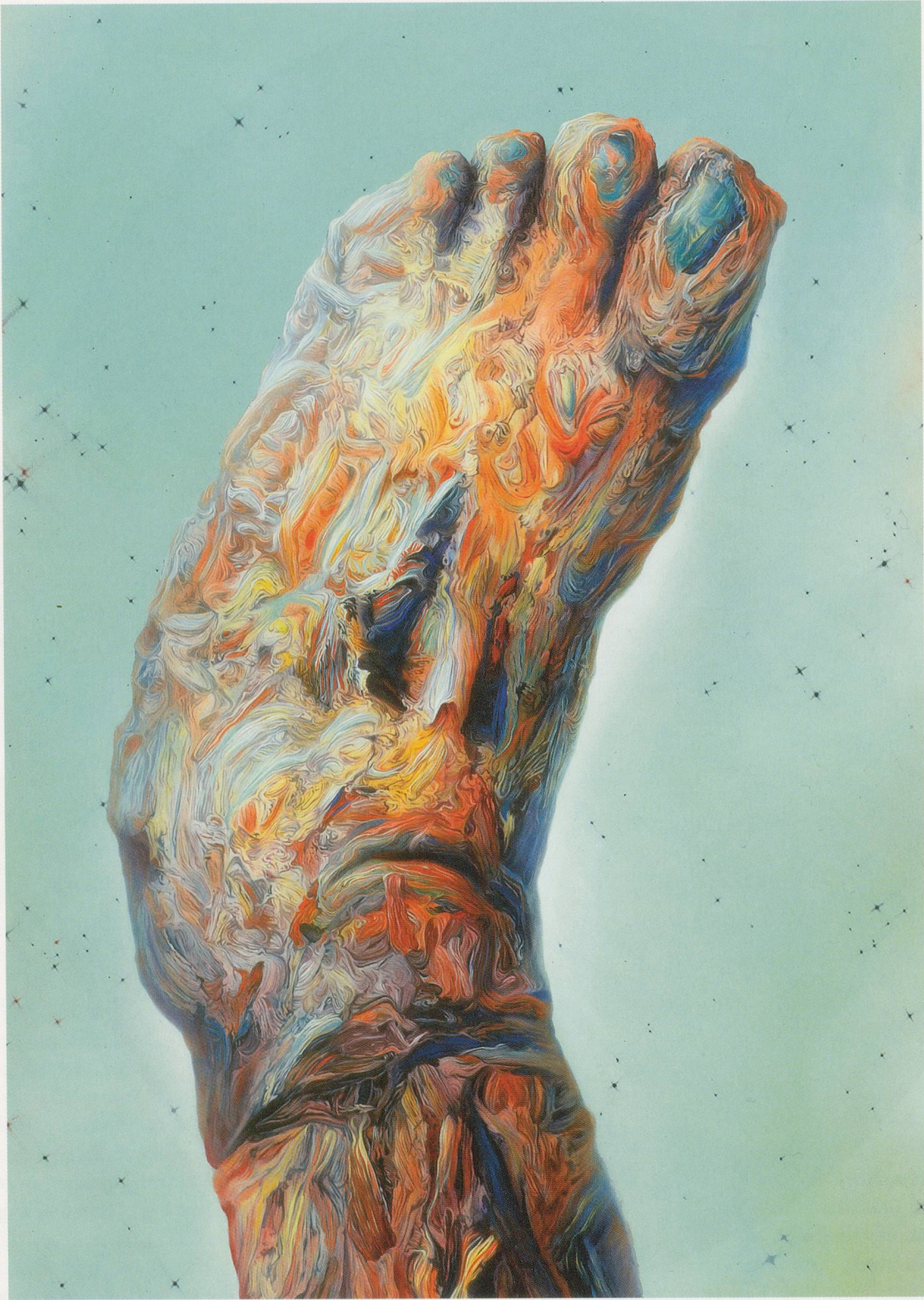
GLENN BROWN, THE OSMOND FAMILY , 2003, oil on panel, 56 1 / 8 x 39 5 / 8 " / Öt auf Holz, 143 x 101 cm.