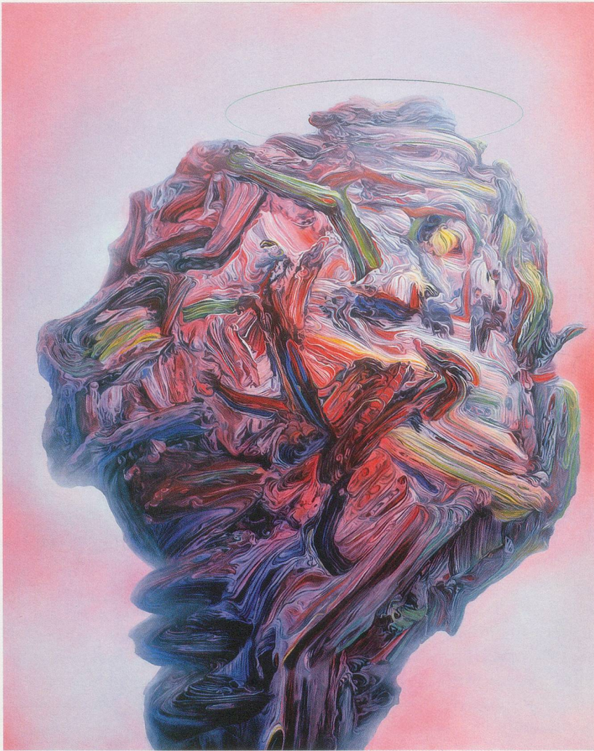
GLENN BROWN, DIRTY, 2003, oil on panel, 41 3 / 8 x 32 5 / 8 " / SCHMUTZIG, Öl auf Holz, 105 x 83 cm.

begreifen, dass etwas derart Kompliziertes lediglich aus mit kleinen Pinseln sorgfältig auf die Leinwand aufgetragenen Pigmenten besteht. Nehmen wir als Beispiel THE OSMOND FAMILY (2003), benannt nach einer der süßlichsten, kraftlosesten Familien-Bands der 70er Jahre. Das Bild zeigt einen grauenhaften, vermutlich toten Fuss – seine Haut ist übersät mit etwas Widerlichem, vielleicht Wundbrand oder altes Plastilin – mit Zehennägeln in einem erstickten Blauton. Es ist ein grausamer und rätselhafter Witz von einem Bild, aber ich bin sicher, mit Ausnahme der Osmond Family wird jedermann herzlich darüber