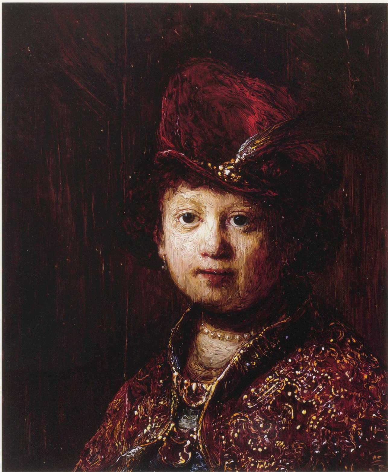
GLENN BROWN, I LOST MY HEART TO A STARSHIP TROOPER, 1996, oil on canvas mounted on board, 25 1/2 x 21" / ICH HABE MEIN HERZ AN EINEN STERNFLOTTEN-SOLDATEN VERLOREN, Öl auf Leinwand aufgezogen auf Holz, 64,8 x 53,5 cm.