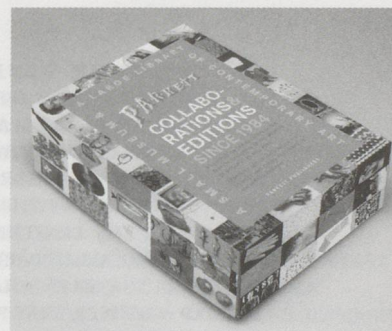
Parkett Postcard Set

Anzeigenbedingungen: Kauf eines Abonnements bzw. eines Geschenkabonnements bei Platzierung eines Inserates. / Advertising rates: Order of one (gift) subscription per ad.