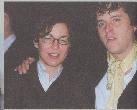
Elizabeth Peyton & Tony Just