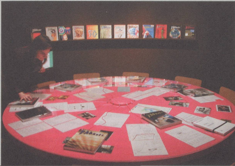
Exhibition view of reading table with Parkett issues and artists' correspondence