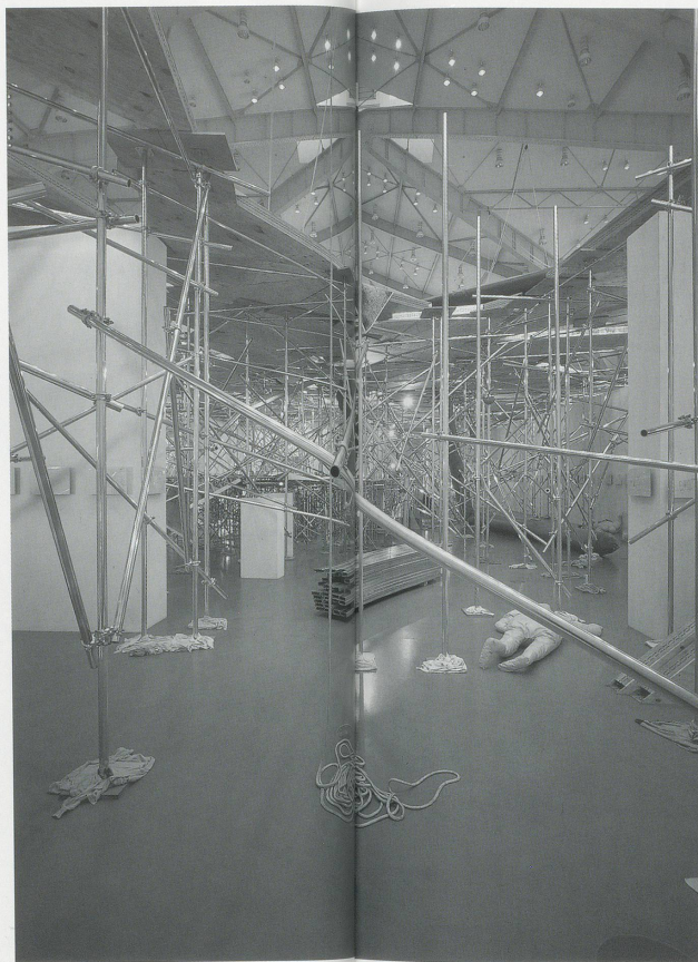
EINE VOLLKOMMENE WELT, Blick von unten.

reproduced on two large plotters that tirelessly printed out the whole, moving back and forth inch by inch, like knotting a rug. As a flat, largely green picture of grasses, leaves, blossoms, a bit of soil, some stuff lying around between the plants, and sometimes a Mephisto walking shoe, the garden gradually