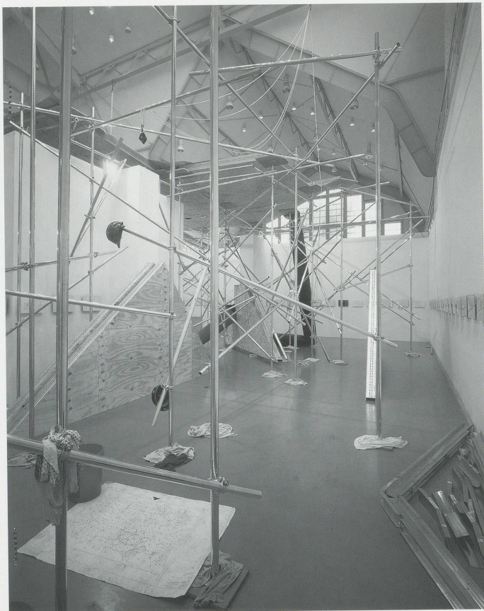
JASON RHOADES, A PERFECT WORLD, 1999, installation views at Deichtorhallen, Hamburg /

The entire area of the garden had been photographed piece by piece for this purpose. This picture was now placed in a smaller room at the Deichtorhallen as an analogue photo document spread out on a table and also as a digital document in the computer. From the stored data, each foot in the garden was