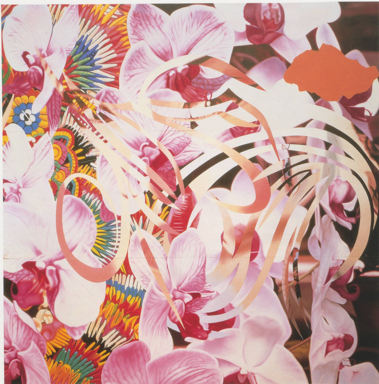
JAMES ROSENQUIST, BALI, 1995, oil on canvas, 192 x 192" / Öl auf Leinwand, 487,7 x 487,7 cm.