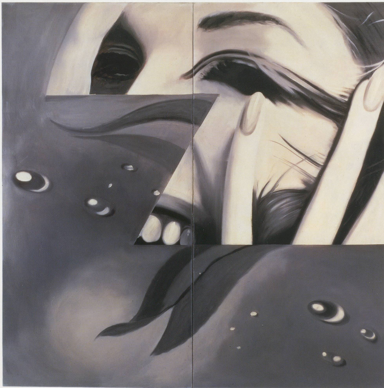
JAMES ROSENQUIST, ZONE, 1961, oil on canvas, 95 x 95½" / Öl auf Leinwand, 241,3 x 242,6 cm.