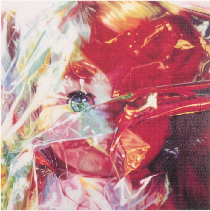
JAMES ROSENQUIST, THE SERENADE FOR THE DOLL AFTER CLAUDE DEBUSSY: GIFT WRAPPED DOLL NO. 1, 1992 (p. 34) and GIFT WRAPPED DOLL, NO. 14, 1992 (p. 35), both oil on canvas, 60 x 60" / GESCHENKVERPACKTE PUPPE NR. 1 (S. 34) und GESCHENKVERPACKTE PUPPE NR. 14 (S. 35), beide Öl auf Leinwand, 152,4 x 152,4 cm.

F-111 zu malen. Es war eine andere Zeit und eine andere Welt, mit einem wieder vereinigten Deutschland und dem Deutschen Guggenheim-Museum im ehemaligen Ostberlin.