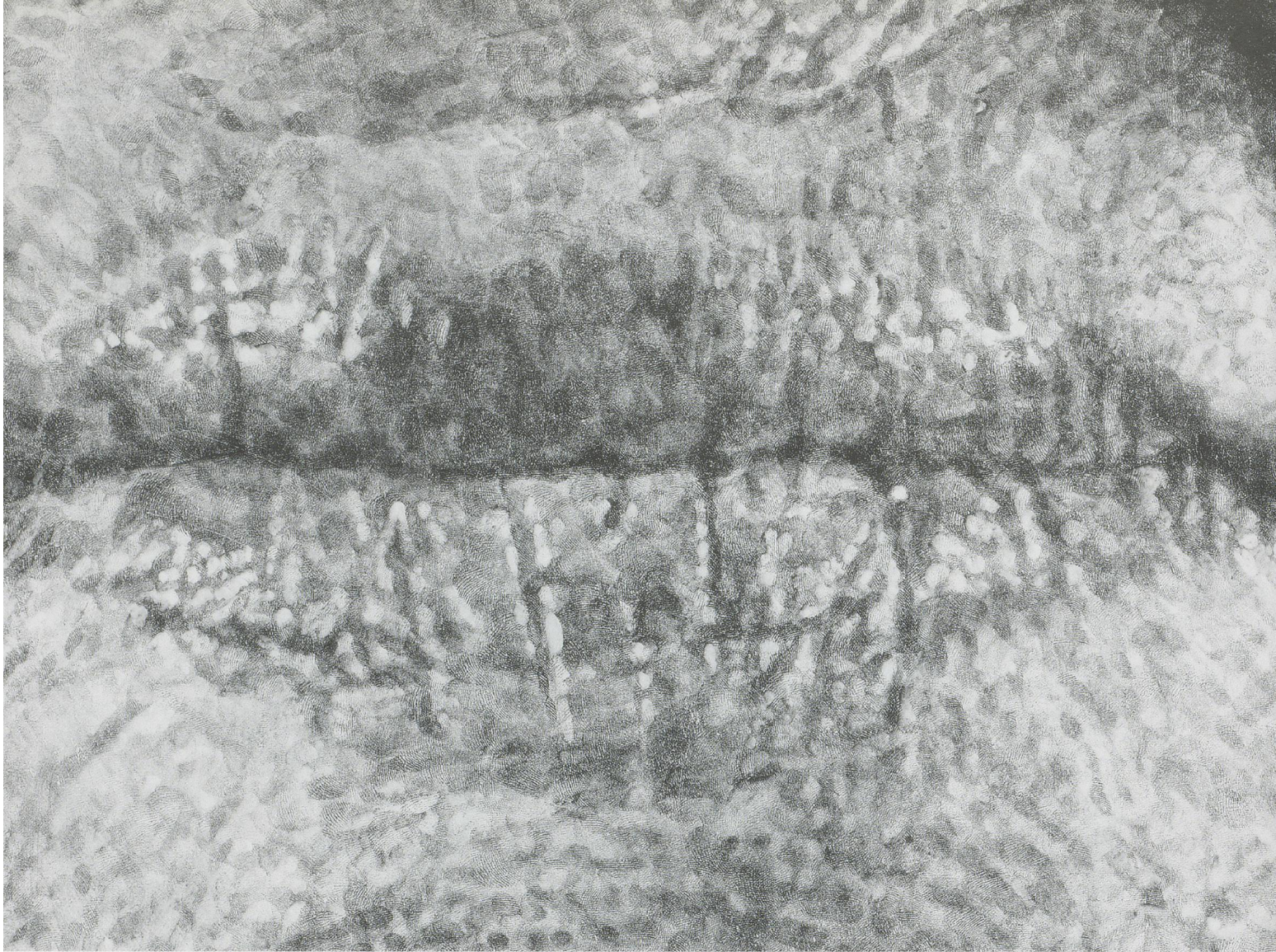
CHUCK CLOSE, FANNY / FINGERPAINTING , 1985, detail, oil on canvas / Ausschnitt, Öl auf Leinwand.

story—the incredible physicality of his words. And of course, the way they stack up to make images that tell the story. A great deal of pleasure and all of the style is rooted in those decisions.