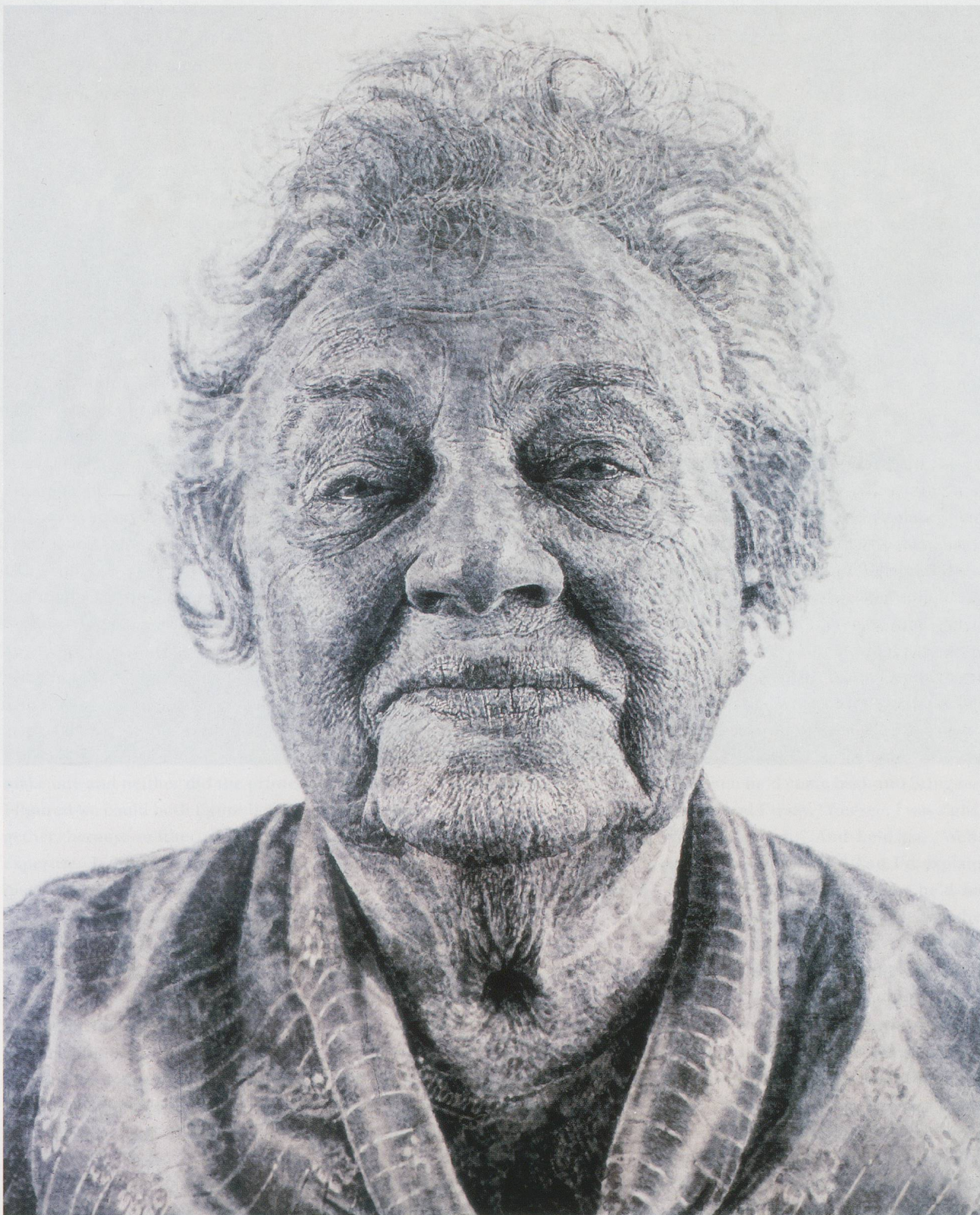
CHUCK CLOSE, FANNY / FINGERPAINTING, 1985, oil on canvas, 102 x 84" / Öl auf Leinwand, 259 x 213 cm.