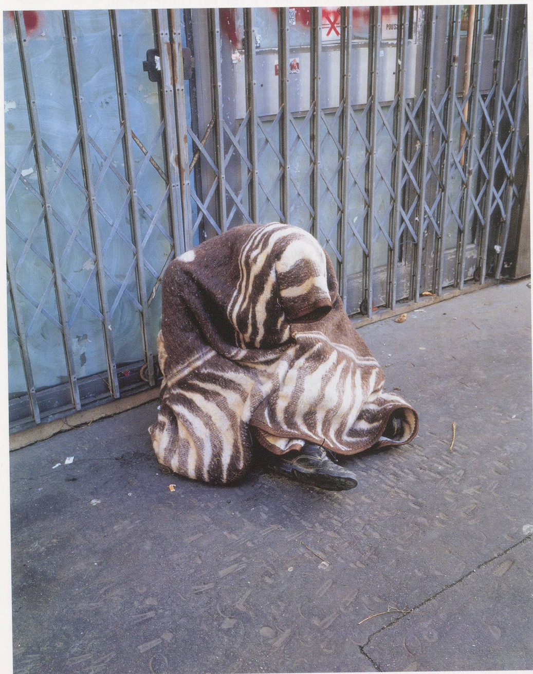
MAURIZIO CATTELAN, UNTITLED (GÉRARD), 1999, lifesize plastic dummy, clothes, shoes / OHNE TITEL (GÉRARD), Plastikpuppe, Kleider, Schuhe.