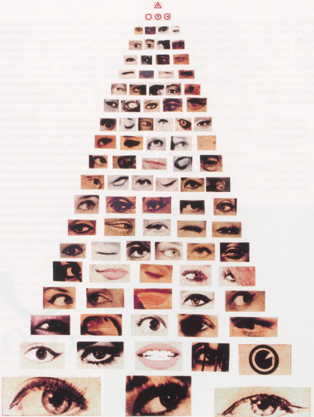
AUGUSTO DE CAMPOS, OLHO POR OLHO / EYE FOR EYE, 1964, collage of magazine clippings on cardboard, 27 7/8 x 19 1/16" / AUËE UM AUËE, Collage, 70 x 50 cm.