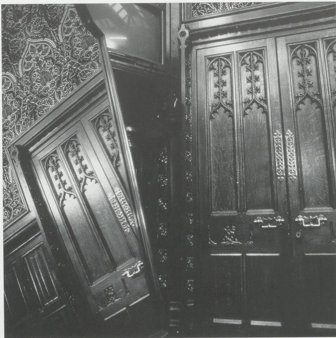
JANE & LOUISE WILSON, PARLIAMENT , 1999, House of Lords, Moses committee room, robing mirror, c-print on aluminum, 70 7 / 8 x 70 7 / 8 " / PARLAMENT, Oberhaus, Sitzungsraum Moses, Ankleidespiegel, C-Print auf Aluminium, 180 x 180 cm.